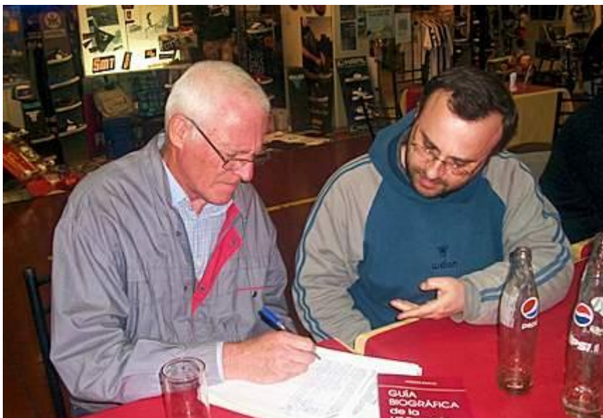
Réunion sollicitée par CEFORA

donde se informaba de la existencia de otros cafés similares al mencionado, entre ellos el de nuestra provincia. Su interés en el fenómeno OVNI se remonta al año 1986, cuando en horas de la noche y junto a otra persona, pudo observar en las inmediaciones del Barrio Viajantes (localizado en el departamento de Guaymallén) lo que definiría como una formación luminosa en V conformada por tres luces por lado, que se desplazaba a unos 45° sobre el horizonte en sentido Sur-Norte y que a una distancia algo lejana realizaría un inesperado y rápido ascenso vertical, perdiéndose de la vista de ambos testigos. También recordaba que en 1998, mientras realizaba prácticas de enduro en la zona de piedemonte, pudo ver unas extrañas marcas de quemadura en el suelo que le llamaron la atención y a las que relacionó de alguna manera con el tema OVNI.