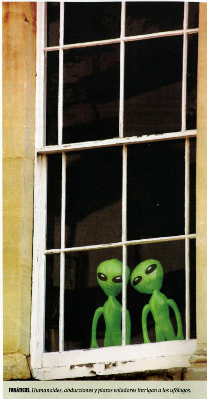
FANÁTICOS. Humanoides, abducciones y platos voladores intrigan a los ufólogos.