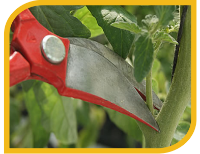
Fig. 2 Eliminación de chupones con tijera, posible fuente de transmisión.