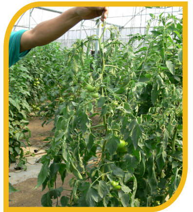
Fig. 3 Manejo de plantas infectadas.