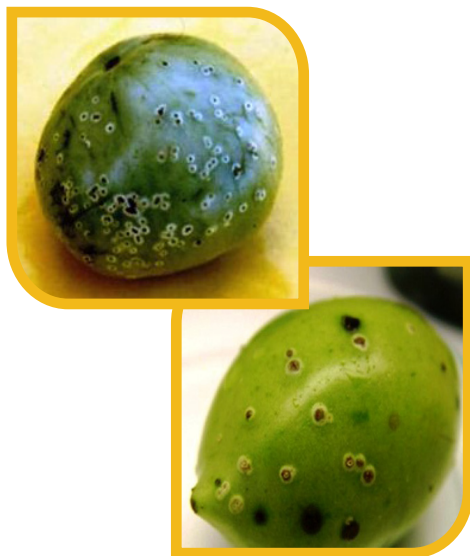
Fig. 9 Manchas en fruto “Ojo de pájaro”.

En jitomate bajo invernadero es más común observar las manchas “ojo de pájaro” asimismo, los frutos pueden asemejarse a una red marmoleada (Fig. 10), incluso las plantas también pueden estar enfermas y el fruto no presenta estos síntomas.