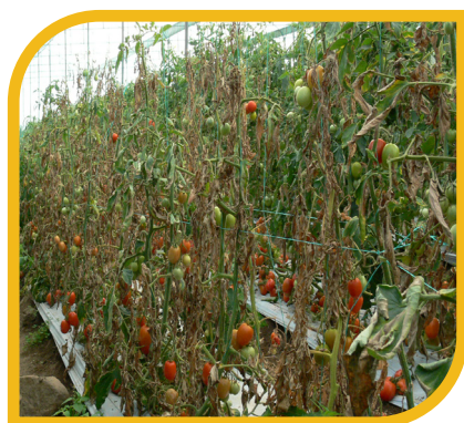
Fig. 12 Daño de cáncer bacteriano en invernadero