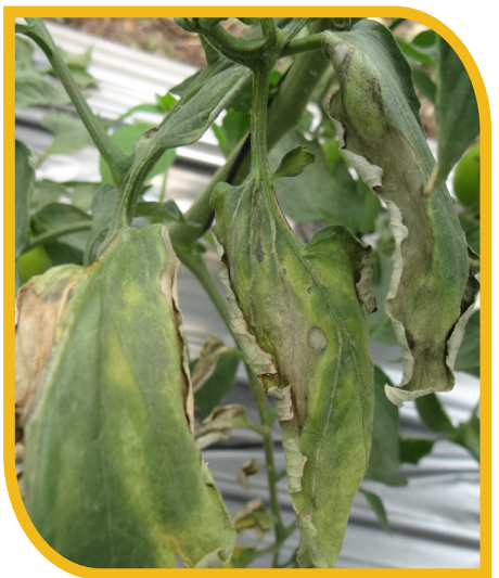
Fig. 5 Necrosis de las hojas