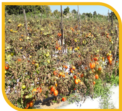
Fig. 11 Daño de cáncer bacteriano en campo

Afecta todas las partes de la planta de jitomate, ocasionando un marchitamiento sistémico y finalmente la muerte (Fig. 11 y 12).