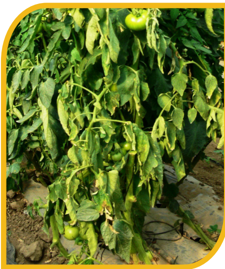
Fig. 4 Marchitamiento de planta por cáncer bacteriano