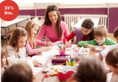
CURSO DE ADAPTACIÓN A GRADO EN MAESTRO EDUCACIÓN INFANTIL ONLINE 25% en docencia + 5% pp en el primer año y 10% en los sucesivos. (*)