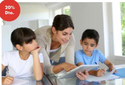
MÁSTER ONLINE EN INNOVACIÓN EDUCATIVA 20% de descuento en docencia. (*)