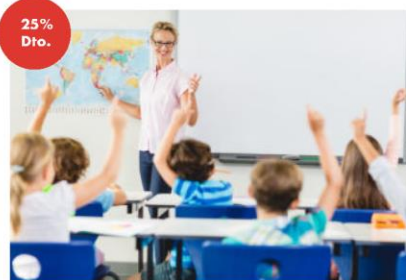
GRADO EN MAESTRO EN EDUCACIÓN PRIMARIA ONLINE 25% en docencia + 5% pp en el primer año y 10% en los sucesivos. (*)