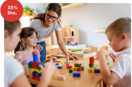
GRADO EN MAESTRO EN EDUCACIÓN INFANTIL ONLINE 25% en docencia + 5% pp en el primer año y 10% en los sucesivos. (*)