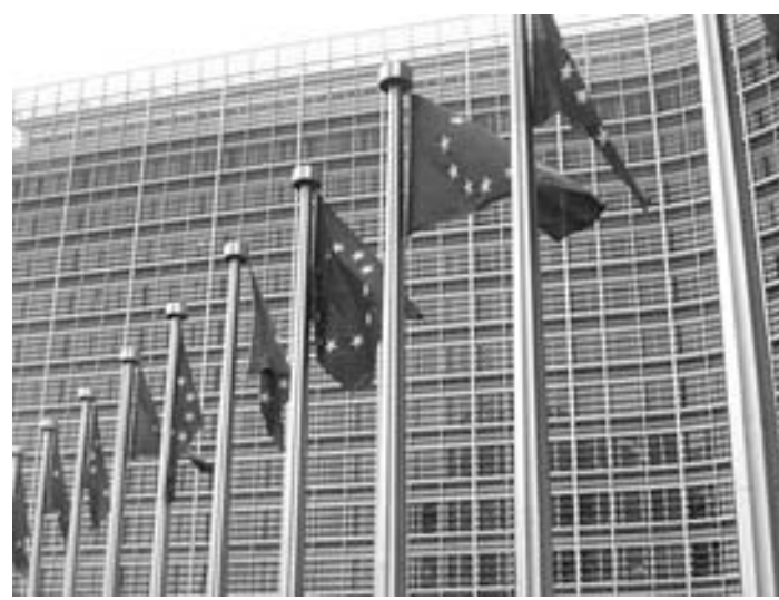
La reunión se realizará en Luxemburgo

Uno de los países europeos que se ha visto afectado por la crisis venezolana y la migración de los últimos años es España.