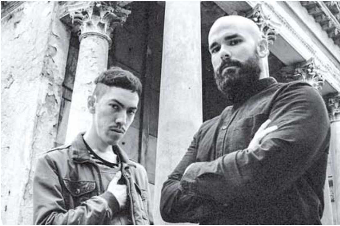
Entre España y Argentina, donde residen respectivamente, realizó el dúo su nuevo EP, "Manifesto"