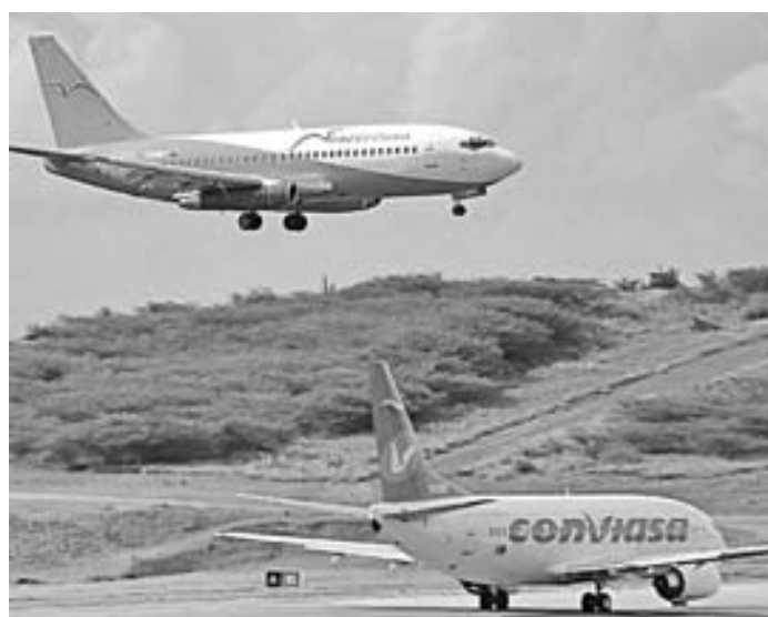
"Entre 40 y 50% de los aviones que regresan al país vacíos"

Señaló además que los hoteles ya no reciben turistas, a pesar de tener las condiciones para ello. Agregó que entre el 40 y 50% de los aviones que regresan al país lo hacen sin pasajeros, haciendo énfasis en la crisis económica actual.