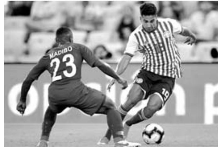
Guaraníes y asiáticos ofrecieron un interesante duelo

Argentina es última del grupo con Colombia como líder.