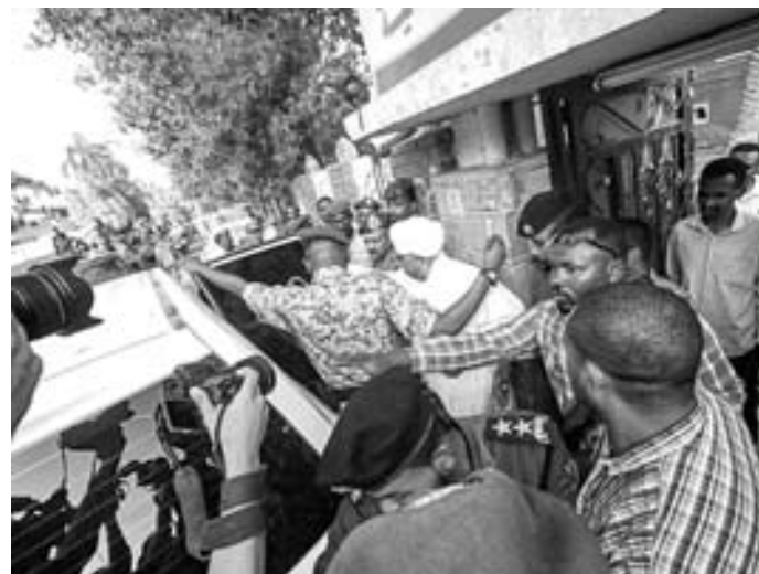
El expresidente sudanés, Omar al Bashir, es escoltado a un vehículo

Omar Al Bashir fue destituido y arrestado por el ejército el 11 de abril en Jartum, tras un movimiento de protesta sin precedentes, desencadenado en diciembre por un aumento del precio del pan.