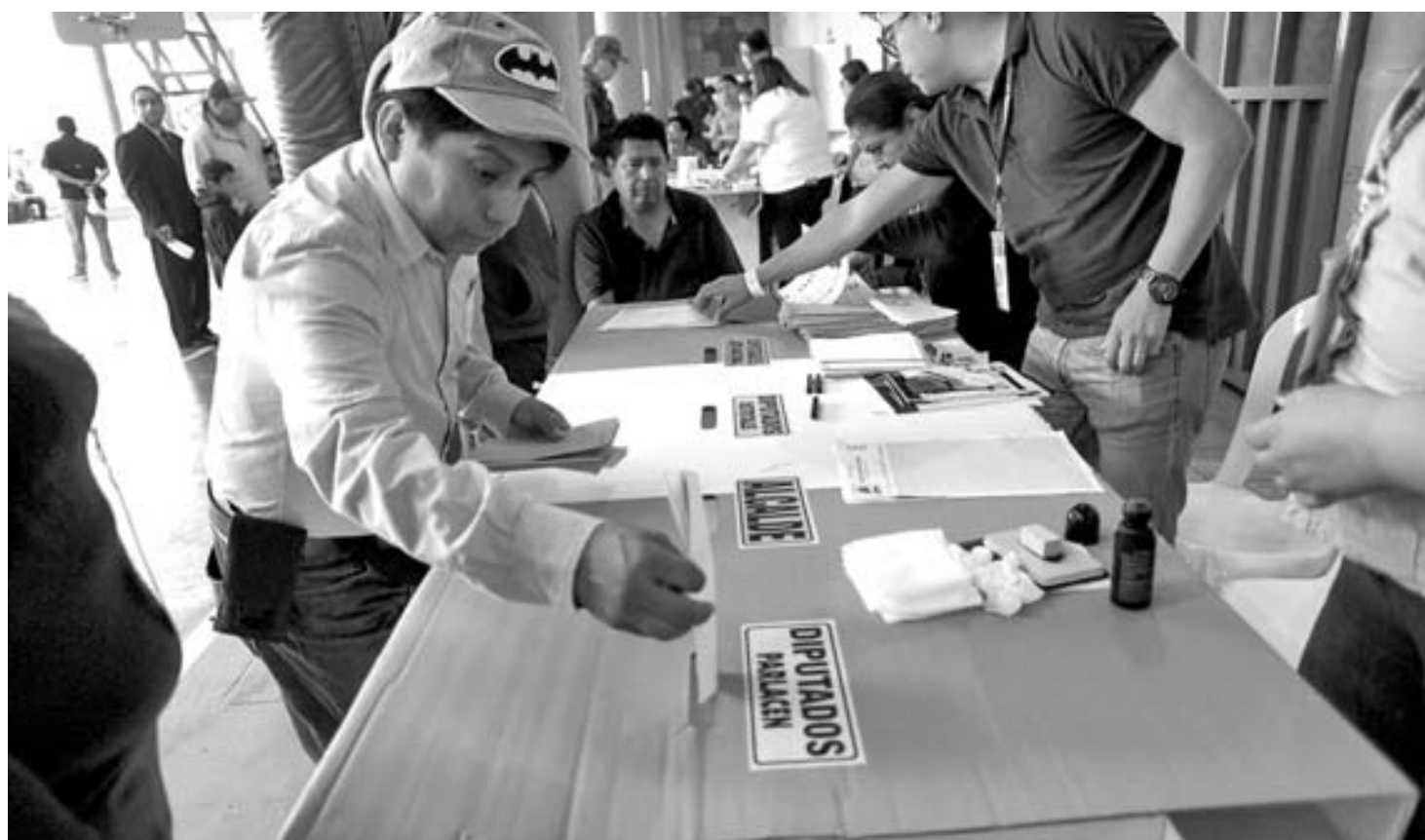
Los guatemaltecos, cansados de la corrupción, votaron para elegir a un nuevo presidente el domingo después de una campaña tumultuosa