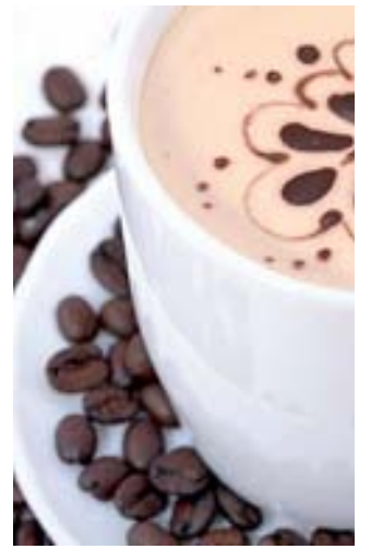
Su efecto es duradero utilizado de formas constante CORTESÍA

"Las ONG hacemos lo que podemos: apoyamos con donaciones de medicamentos que nos llegan, apoyamos a los familiares, pero la recuperación de toda la estructura de salud solo puede hacerse con los recursos del Estado".