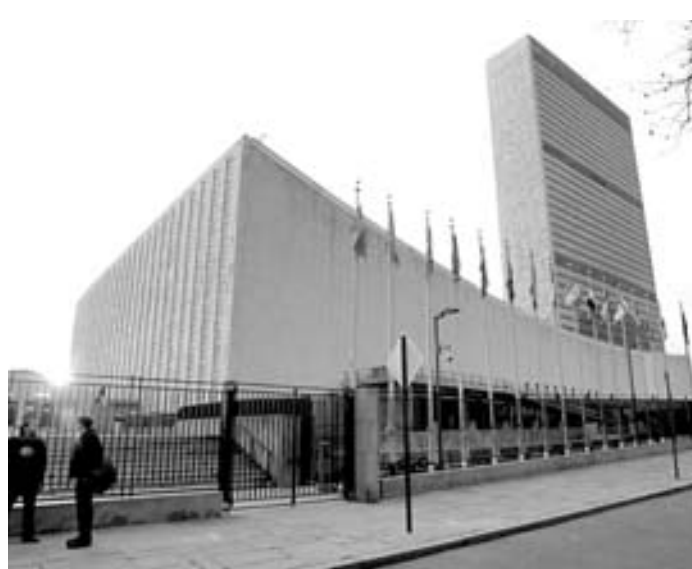
Según la ONU en el Caribe los flujos cayeron 32%.