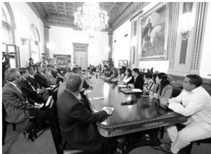
Es necesario conocer los avances concretos en las negociaciones.

Santolo asegura que hay una prédica del cese de la usurpa-