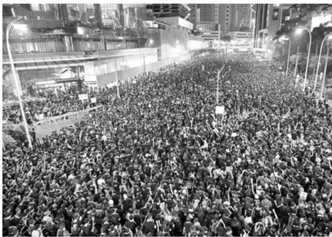
Cientos de miles de manifestantes ahogaron las calles de Hong Kong por segunda ocasión