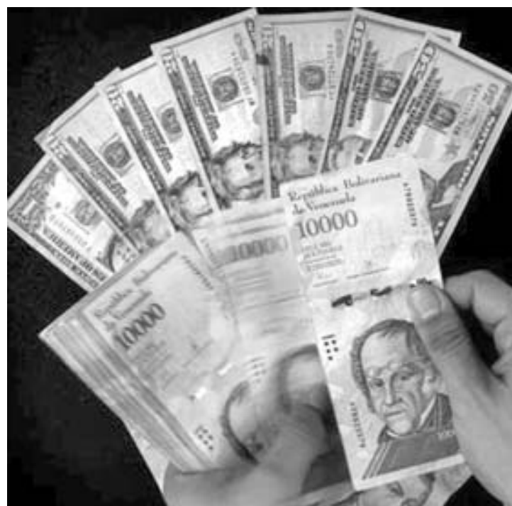
La liquidez monetaria aumentó 669,6% en lo que va de año.

Sin embargo, en una economía como la nuestra donde el