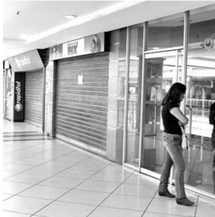
Empresarios se quejan por las pocas ventas. LUIS MORILLO

posición de los comerciantes de derogar la Ley de costo y precios justos por considerar que se trata de una legislación "supresora que atenta contra la actividad comercial, que también se ha visto afectada por la voracidad fiscal del gobierno". "Todos los días recibimos reportes de comercios que han tenido que cerrar y los que han intentado nuevamente abrir deben enfrentar obstáculos para obtener financiamiento debido a la crisis económica".