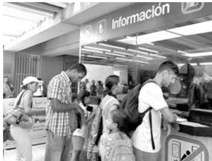
Costo del boleto quedó en 40 bolívares

La tarifa contempla el transporte subterráneo de Los Teques, y los sistemas ferroviarios Caracas-Cúa, Valencia y Maracaibo.