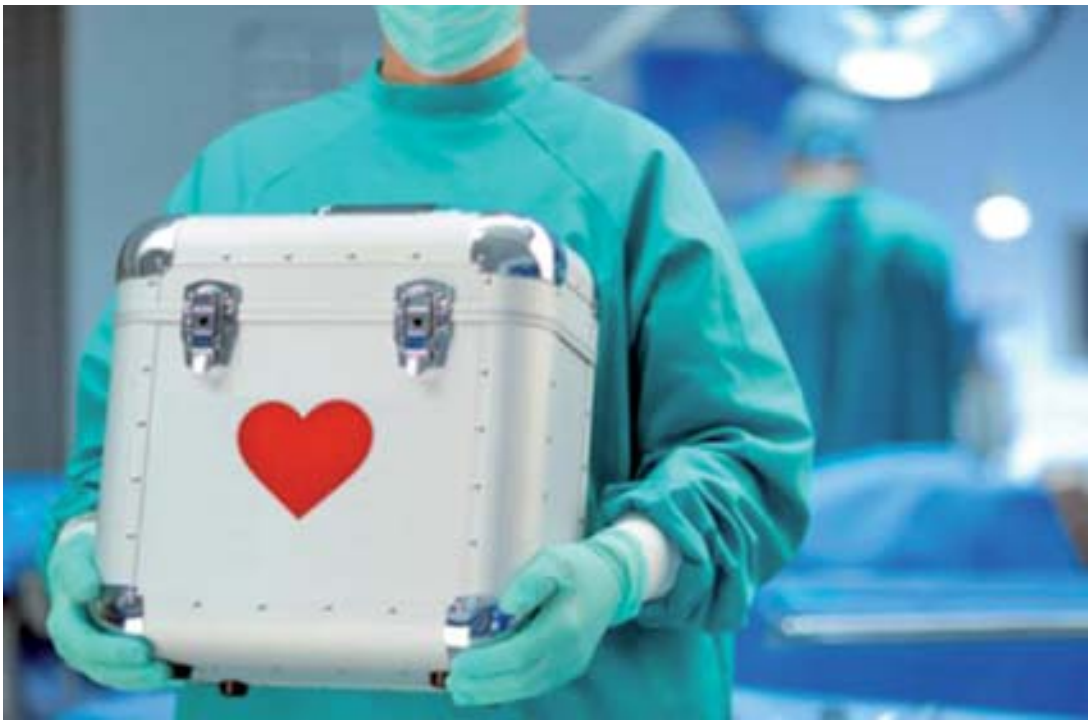
10% de afectados por falta de trasplante son niños