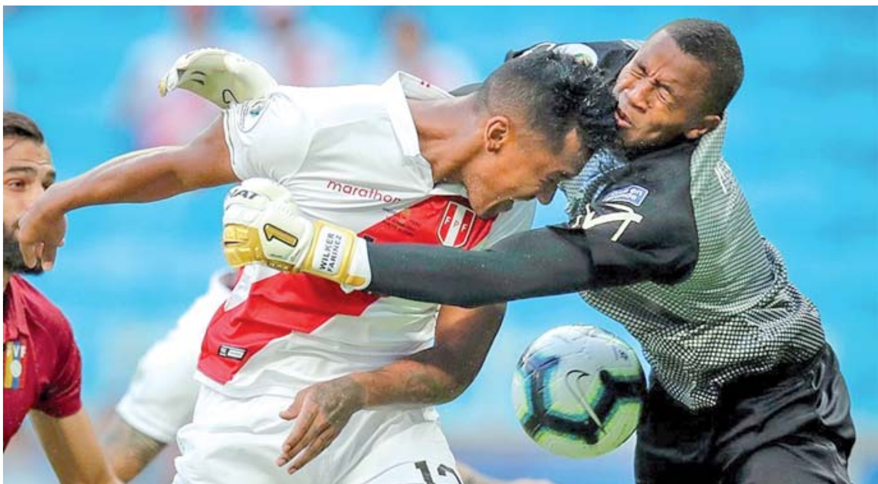
El arquero caraqueño de 21 años, titular con Millonarios de Bogotá, recibió elogios del técnico Rafael Dudamel, así como de sus siguientes rivales brasileños en la contienda