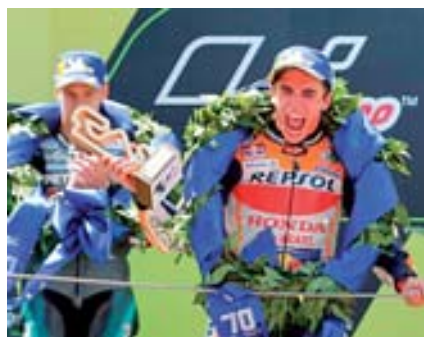
El piloto español continúa sin enemigos a la vista en la temporada

El piloto español de Honda venció en el Gran Premio de Cataluña en el circuito de Montmeló, ampliando su ventaja en cabeza del mundial de la categoría. Márquez se impuso sobre la meta al francés Fabio Quartararo, quien fue segundo en su primer podio cosechado en la categoría reina. 6