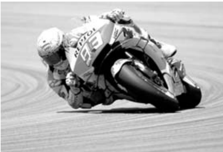
El corredor español impuso su ritmo en Barcelona

El piloto de Honda se impuso en MotoGP en el circuito de Montmeló