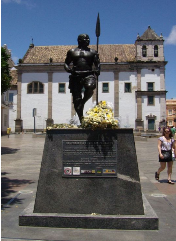
Zumbi - Márcia Magno (Escultura - 2,20 metros de altura e pesa 300 Kg. Centro histórico Salvador, Bahia - Brasil.)