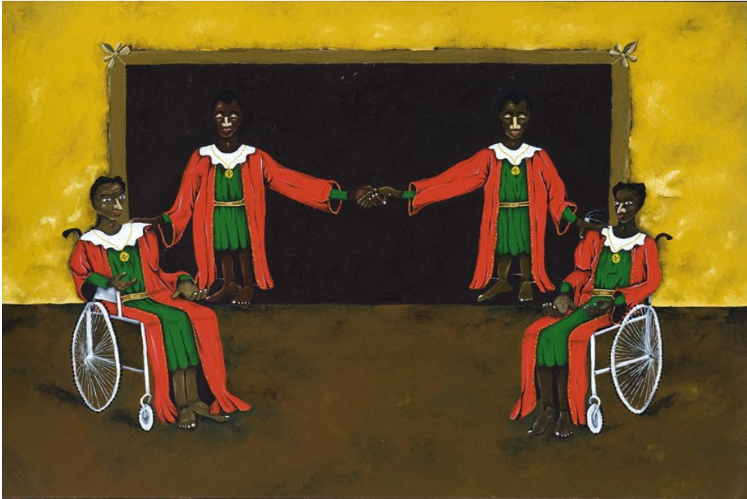
2º Gemelar - Dalton Paula

(Óleo sobre lienzo - 2008. Foto: escaneada del catálogo Naïfs: Bienal naïfs do Brasil 2008. São Paulo, Brasil.)