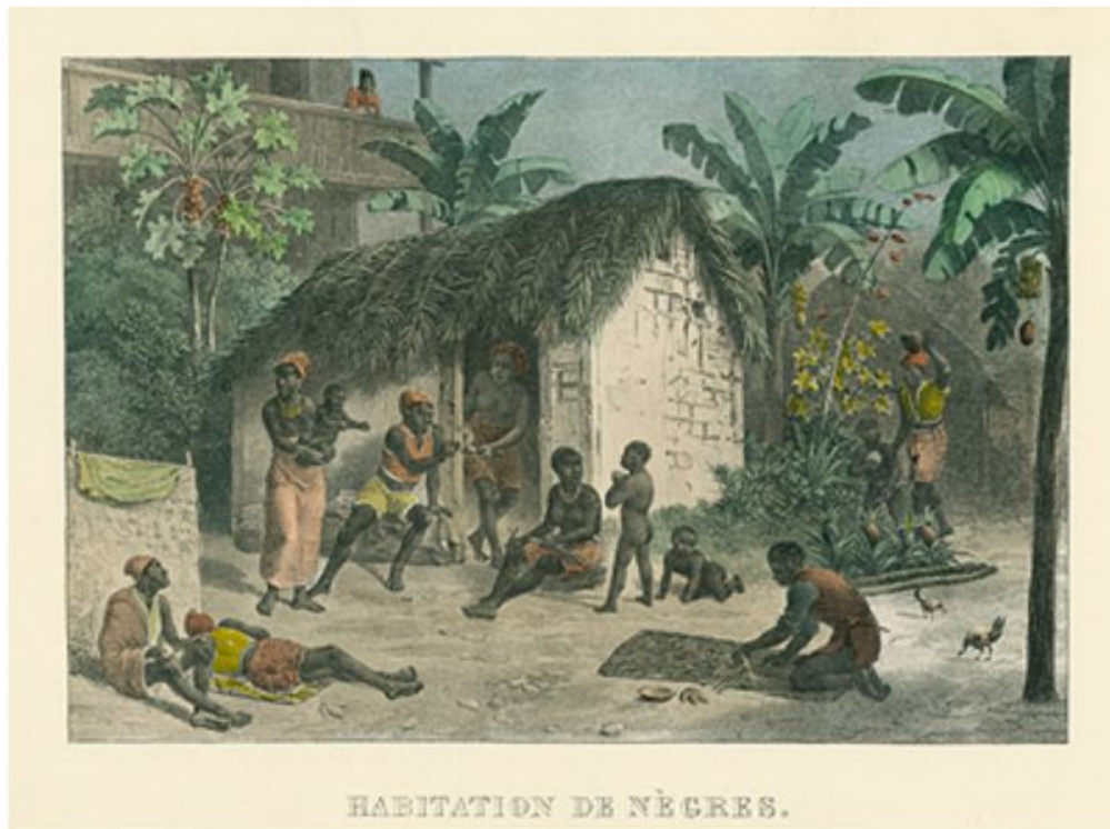
Casa de Negros - Johann Moritz Rugendas (Litografía sobre papel, 1835)