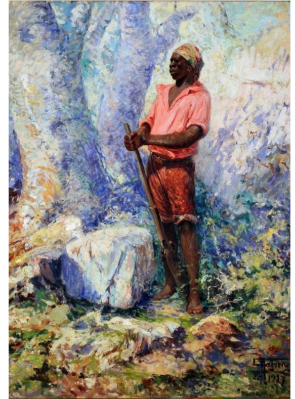
Zumbi - Antonio Parreiras (Óleo sobre tela. 1927.Acervo do Museu Antonio Parreiras, Niterói, Rio de Janeiro - Brasil.)