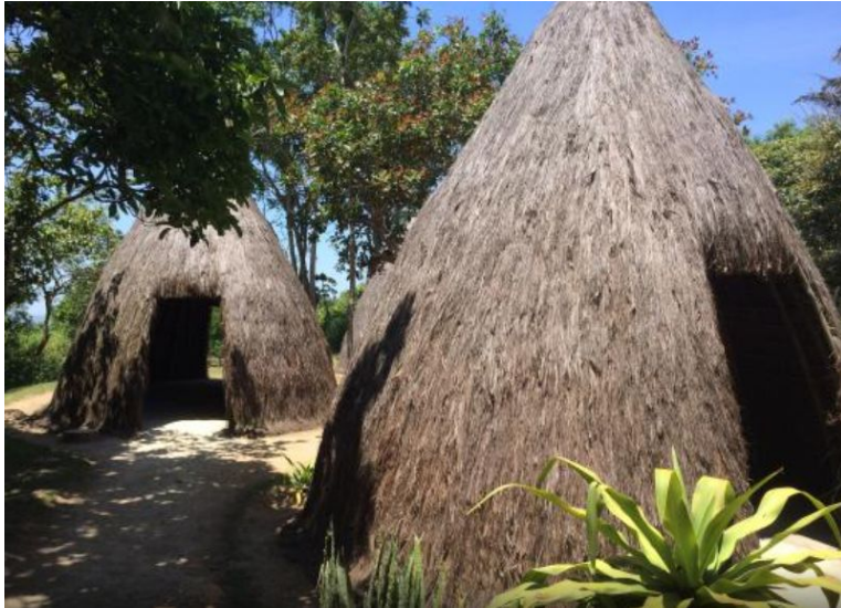
Foto actual - Viviendas típicas del Memorable Quilombo de Palmares.