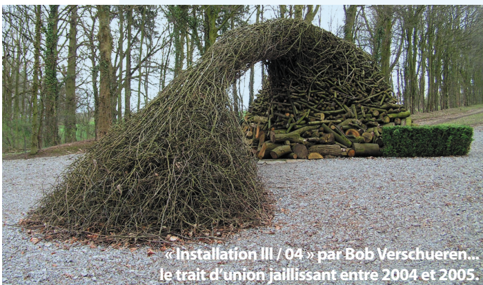
« Installation III / 04 » par Bob Verschueren... le trait d'union jaillissant entre 2004 et 2005.

Depuis 2001, le parc et les jardins du Château de Jehay (Amay) accueillent chaque été une exposition en plein air sur une thématique précise. Les artistes sont amenés à créer en symbiose avec l'environnement du domaine une œuvre originale relative au thème choisi. Pour cette 5 e édition, les organisateurs ont opté pour un matériau végétal indémodable : le bois. Intitulée « A travers bois », l'exposition est accessible au public depuis le 5 juin dernier et jusqu'au 25 septembre prochain.