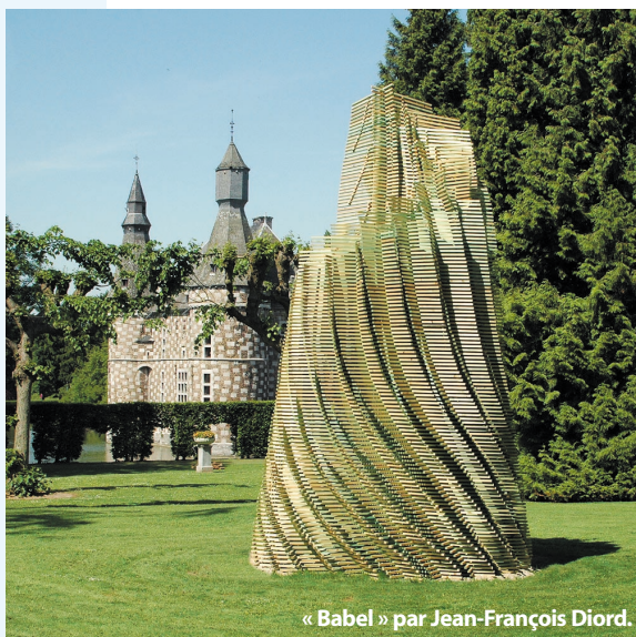
« Babel » par Jean-François Diord.