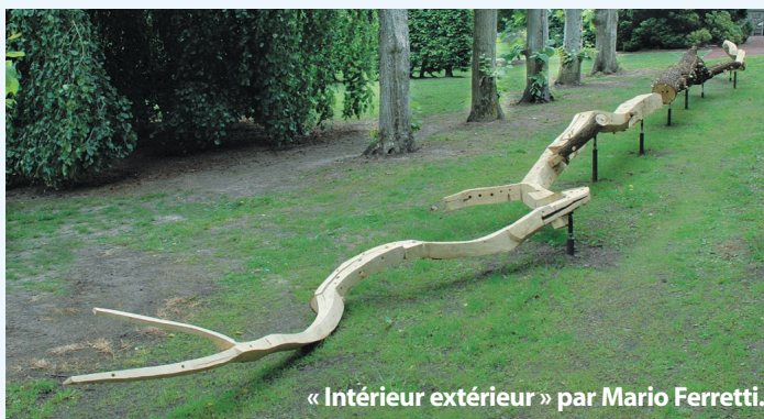
« Intérieur extérieur » par Mario Ferretti.

passé (35.000 entrées). Venez donc nombreux (re)découvrir cette matière première, le bois, dessiné, contrôlé et réinventé le temps d'un été.