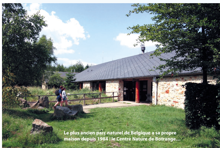
Le plus ancien parc naturel de Belgique a sa propre maison depuis 1984 ! Le Centre Nature de Botrange...

Des 9 parcs répertoriés en Belgique, le Parc Naturel Hautes-Fagnes Eifel est le plus ancien du pays. Son rôle consiste essentiellement à concilier les actions favorables à l'environnement et à la nature avec les initiatives économiques néces-