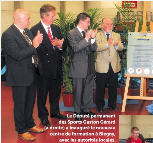
Le Député permanent des Sports Gaston Gérard (à droite) inaugure le nouveau centre de formation à Blegny, avec les autorités locales.

Depuis 1978 et la création de son Service des Sports, la Province de Liège n'a eu de cesse de développer sa politique sportive, à la fois comme outil d'épanouissement et de bien-être pour le plus grand nombre mais aussi comme instrument fondamental pour la construction d'une image internationale positive du Pays de Liège.