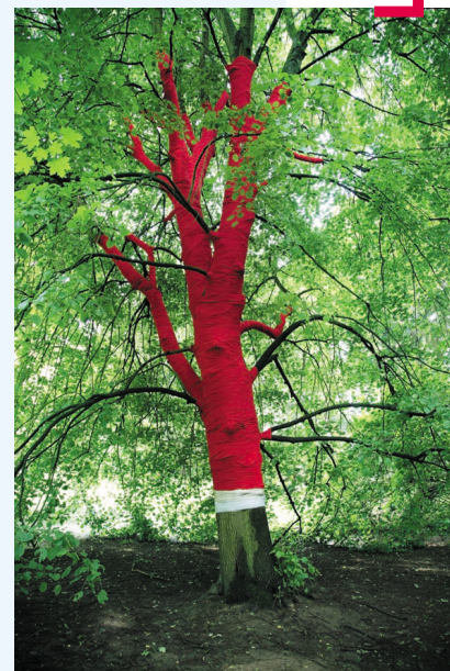
Treeflame 1 - the castle, Adri AC de Fluter

9/07 : trio guitare, violoncelle et chanteuse ouzbèke russophone 16/07 : jazz classique et contemporain 23/07 : jazz manouche 30/07 : musiques du monde 6/08 : improvisations sur des thèmes traditionnels d'Inde du Nord 13/08 : fusion du style Django et du be-bop basée sur des compositions de deux guitaristes et des standards de jazz 20/08 : récital de musique sud-américaine 27/08 : ensemble Orchestral Mosan (Gran Partita pour 13 instruments de Mozart à l'occasion du 250 e anniversaire de sa naissance)