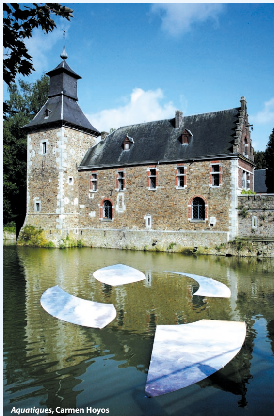
Aquatiques, Carmen Hoyos

Pour sa 6 e édition, l'exposition de sculptures en plein air au Château de Jehay s'abandonne aux délices poétiques. Dix artistes plasticiens ont réalisé une intervention dans le périmètre de leur choix. Mobiles flexibles, modulables, malléables, déformables, sonores, lumineuses, colorées... Une véritable fête des sens! page 7