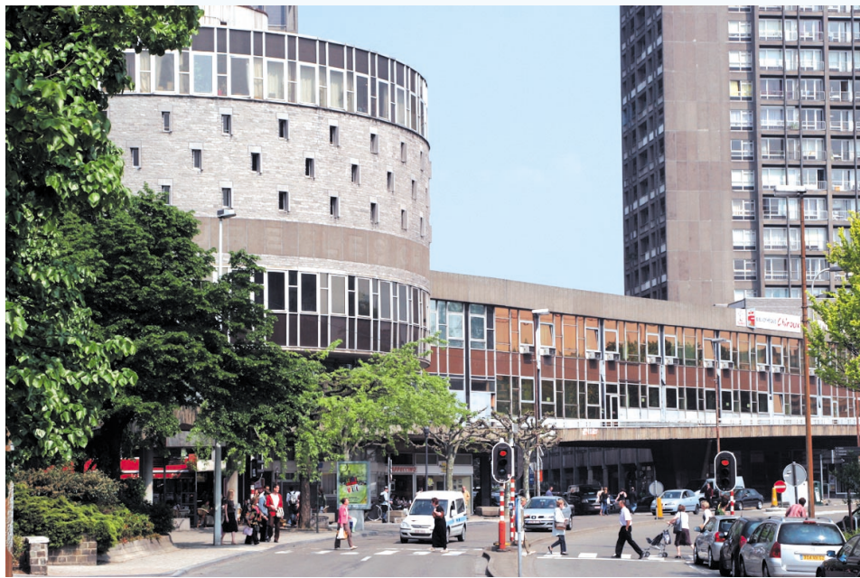
Un nouveau fil d'Ariane pour aider les lecteurs de la plus grande bibliothèque publique en communauté française.

Dans les rayons, les 1.500 lecteurs quotidiens des Chiroux constateront également une évolution. Leur situation pourra être communiquée instantanément par le bibliothécaire et le système empêchera automatiquement le dépassement du nombre de prêts autorisés. C'est