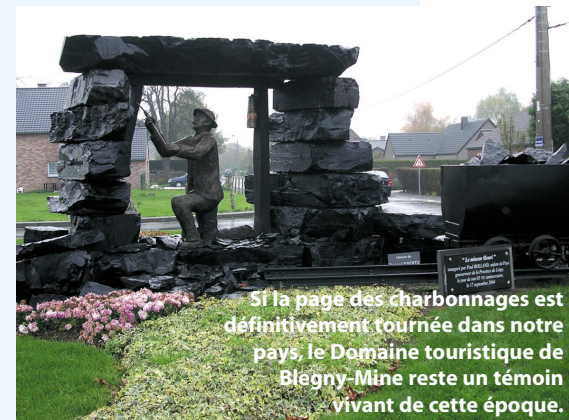
Si la page des charbonnages est définitivement tournée dans notre pays, le Domaine touristique de Blegny-Mine reste un témoin vivant de cette époque.

Si cette aventure vous intéresse, ce super-programme vous est proposé jusqu'au 15 juillet