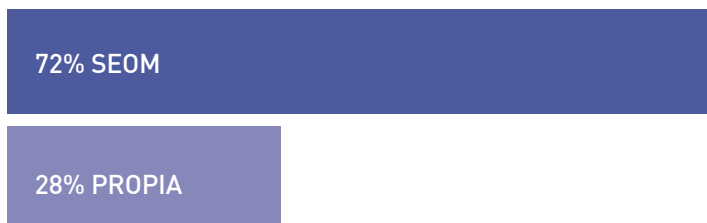
Figura1. Sede de los Grupos Cooperativos

Asimismo, once Grupos Cooperativos tienen personal propio contratado (GECP, GEICAM, GEICO, GEIS, GÉTICA, GETNE, GG, SOGUG, SOLTI, TTCC y TTD) destacando en primer lugar GEICAM con 103 personas y en segundo lugar SOLTI con 62. El número total de socios y de Hospitales miembros depende fundamentalmente de la patología tumoral que incluye y de la antigüedad de los Grupos Cooperativos. El número de socios oscila entre 65 de GECOD y 875 de GEICAM, mientras que el número de centros varía entre 52 (GOTEL) y 201 (GEICAM).