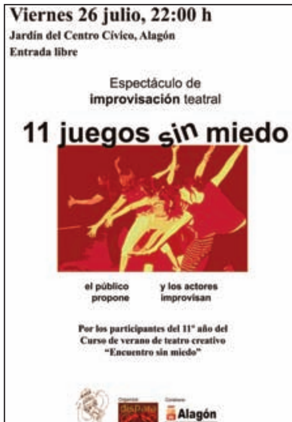
Carteles de los espectáculos que prepararemos en el curso.