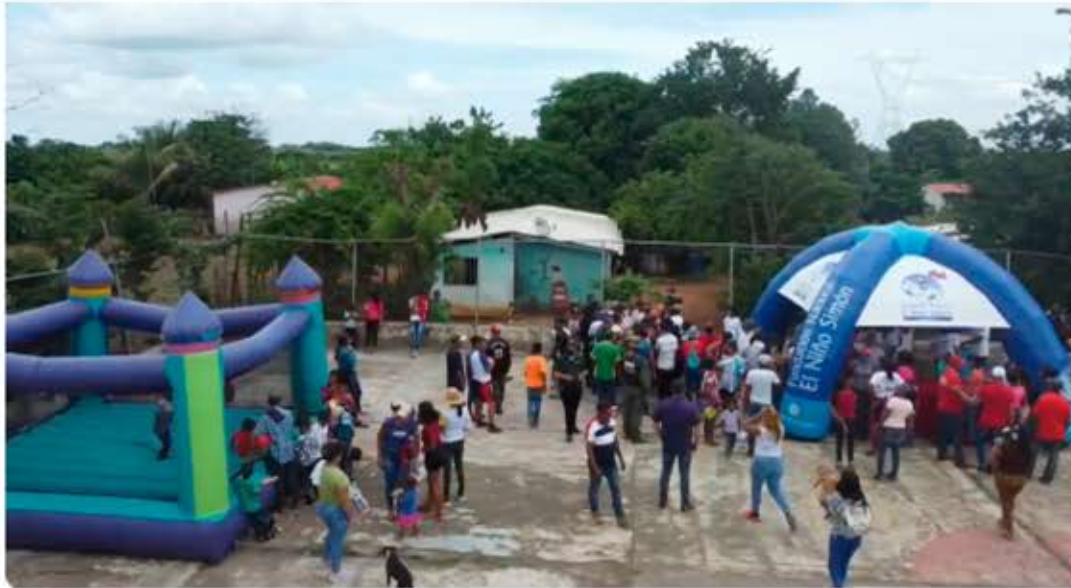
La Frnsa llevó alegría a los niños de Samanito FOTOS CIUDAD MCY

Cabe mencionar que, durante su gestión de gobierno, la mandataria regional ha prestado especial atención a estas zonas rurales de la entidad, de las que en diversas ocasiones ha señalado