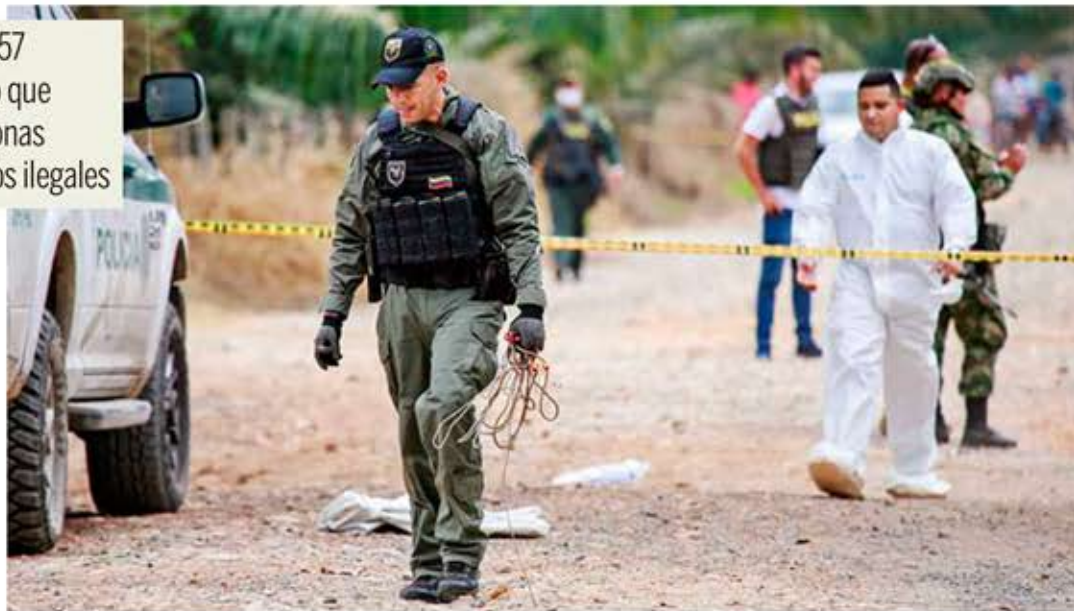
Con estas tres masacres suman 57 desde el inicio del año a la fecha

Los agentes llegaron hasta el punto donde se encontraban los jóvenes que intentaron huir e hirieron a uno de ellos, luego de subirlos a una patrulla con vida los