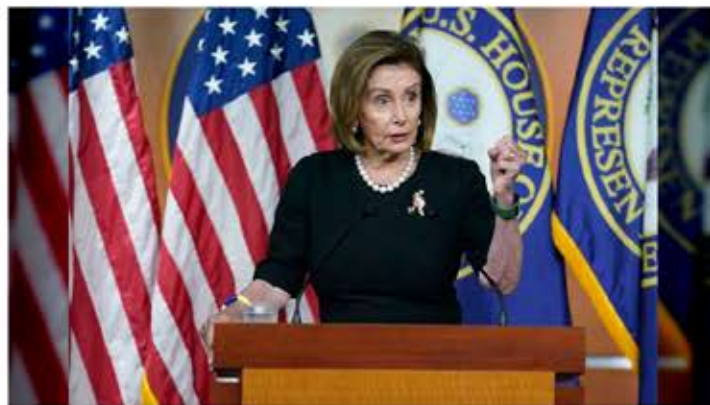
La visita a de la presidenta del Congreso de Estados Unidos es una amenaza a la paz y la estabilidad de Taiwán