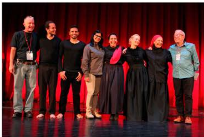
Gobernadora Karina Carpio estuvo presente en la obra “Destino Libertad”

Por otro lado, se puede decir que este trabajo enamoró al público con la recopilación de tres obras de teatro en una especie de monólogo, mostrando el papel prominente de la mujer transmitiendo sus grandes