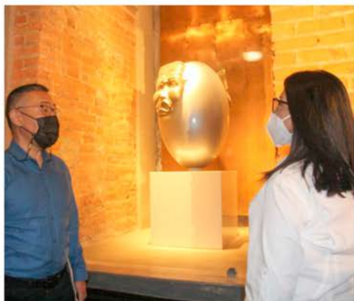
La gobernadora, junto al ministro Villegas, durante una visita previa al Festival

La palabra progresista habla del desarrollo de un estado de bienestar, por eso el lema del festival es "Hacer más Humana la Humanidad", por lo que se refiere a un llamado de consciencia hacia las nuevas generaciones.