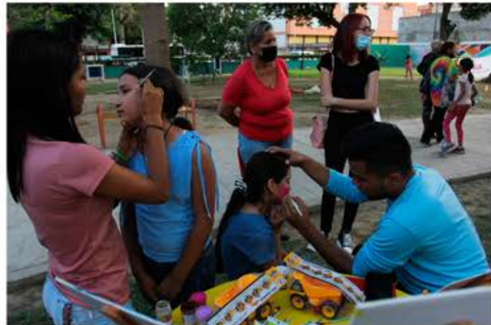
Diversas atracciones estuvieron a disposición de los infantes y adolescentes