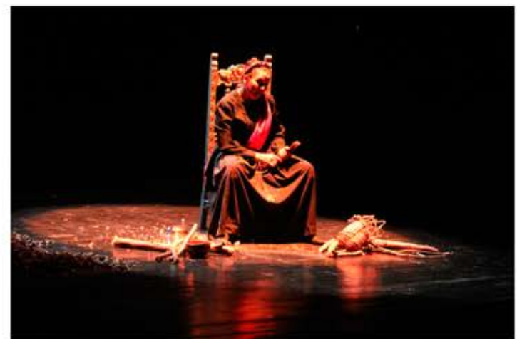
“Mi nombre es viento”, obra de teatro que narra la historia de Juana Azurduy