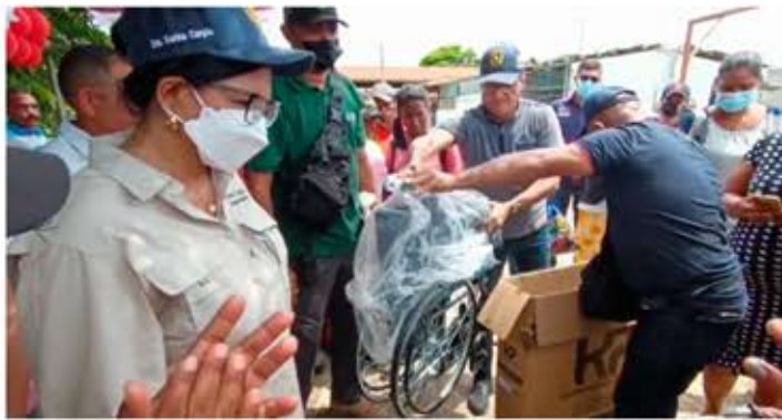
Ayudas técnicas fueron entregadas a los vecinos de este sector del sur de Aragua

regresar con marcadas impresiones de los testimonios recogidos, por lo que su compromiso se mantiene latente.