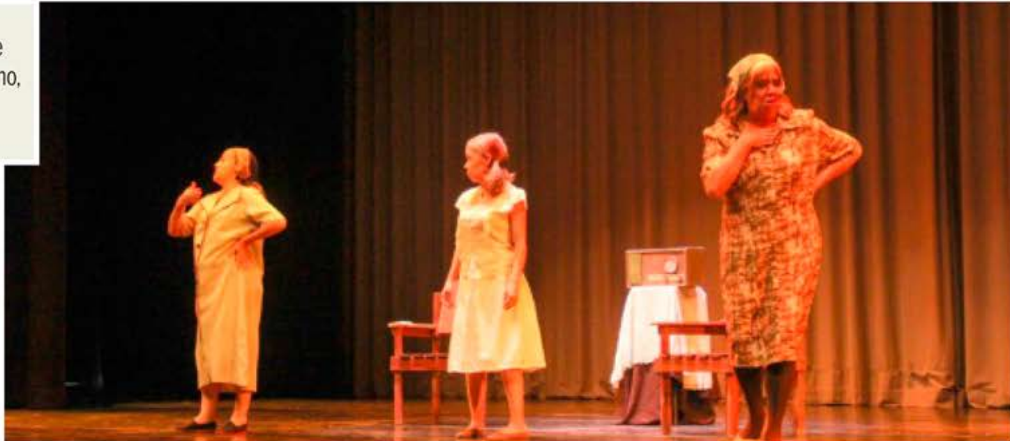
Artistas nacionales e internacionales se darán cita en el TOM