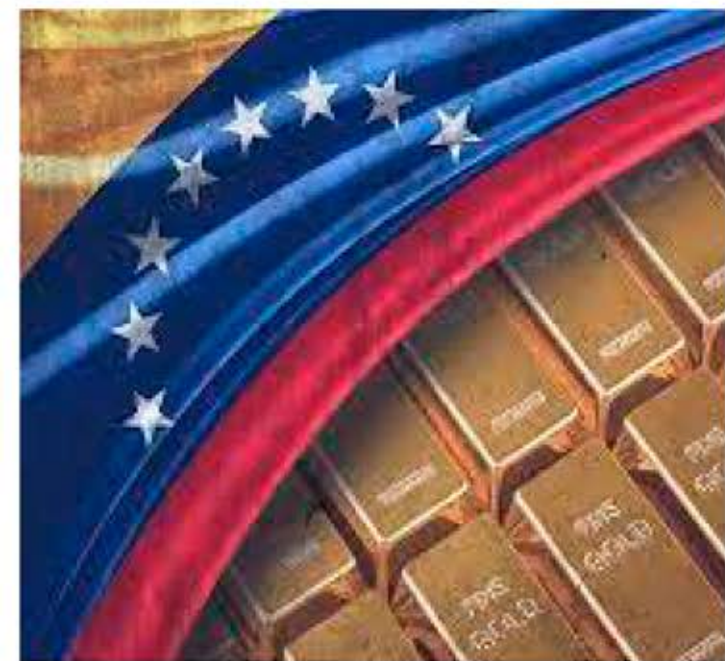
El pasado 29 de julio, la vicepresidenta Ejecutiva de la República alzó su voz para rechazar la decisión de tribunal británico