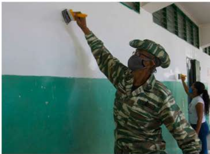
Bricomiles trabajando en perfecta unión cívico-militar