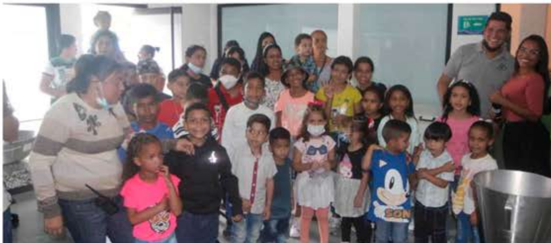
Los pequeños conocieron el proceso de elaboración de los helados

La atracción de la tarde, que estuvo cargada de juegos y mucha diversión, tuvo su momento favorito a través del recorrido guiado por la heladería, en el que el grupo de homenajeados pudo conocer el proceso de elaboración de un delicioso y cremoso helado, en el cual se mostraron muy interesados en cada momento y, a su vez, ansiosos por finalmente escoger entre más de 15 sabores existentes y tener así la oportuni-