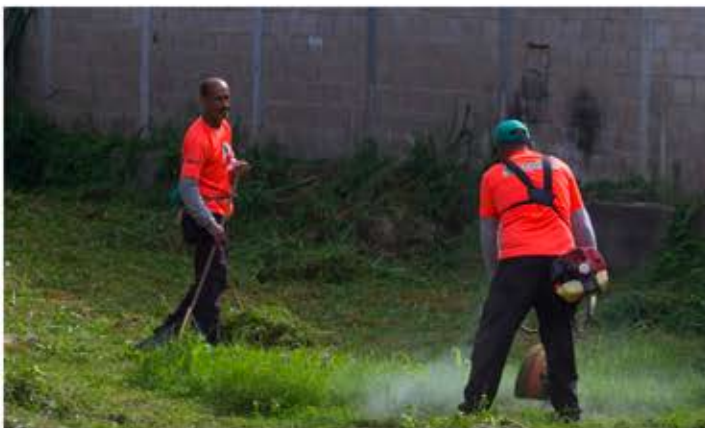
Integrantes de la Bricomiles en el municipio Santiago Mariño en labores de embellecimiento de áreas verdes

portante, pero también es importante la humanización en nuestros colegios, la sensibilidad en cada uno de estos componentes".