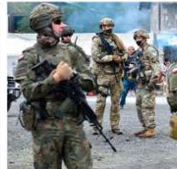
Las fuertes tensiones hicieron retroceder las normativas kosovares

La política fundamental del Gobierno chino respecto a Taiwán es la reunificación pacífica bajo el principio "un país dos sistemas".