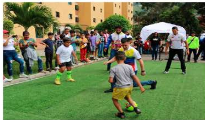
La primera oferta será de lunes a viernes, durante seis semanas, hasta el 11 de septiembre

Además, agregó que, "en cada estado habrá puntos centrales para la tercera oferta, que son los campamentos deportivos denominados Tribilines y Campeones en materia de