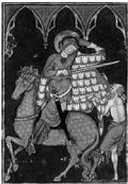
San Martín de Tours

cantidades en especie que solían ser de una fanega de trigo.