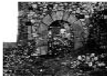
Arco del Hospital a principios de los 70.

En otras ocasiones el hospital tiene que acometer unos gastos imprevistos motivados por el clima, y en 1657 se apuntan 57 reales que gasta el mayordomo “con unos pobres que les cogió en este dicho lugar una niebe grande” (fol. 20v). Parece ser que entre las funciones del hospital estaba la de atender otras circunstancias. Así, con el dinero del hospital se sufraga el gasto de traslado de una “muxer que llevaron a Zaragoza loca, que mandó el señor cura que se los diesen treinta i seis reales” (fol. 18v). En 1675 se ordena que “se ponga en uno de los aposentos más