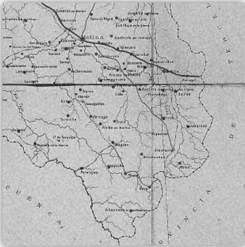
El camino de Molina en una mapa de Guadalajara del siglo XIX.

te camino tanto hacia Teruel y Albarracín como a Molina, fundamentalmente en el periodo en que Villacampa estuvo en la zona y había que suministrar raciones a sus tropas 4 .