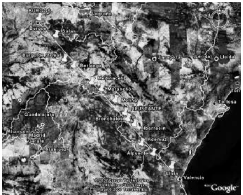
Itinerario de Valencia a Burgos.

Así, se destaca que "los del lugar de Albarracín e de su término pasan con sus cosas e sus mercaduras por el término de Motos, aldea de Molina, e non pueden yr por alualá a la villa de Molina para dar sus derechos al rey de Castiella". Por esta ra-