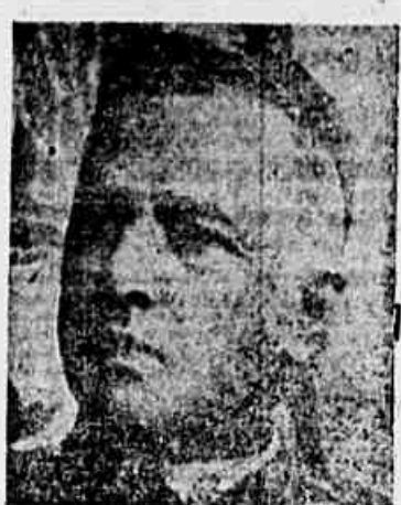
Cardeal Arcoverde Cavalcanti

Os 24 volumes da sua interessante, e bella obra intitulada "Biblioteca Internacional", que acabo de passar pela vista, deixaram-me a impressao de um empreendimento de grande utilidade e valor incontestavel. Felicitando calorosamente a V. Sa. por tão bella iniciativa, asseguro-lhe que não deixarei de chamar a atençao de todos os meus amigos para tão importante publicaçao, tal o entusiasmo que ella me despertou.