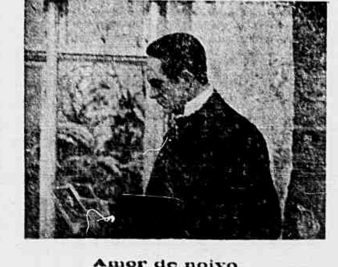
Amor de noivo