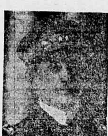
Almirante Estevão Adelin Martins

Acho o trabalho de utilidade incontestavel, representando um esforço digno dos maiores encunios e de toda a animaçao. Vem preencher uma lacuna em nosso meio, onde os bons livros são podiam ser apreciados pelos conhecedores de idiomas estrangeiros; hoje estão ao alcance de todos. Foi sem duvida um trabalho precioso esse de pôr diante dos olhos de toda gente, vertidos em portuguez, trechos escritos em todas as linguas pelos mais notaveis philosophos, historiadores e homens de letras do mundo inteiro.