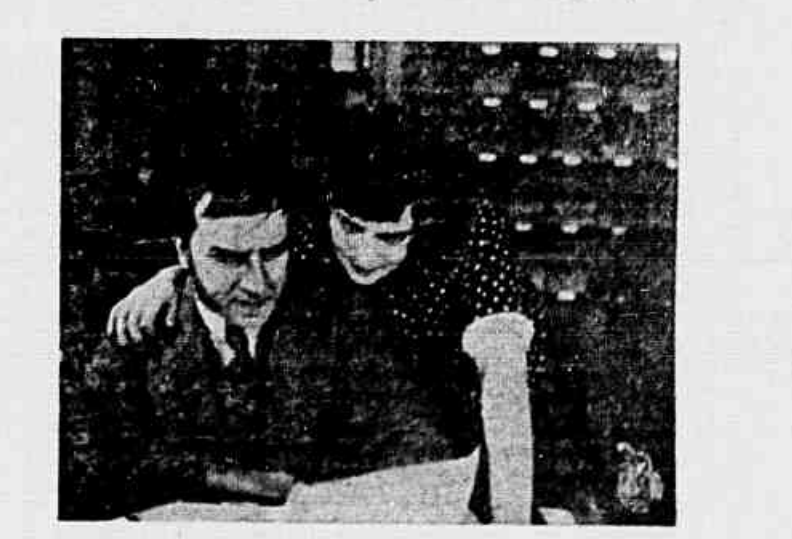
Plano de "chantage"