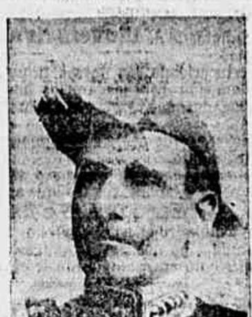
Marechal Hermes da Fonseca

Essa é um trabalho de muito, que põe em evidencia a energia e dedicacão de todos quantos nelle se empenharam e o levaram a cabo. Trata-se de uma vasta e variada colleccao de trechos de autores classicos ou de nota, colligidos sem preoccupacão ou prejuizo, por amor da exactidão, reconhecendo que alguns desses trechos podiam ter sido excluidos da colleccao, sem de leve prejudicall-a, mas isso, não obstante, podemos dizer que é uma tentativa digna de applausos, que põe em evidencia a energia e boa vontade de todos quantos a ella se applicaram e pela tomaram parte.