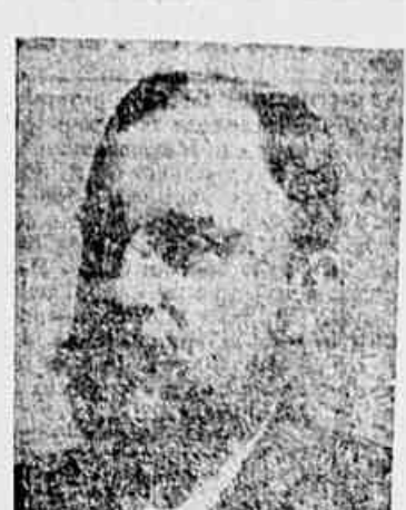
Conde de Frontin

Hoje, depois de completar a leitura dos exemplares entregues sinto-me lico affirmando que adquiri uma obra de alto valor, prestando a Sociedade Internacional inestimavel servico aos estudiosos.