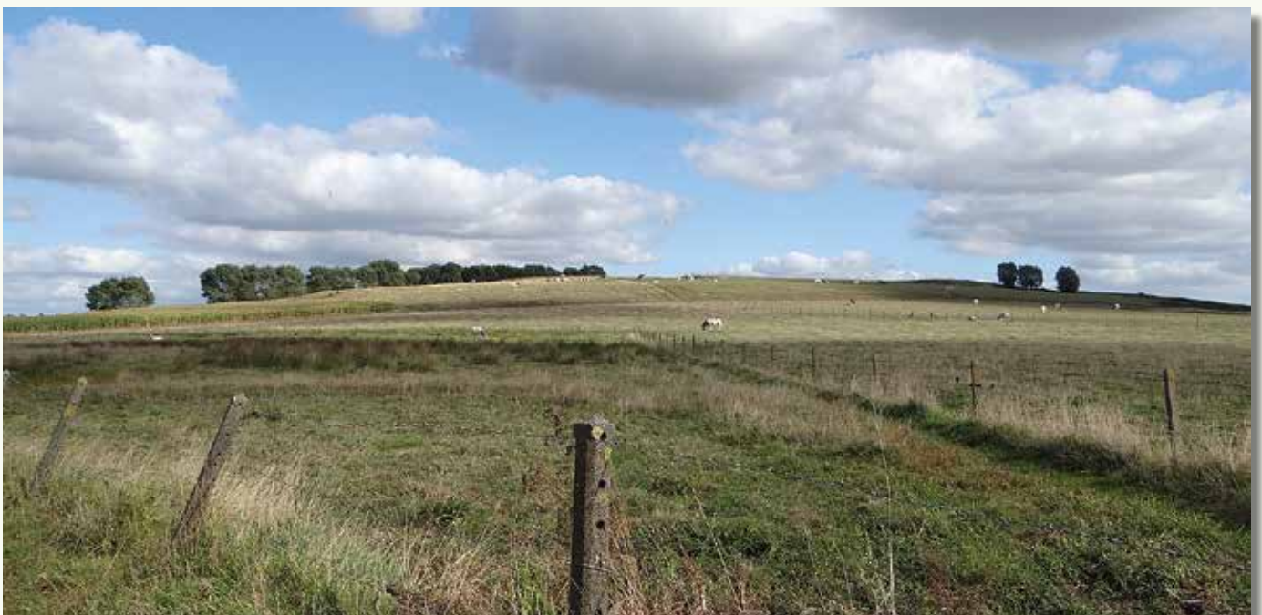
Zicht op de Koekelareberg vanuit de Cattaertstraat.

In ons land vind je de verste noordwestelijke uitlopers van deze botsing. De Alpiene plooiing duwde hier de lagen