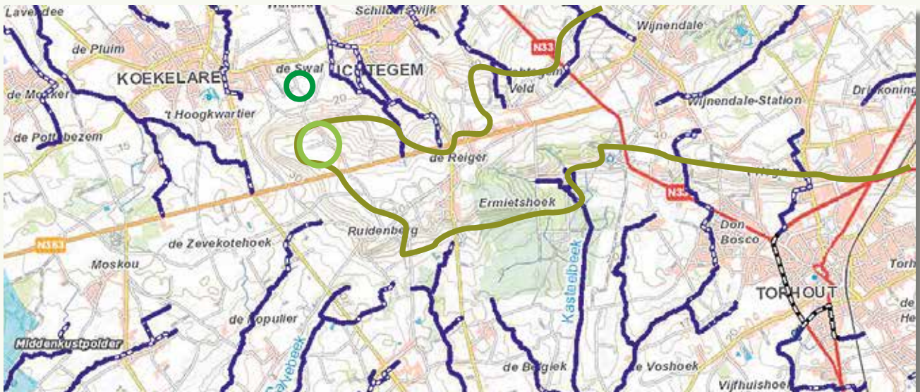
Het plateau van Wijnendale met situering van natuurgebied 'De Swal' (donkergroene cirkel), de Koekelareberg (lichtgroene cirkel), de steilrand (kaki lijn) en alle beken die ontspringen in de omgeving van het plateau (blauw). Kaart: www.giswest.be

berg afloopt, maar ook omdat het water dat hogerop de grond insijpelt, op ondoordringbare kleilagen botst.