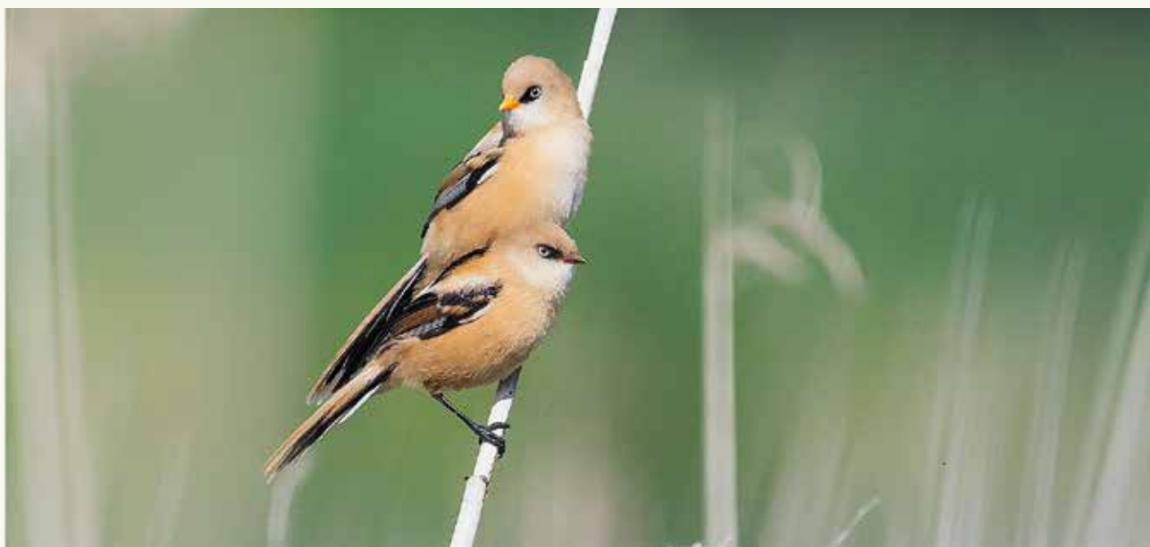
Het was absoluut niet eenvoudig om de jonge baardmannetjes in beeld te krijgen. Uiteindelijk lukte het toch en had ik het geluk dat er 2 samen op 1 rietstengel gingen zitten. :-)