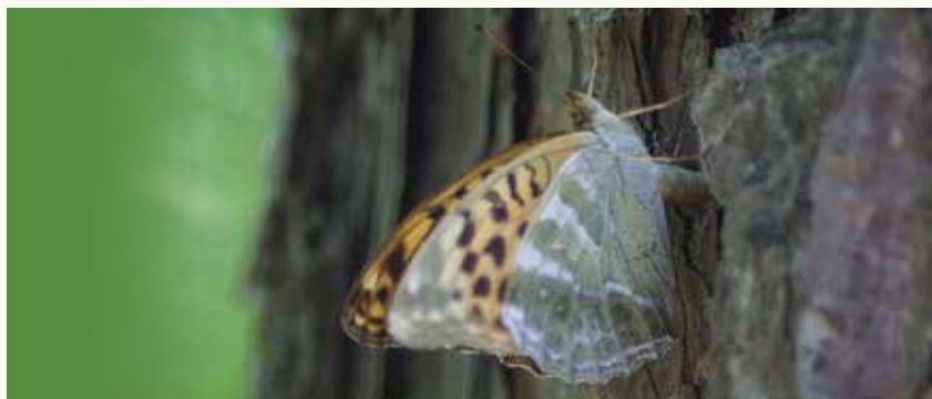
Een keizersmantel ( Argynnis paphia ) in het Koekelarebos legt eitjes in de spleten in de schors van een Koekelareden ( Pinus nigra ssp. laricio cv. 'Koekelare').

Van eind juni tot begin september mogen we dan weer een generatie van deze prachtige vlinders verwachten. Zo zie je maar dat volgehouden beheer tot hele mooie resultaten kan leiden!