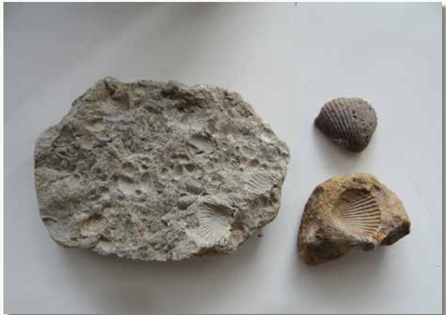
Enkele veldstenen met fossielen van boven op de Koekelareberg. Rechts een mooie afdruk van een Zwinkokkel.

in het zuiden omhoog. De zandbanken kwamen bloot te liggen en wind en regen spoelden de zachte zandlagen weg, behalve op plaatsen waar deze beschermd worden door een laag ijzerzandsteen. Zo ontstond het heuvelende landschap met de West-Vlaamse bergen, net als het Hageland in Vlaams-Brabant en de Vlaamse Ardennen in Oost-Vlaanderen. Deze 'bergen' zijn dus niet zozeer ontstaan door opstuwing, maar eerder het resultaat van 'stand houden'. Vandaar: getuigenheuvels.