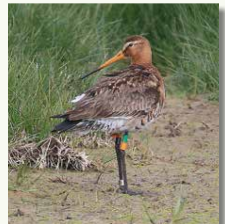
Deze grutto ( Limosa limosa ) heeft een respectabel aantal kilometers op de teller: al 12 jaar pendelt hij tussen Zuid-Portugal en Midden-Nederland.

In daaropvolgende terugmeldingen zie je dat hij er een kosmopolitisch leven op na houdt: na het ringen trok hij van Frankrijk naar de polders in het midden van Nederland (Ouderkerk aan de Amstel en Durgerdam, allebei in de omgeving van Amsterdam), om dan weer terug te ke-