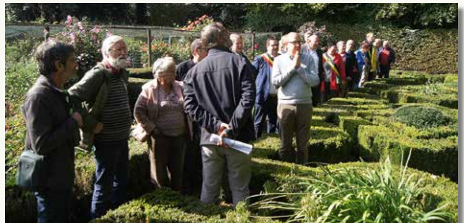
Er was erg veel interesse voor de wandelingen door het kasteelpark, waarvoor je vooraf moest inschrijven.

een dertigtal deelnemers. De goede organisatie van de heemkundige kring zorgde voor een vlotte opeenvolging van de vele wandelingen en wij konden onze vereniging voorstellen aan de ruim zeshonderd bezoekers. Dat leverde zeven nieuwe Natuurpuntleden op!