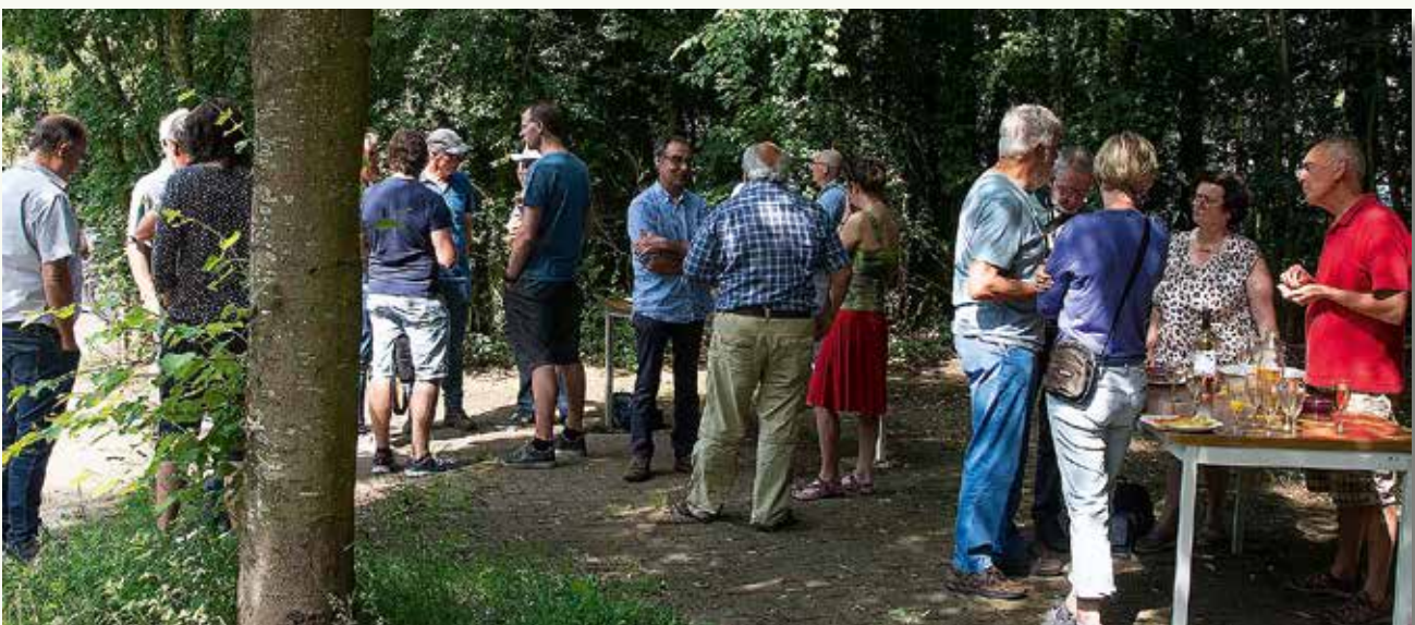
Op 23 juni, onder een stralend zonnetje, sloten we de cursus af met een drankje en een knabbel. Ondertussen gingen de cursisten de uitdaging aan om op vrijdag 8 november vanaf 19 u. een evenement te organiseren op de 'Hoge Dijken' rond het thema 'Nacht'. Mis dit niet!