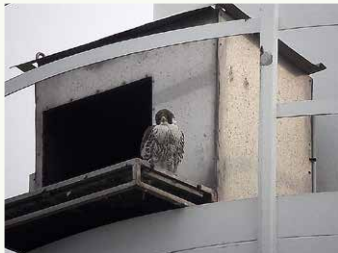
Links een slechtvalk op een hoogspanningsmast langs de ring van Roeselare, rechts een bij de nestkast op de schoorsteen van de verbrandingsoven van Mirom.