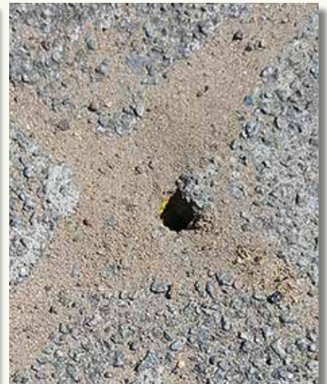
De pluimvoetbij ( Dasygaster hirtipes ) heeft een voorkeur voor zandige gebieden, zoals duinen en heidegebieden, maar nestelt in een stedelijke omgeving ook tussen de straattegels.

Dat de nestjes net bij het begin van de grote vakantie de aandacht trokken, hoeft niet te verbazen. De pluimvoetbij is immers actief van begin juni tot augustus (grotendeel tijdens de schoolvakantie dus). In deze periode graven