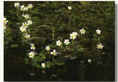
De herstelde walgracht en de grote waterranonkel ( Ranunculus peltatus ).