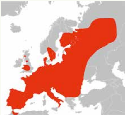
De bunzing komt voor in grote delen van Europa, maar mijdt berggebieden.

bruiken ze vaak zelfgegraven holen als slaappleats.