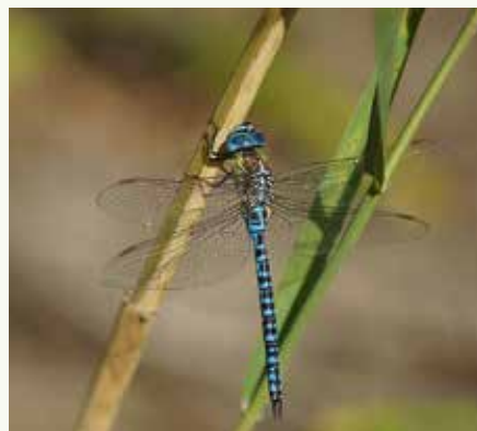
Links de paardenbijter ( Aeshna mixta ), rechts zijn neefje de zuidelijke glazenmaker ( Aeshna affinis ).

Let op de kleinere en minder fel blauwe achterlijfsvlekken bij de paardenbijter. Bovendien hebben paardenbijters kleine gele streepjes op de achterlijfssegmenten.