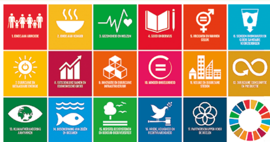
De 17 duurzame ontwikkelingsdoelstellingen van de Verenigde Naties.

Natuurpunt Gistel-Oudenburg & Hoge Dijken was een van de genomineerden.