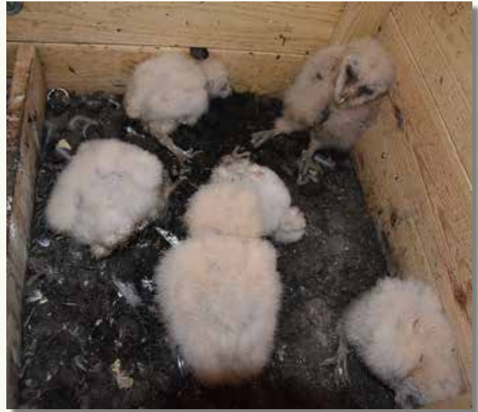
Links een jonge kerkuil, met herkenbaar verenkleed, bij het ringen. Rechts een kerkuilenbak met 6 jongere pulli. Wel een zootje: het nest van een kerkuil is niet het schoonste dat je kan aantreffen... :-).

gewoon grote afstand voor een steenuil. Meestal zoeken jonge steenuilen een eigen stek op enkele honderden meters, hoogstens enkele kilometers, van de nestkast waarin ze geboren zijn. Het moet een ferme noordoostenwind geweest zijn die dit Zeeuwse meisje tot in Hoogede geblazen heeft.