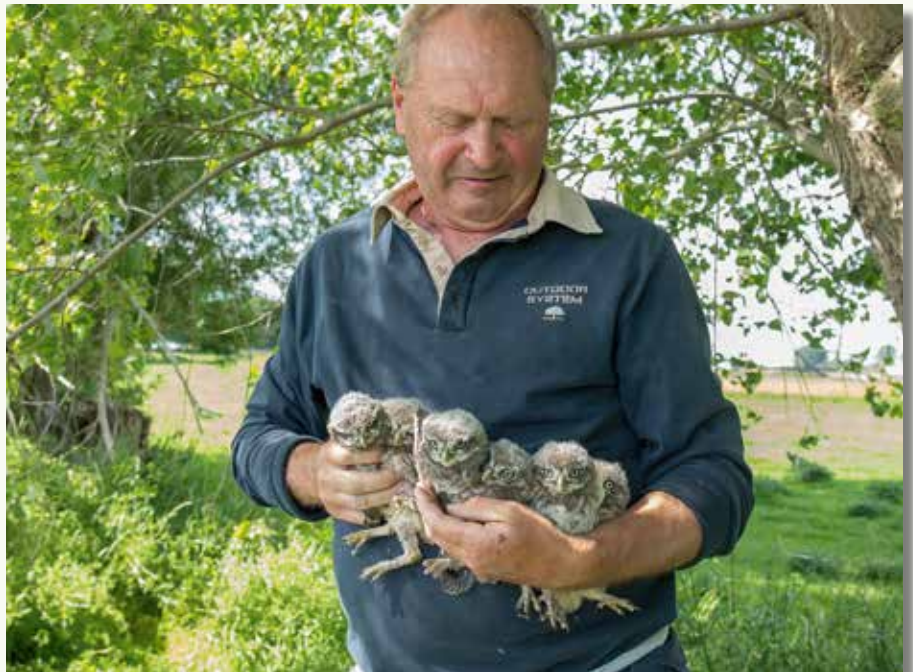
Voor het eerst in de 23 jaar dat onze steenuilenwerking bestaat, troffen we ook een zesling aan.