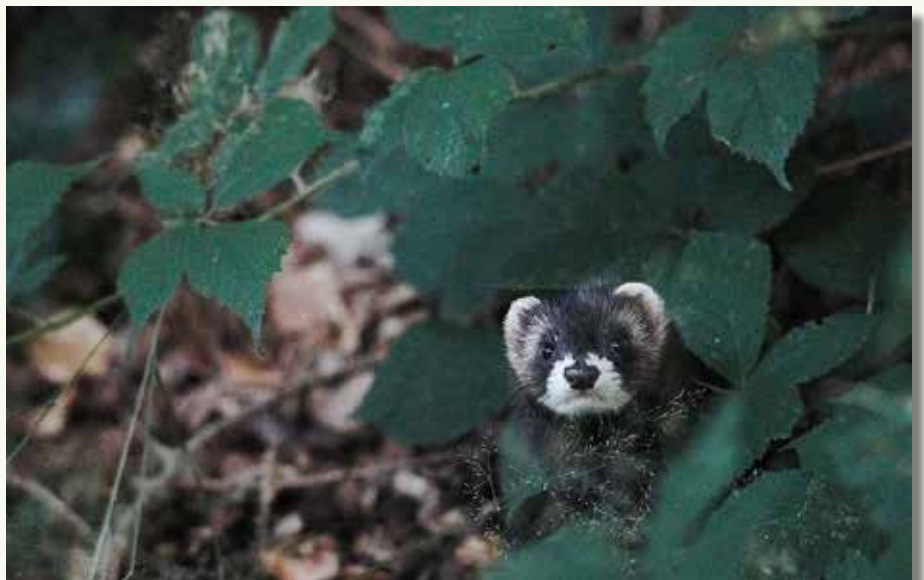
De jonge bunzing bij opname (foto boven) en een kleine week na vrijlating, toen hij voor het laatst kwam poseren voor de trailcam (foto onder).

die in het grote hok werd vrijgelaten, hield het geen 2 seconden uit. Jammer voor de muis, maar de bunzing slaagde met grote onderscheiding.