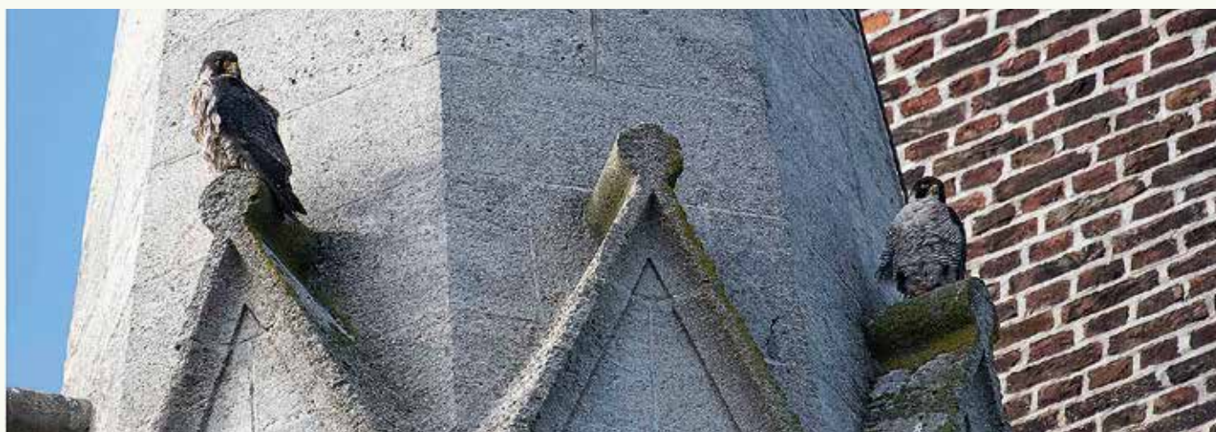
De Oudenburgse slechtvalken ( Falco peregrinus ) op hun vaste stek op de toren van de Onze-Lieve-Vrouwerk.

Het vrouwtje inspecteerde ook regelmatig een van de platforms boven de wijzerplaat van het torenuurwerk, waarschijnlijk om een nestplaats te zoeken. En moesten ze er tot broeden komen, dan zouden we dat uiteraard prachtig vinden.