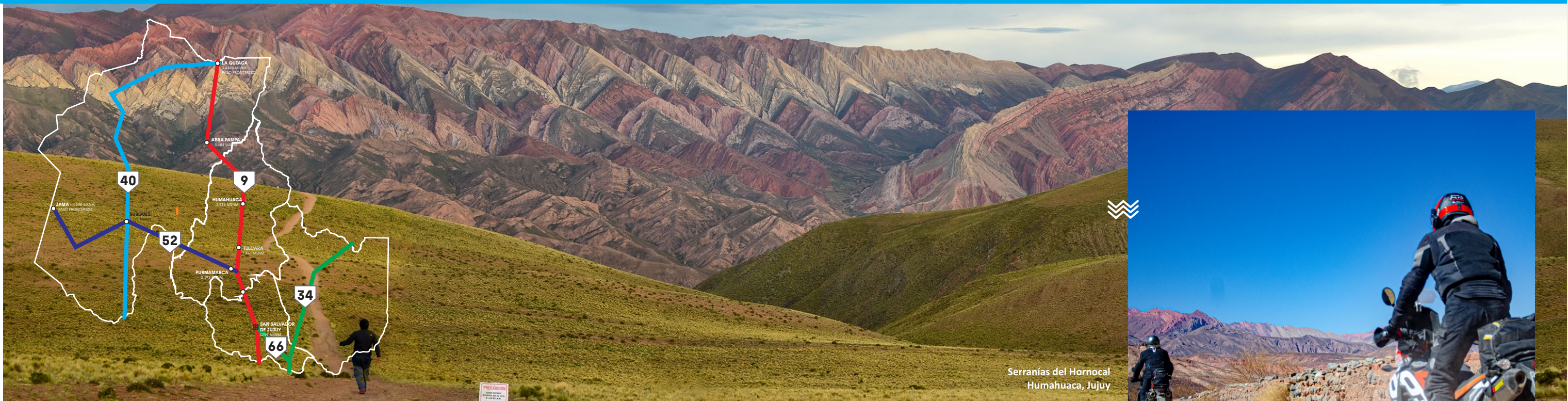
Serranías del Hornocal Humahuaca, Jujuy

Atrações: Dique Las Maderas, Dique La Ciénaga, mercado artesanal, restaurantes nos diques e o maior Balneário de Jujuy.