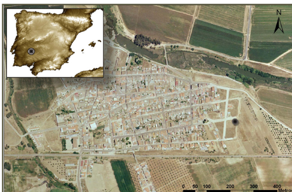
Fig. 1 - Localización del yacimiento

Desde hace unos años se viene interviniendo de urgencia en el yacimiento de El Santo, emplazado en un sector del extrarradio de la localidad de Valdetorres, al norte de la provincia de Badajoz (España). El emplazamiento responde a una suave loma aplanada, ocupada en su mayor parte por las construcciones del casco urbano de la localidad, por cuyos pies discurre el cauce del río Guadámex, afluente del Guadiana, justo antes de desembocar el primero en el segundo (Fig. 1). En cuanto a su secuencia arqueológica, trata de un interesante ejemplo de superposición de fases de ocupación