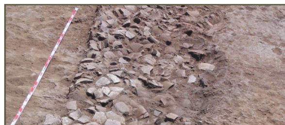
Fig. 2 - Suelo de Tierra endurecida y cama cerámica con fragmentos de ánfora

Bajo el pavimento más reciente, del que tan sólo nos ha quedado parte de un suelo compuesto por ladrillos romboidales, hallamos trazas inequívocas de una nueva construcción o habitación de planta de tendencia rectangular. Los muros se encuentran prácticamente perdidos, robados de antiguo, con pequeños tramos conservados que delimitan el espacio. El suelo de la estancia describe en negativo el trazado de los muros rectos que la cerraban. Fue una superficie de tierra apisonada y endurecida probablemente con fuego, de lo que quedan marcas evidentes, y que se extendió sobre una cama cerámica de aproximadamente 20 centímetros de espesor en una superficie conservada de 2 m 2 (Fig. 2). Este