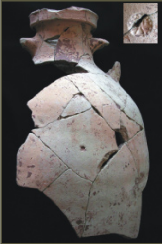
Fig. 4 - Ejemplar de Tripolitana Antigua sellada

radica, en que por su aspecto externo cromático ( Munsell "olive yellow" 2.5 Y 8/3 ) con unas tenues manchas rojizas al exterior y por composición de pasta, se asemeja a las producciones de la Bahía Gaditana, hecho que no coincide con las investigaciones que hasta hora se han llevado a cabo en la zona, donde no se ha constatado la producción de los citados envases. A esto le debemos unir un sello acartelado circularmente