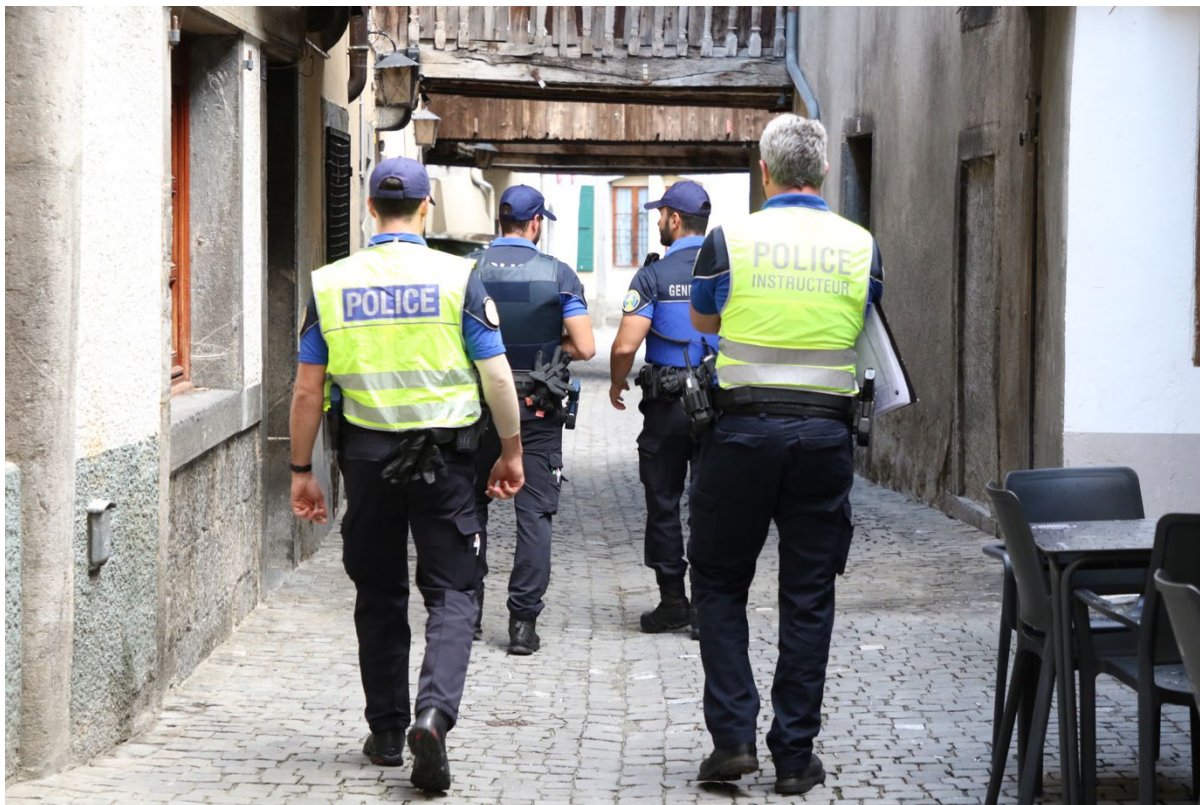
Le module « Patrouille 1 » ou l'échelle 1/1 d'une intervention dans la réalité.