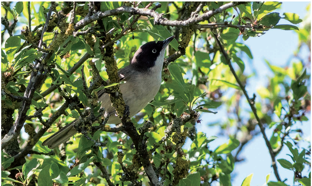
PHOTO 8 | Fauvette orphée / Western Orphean Warbler Sylvia hortensis (Hour, 06.05.2018,)