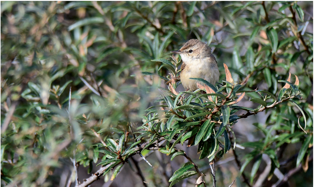
PHOTO 7 | Rousserolle Isabelle / Paddyfield Warbler Acrocephalus agricola (Zeebrugge, 20.10.2018,)

L'année 2018 constitue ainsi une année exceptionnelle avec pas moins de sept données. Les mois d'octobre et de novembre sont classiquement les meilleurs mois pour rencontrer cette espèce en Belgique, avec respectivement 31 et 19 données.