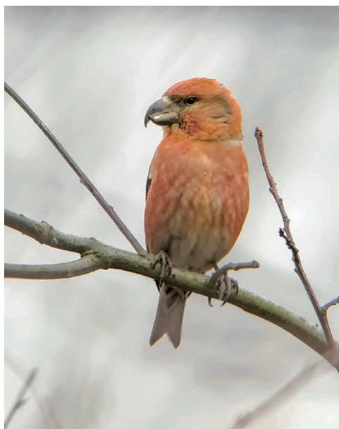
PHOTO 11 | Bec-croisé perroquet, mâle / Parrot Crossbill Loxia pytyopsittacus, male (Kalmthout, 02.04.2018,)