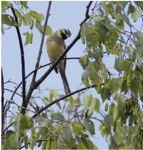
PHOTO 13 | Bruant zizi / Cirl Bunting Emberiza cirulus (Rienne, 31.05.2018,)