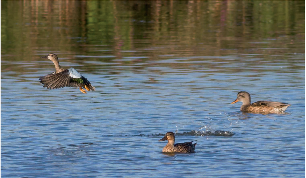
PHOTO 1 | Sarcelle à ailes bleues, mâle, avec (de gauche à droite) Canard souchet et Canard chipeau / Blue-winged Teal Spatula discors, male, with (from left to right) Northern Shoveler Spatula clypeata and Gadwall Mareca strepera (Kallo, 06.08.2018,)