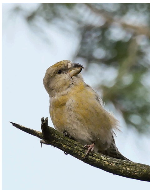
PHOTO 12 | Bec-croisé perroquet, femelle / Parrot Crossbill Loxia pytyopsittacus, female (Kalmthout, 27.01.2018,)