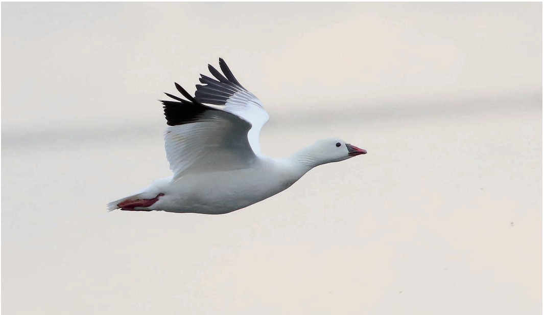
PHOTO 15 | Oie de Ross / Ross's Goose Anser rossii (Houbenhof, 03.05.2017,)