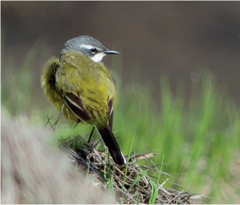
PHOTO 10 | Bergeronnette printanière ibérique / Western Yellow Wagtail Motacilla flava iberiae (Fagne des Deux-Séries, 26.05.2016,)