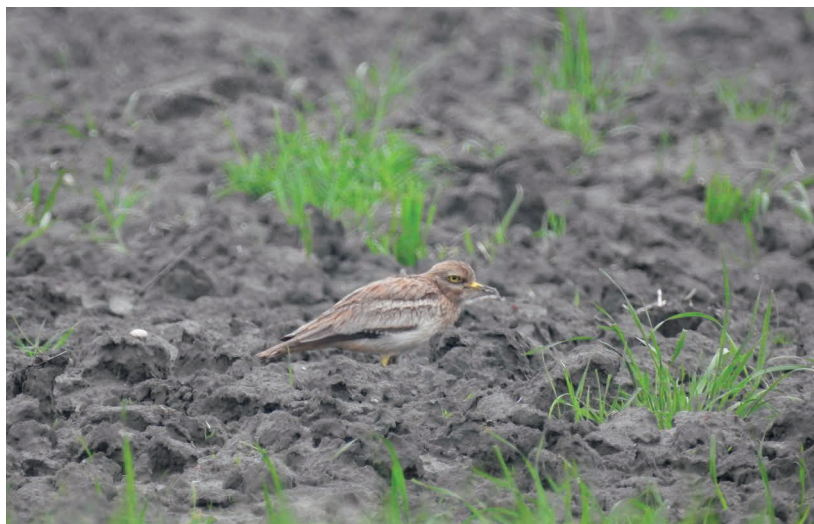
PHOTO 3 | Oed- dicnème criard / Eu- rasian Stone-curlew Burhinus oedicnemus (Bredene, 15.04.2018)