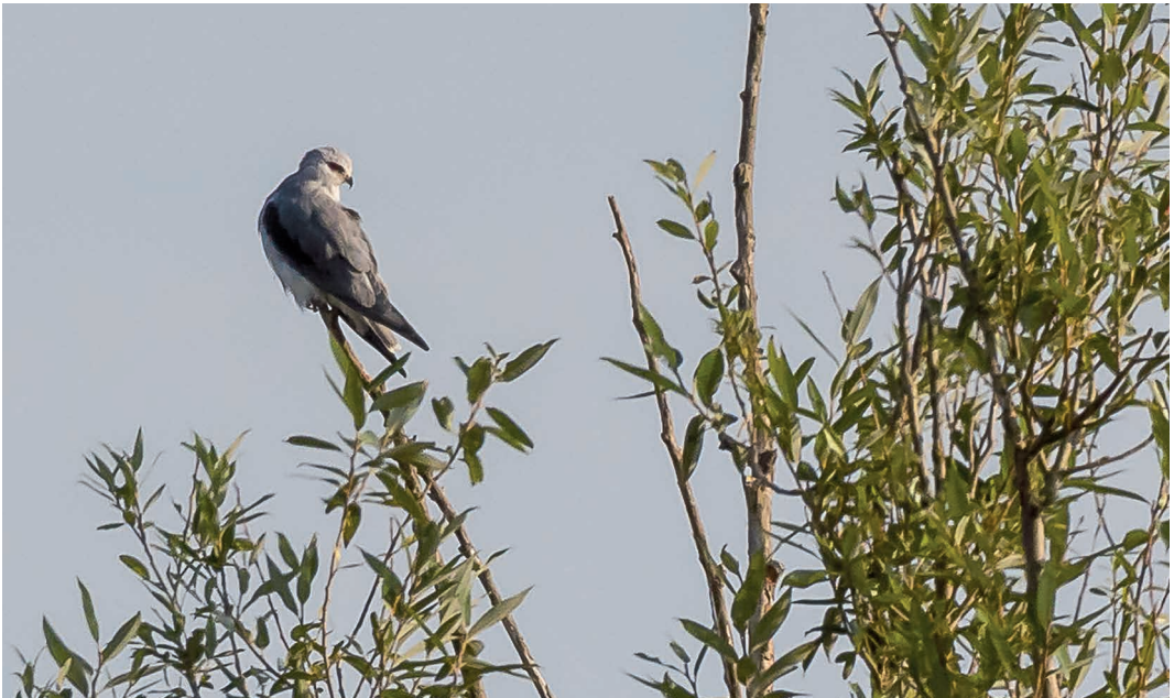
PHOTO 2 | Élanion blanc / Black-winged Kite Elanus caeruleus (Montenaken, 02.08.2018)