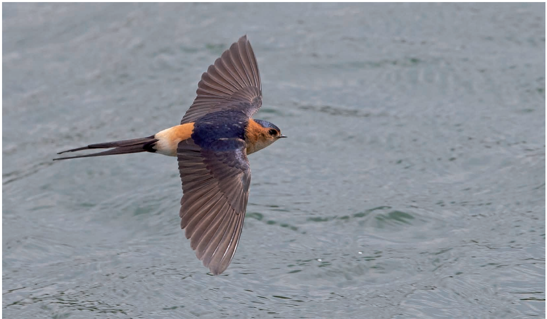
PHOTO 6 | Hirondelle rousseline / Red-rumped Swallow Cecropis daurica (Hermalle, 01.05.2018,)