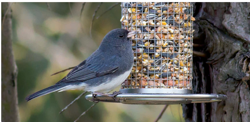
PHOTO 14 | Junco ardoisé / Dark-eyed Junco Junco hyemalis (Doornzele, 19.03.2018,)

Cette observation constitue la première donnée pour la Belgique. L'oiseau fréquentait une mangeoire avec les mésanges et les fringilles locaux.