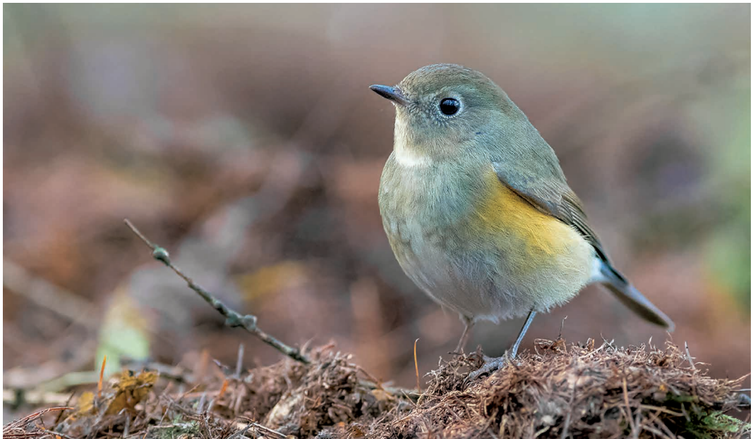
PHOTO 9 | Robin à flanc roux / Red-flanked Bluetail Tarsiger cyanurus (Montzen, 13.11.2018,)