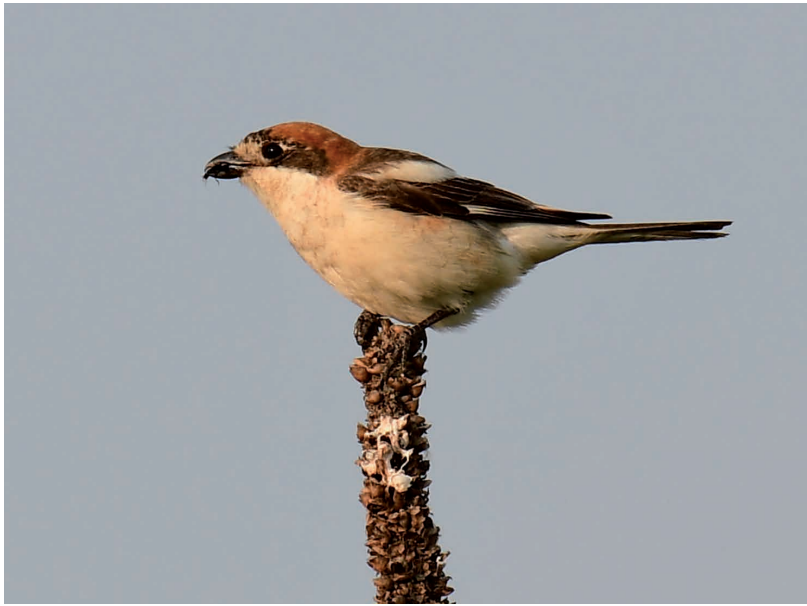
PHOTO 5 | Pie grièche à tête rousse / Woodchat Shrike Lanius senator (De Putten, 15.05.2018,)

Corneille mantelée Corvus cornix ( - , 2011-2017 : 15, 2)