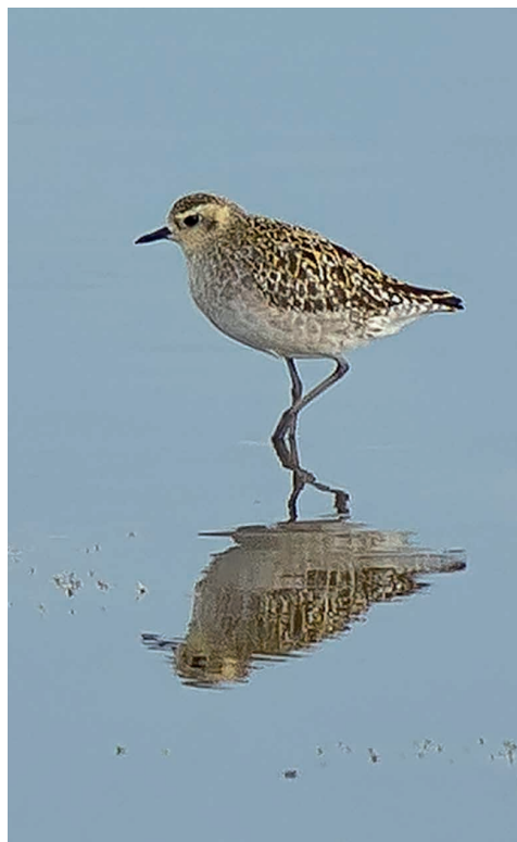
PHOTO 4 | Pluvier fauve / Pacific Golden Plover Pluvialis fulva (Kieldrecht, 06.11.2018,)

Pour mémoire, cette espèce n'est plus à homologuer depuis le 1 er janvier 2015.