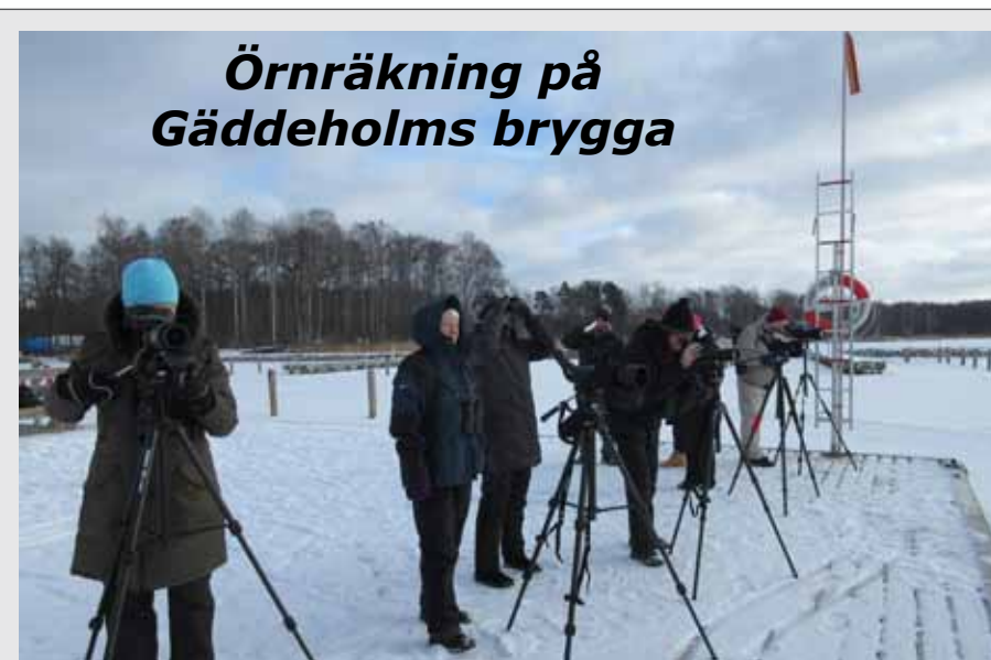
Örnräkning på Gäddeholms brygga

På 15 ställen i Västmanland fanns skådare på plats mellan kl 10 och 12 lördag 3:e mars för att delta i årets örnräkning. På Gäddeholms brygga utanför Västerås hade Rapphönan ansvar för att spana och räkna.