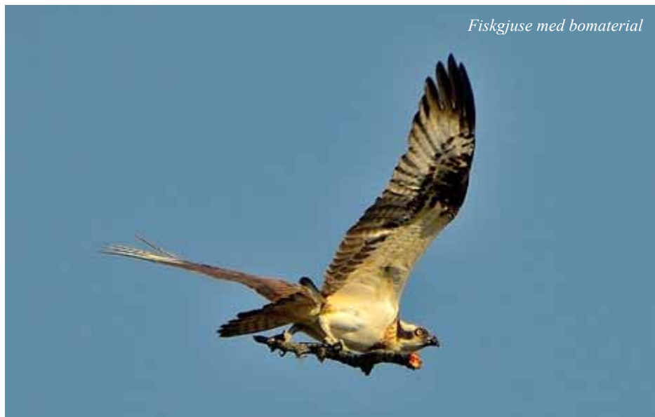
Fiskgjuse med bomaterial