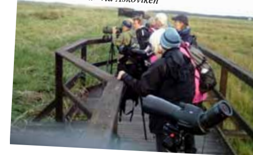
Rapphönan skådar vid Asköviken