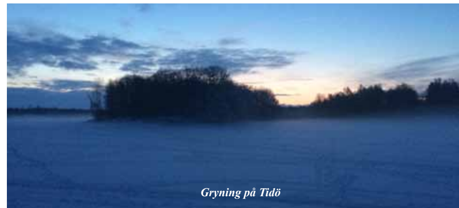
Gryning på Tidö

En fantastisk trevlig dag med ett trevligt lag, där vi hade ett otroligt bra flyt genom hela dagen.