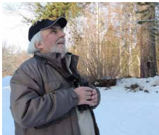
Text & bild: Christina Bredin