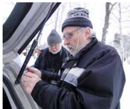
Delar av lag Falcon Guld i Artrallyt 2011

Falsterbo, Ottenby, Getterön är några av de ställen Uffe varit SOF volontär. Det är kul att träffa massor med folk. Och ibland får man råta ut en del frågetecken och skrönor om fåglar.