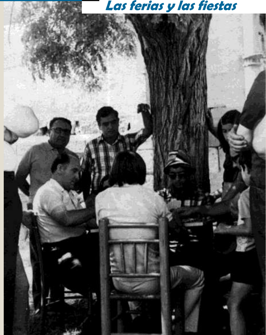
Concurso de Guiñote en la Placeta de la Iglesia. 15 de agosto de 1975.