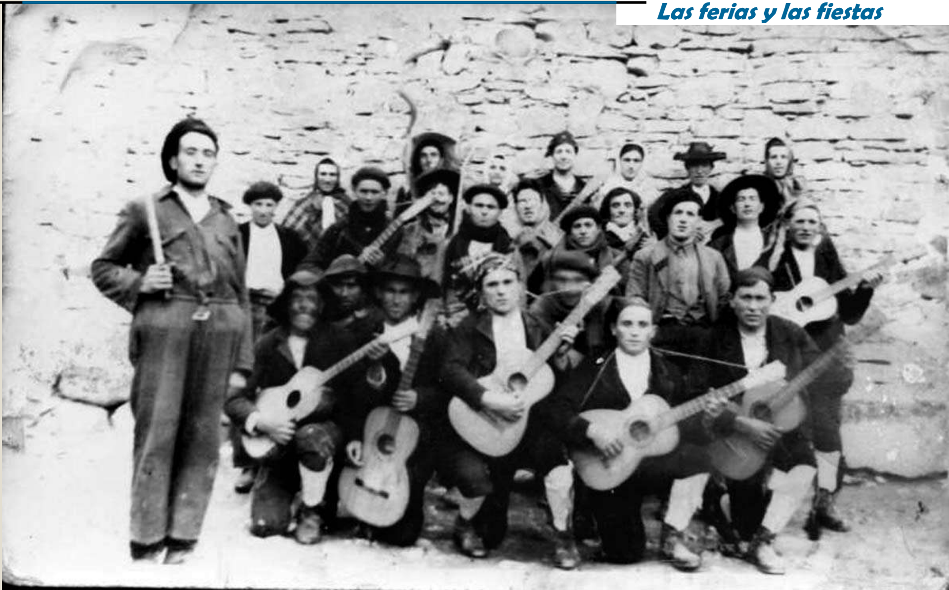
Rondalla en la fiesta de Carnaval. Jorcas, 11 febrero 1936.