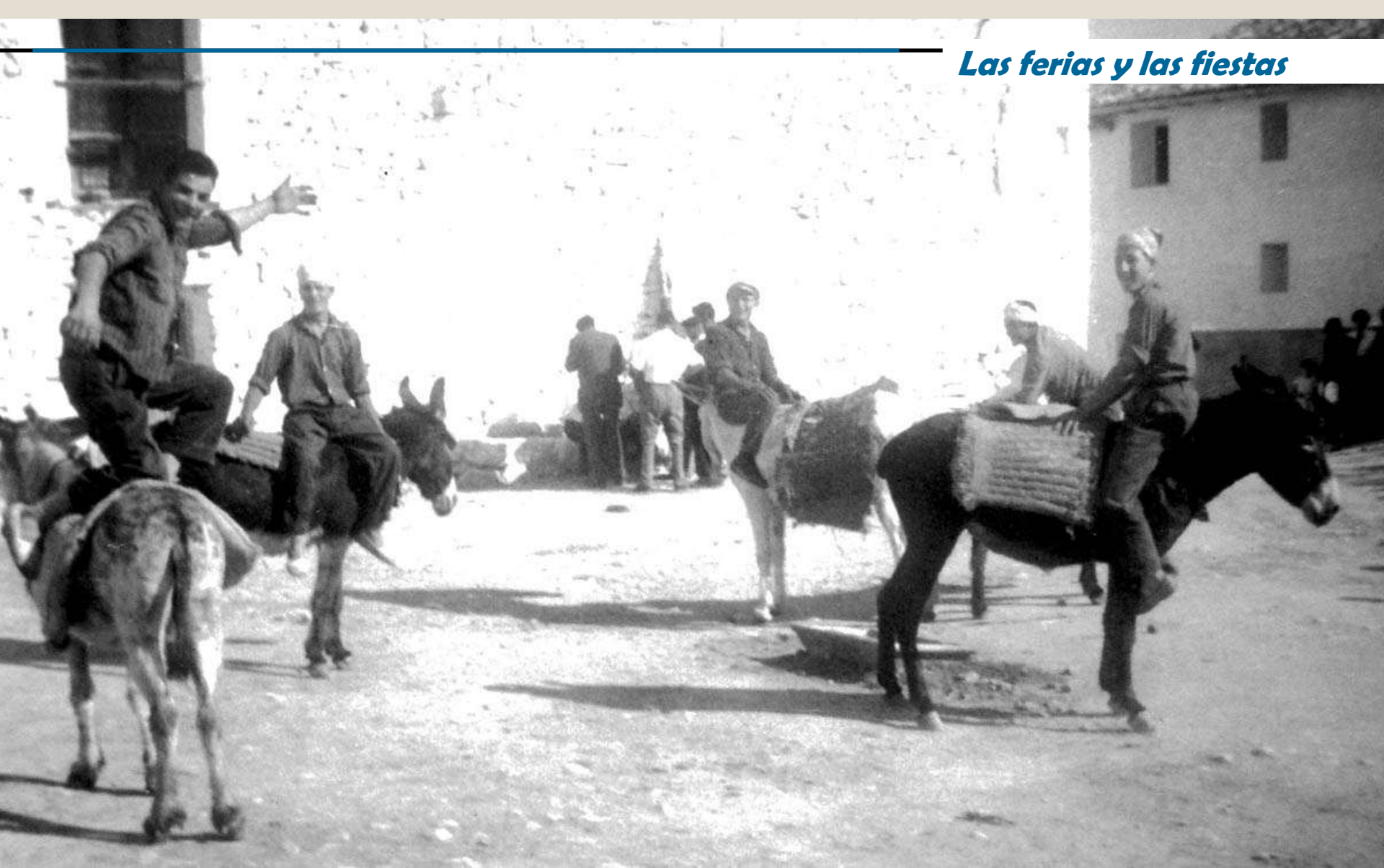
Corridas de burros. Los quintos están en la plaza alrededor de la gamella donde flotaban los tomates. Al fondo el alguacil con la bandera y otros vecinos. 16 de agosto de 1964 ó 1965 por la tarde.