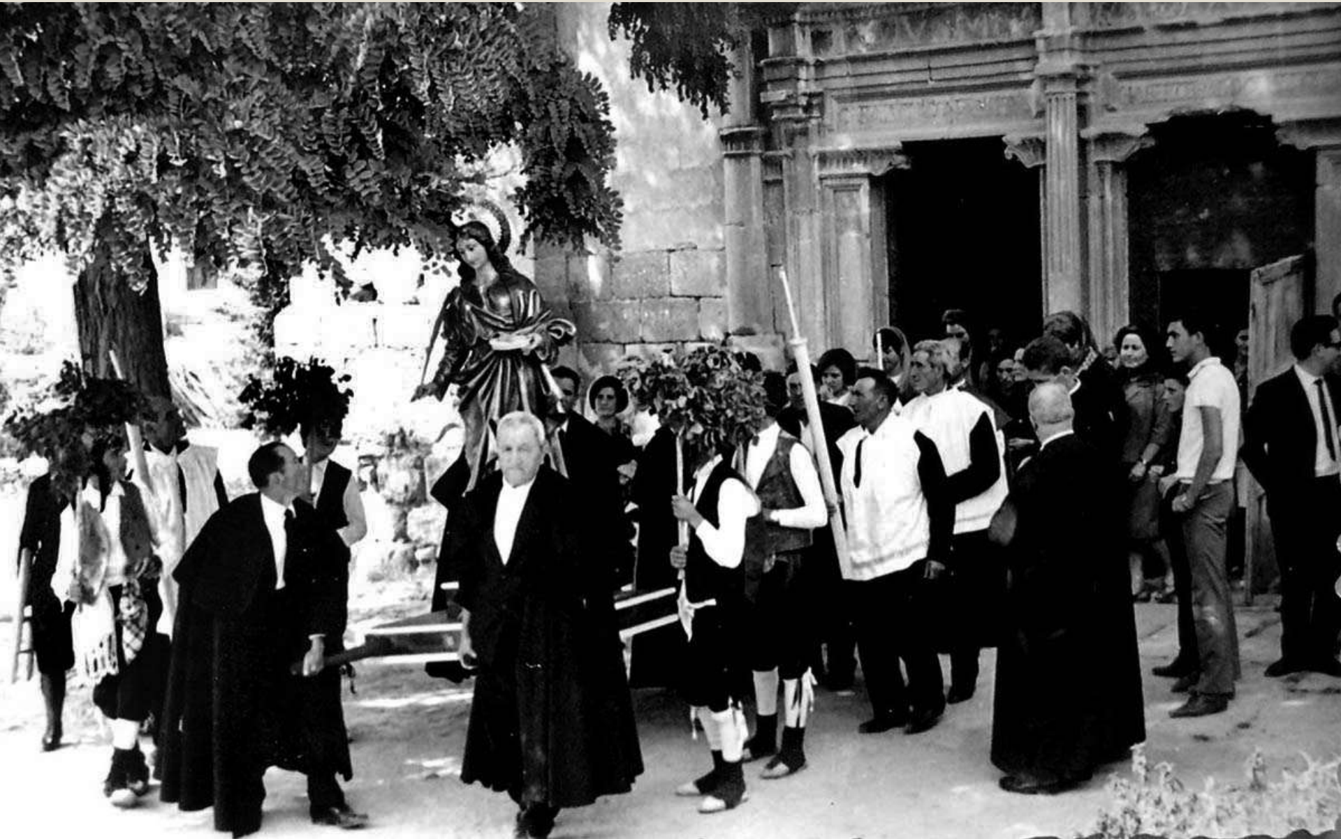
Procesión saliendo de la iglesia. Años 70-80.