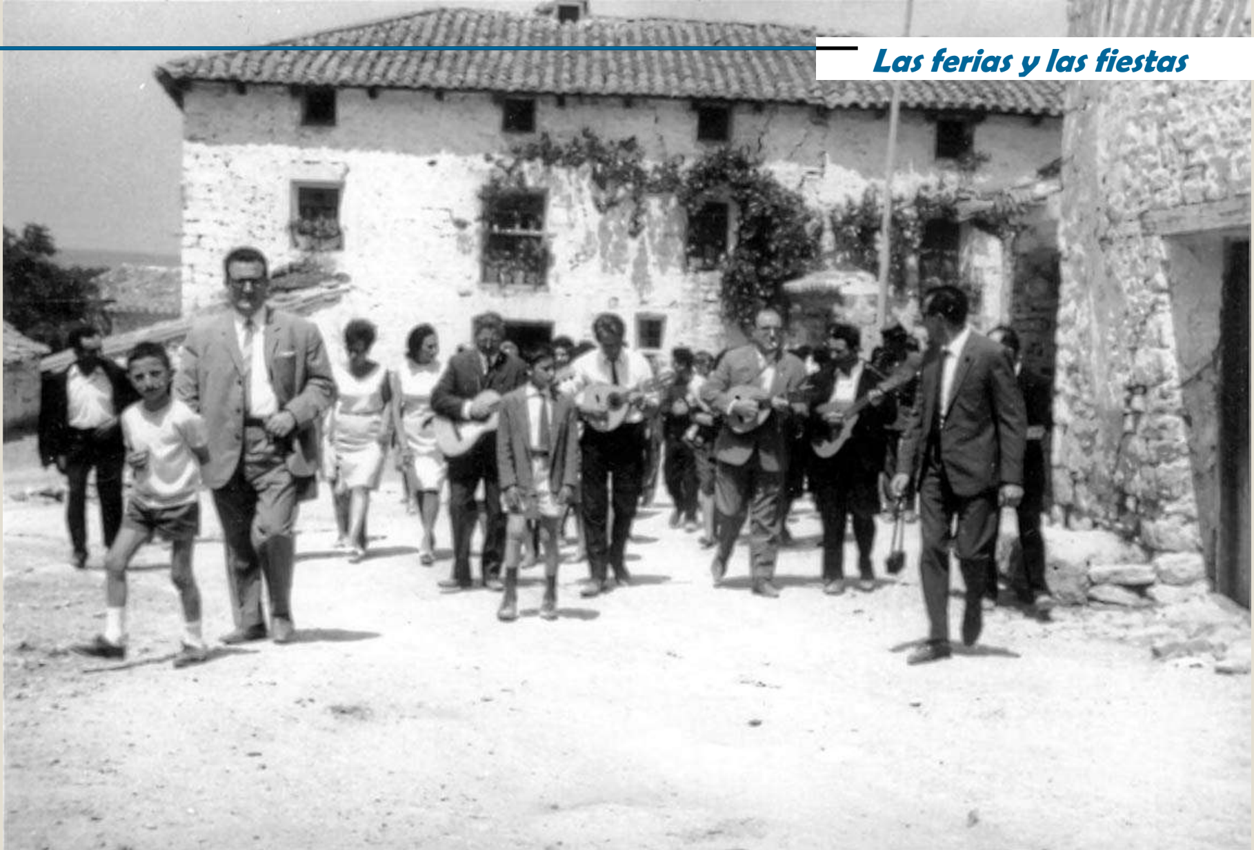
Rondalla camino de la Plaza. Tal vez invitando a las mozas al baile de la mañana del día de la Virgen o de San Roque. Agosto de 1968