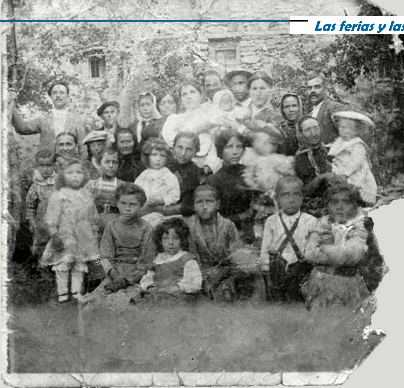
Celebración de un bautizo en Jorcas, 1904-1908.