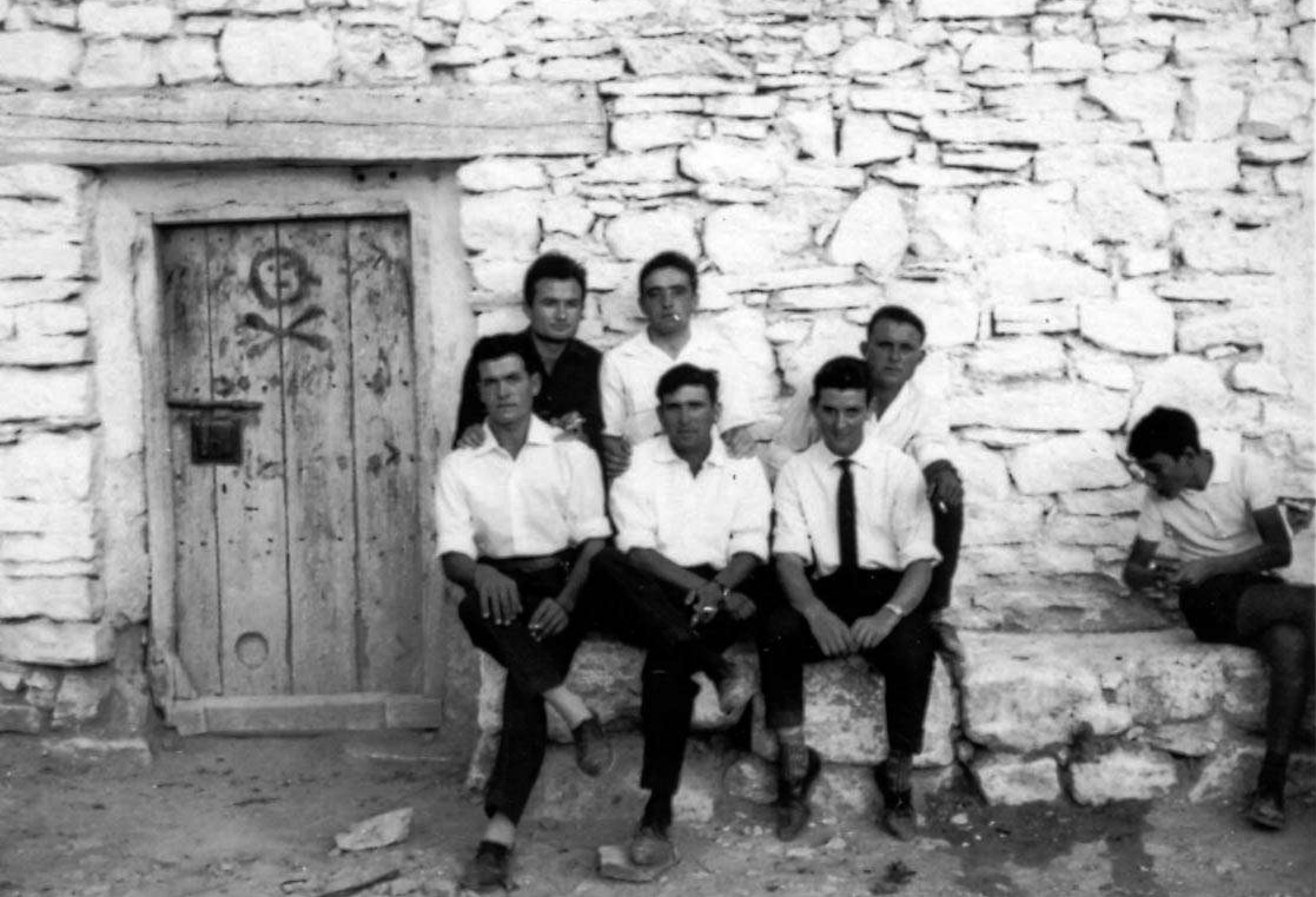
Mozos endomingados, tal vez quintos , en la mañana de un día de fiestas. 1963.