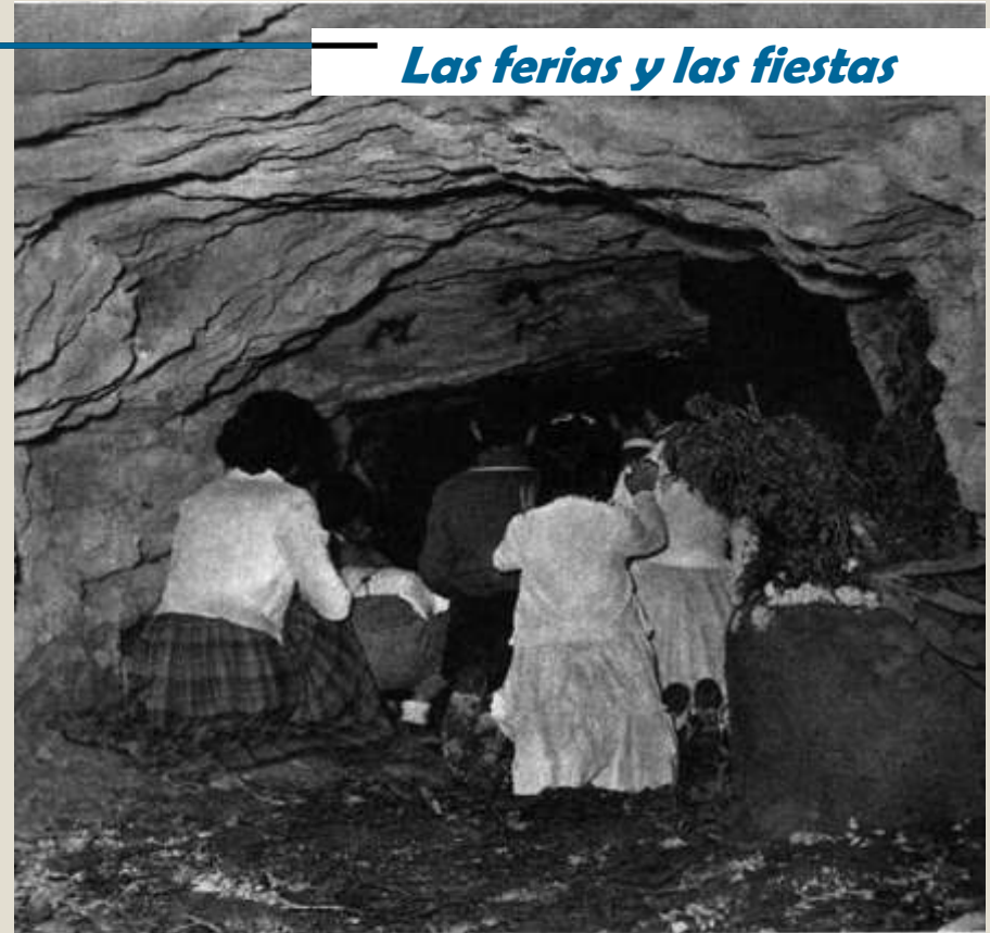
Los niños siguen acudiendo a la cueva.

estaba igual. El viernes, 13, por la tarde, a las seis."