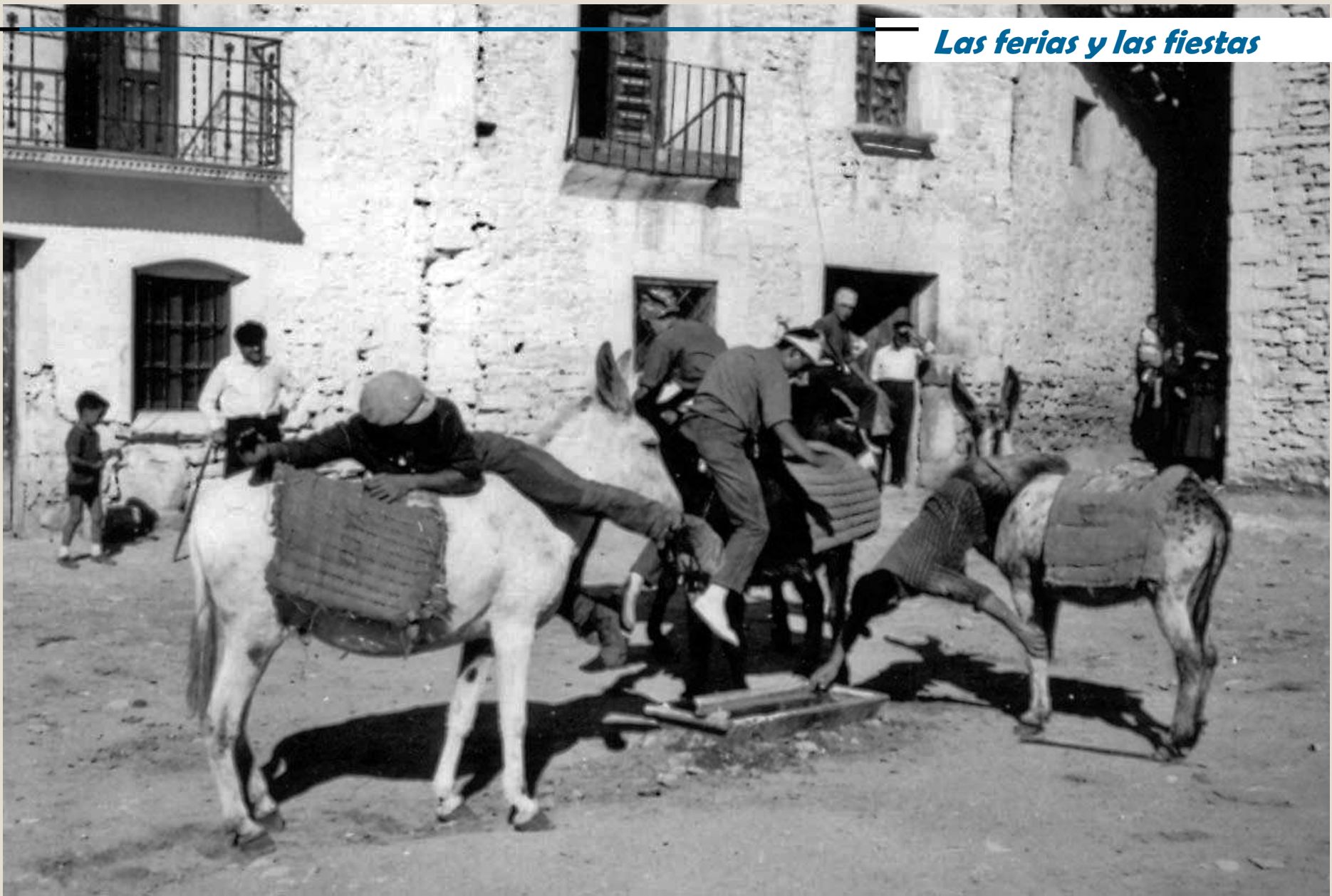
Corridas de burros, 1970 aprox.