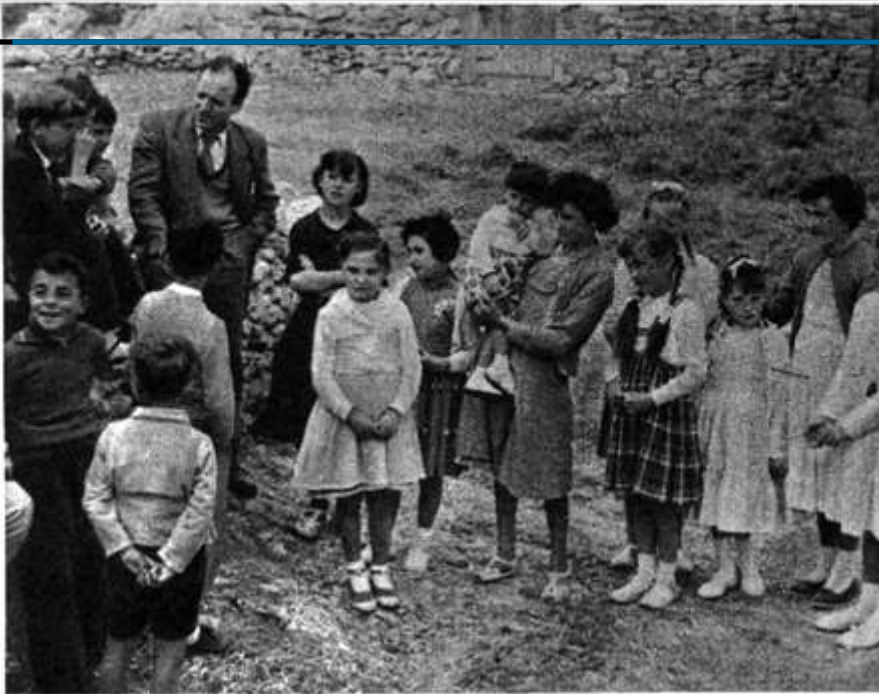
Nuestro enviado habla con los chiquillos que aseguran haber presenciado las apariciones.