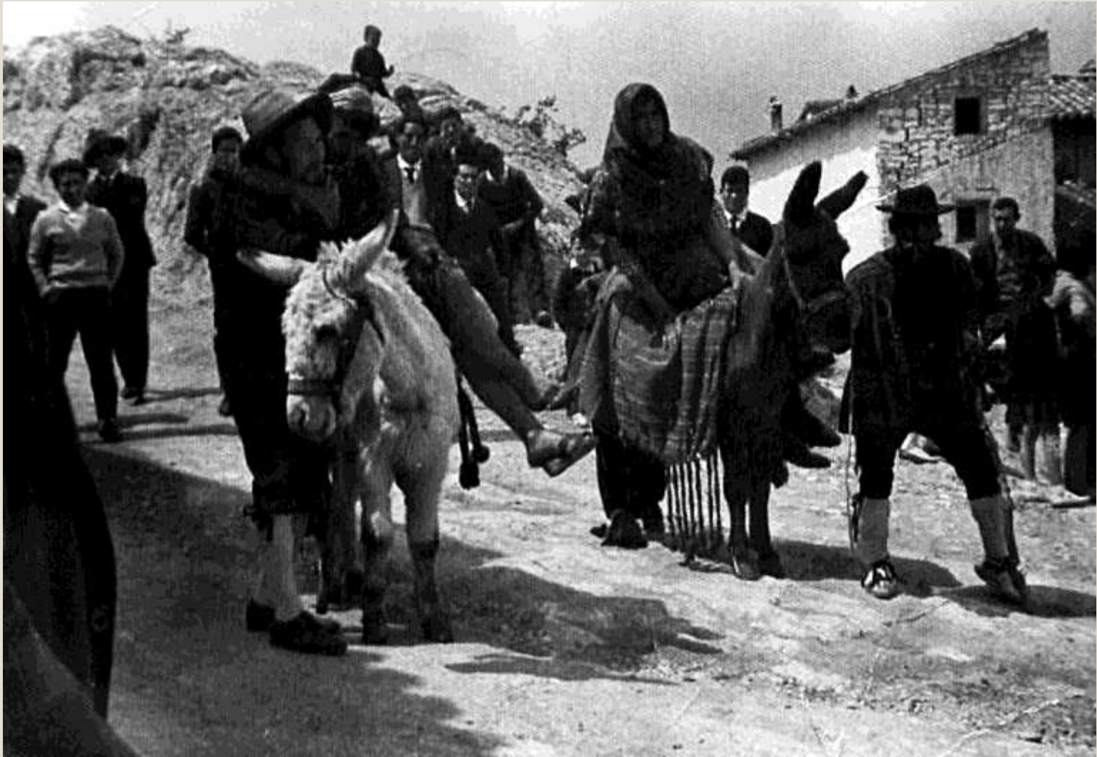
Disfrazados de mujeres sobre los burros, años 80-90.