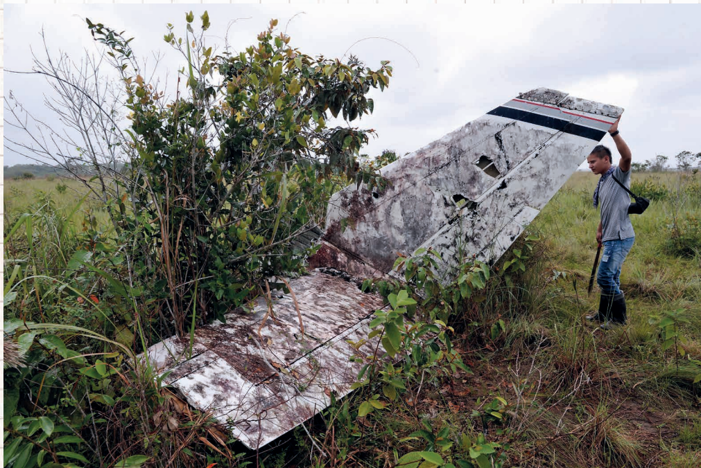
Restos de un avión bimotor HK modelo 70, los cuales están en la pista aérea Felipe, muy cerca de la hacienda El Recreo donde vivió varios años Gonzalo Rodríguez Gacha, alias El Mejicano.