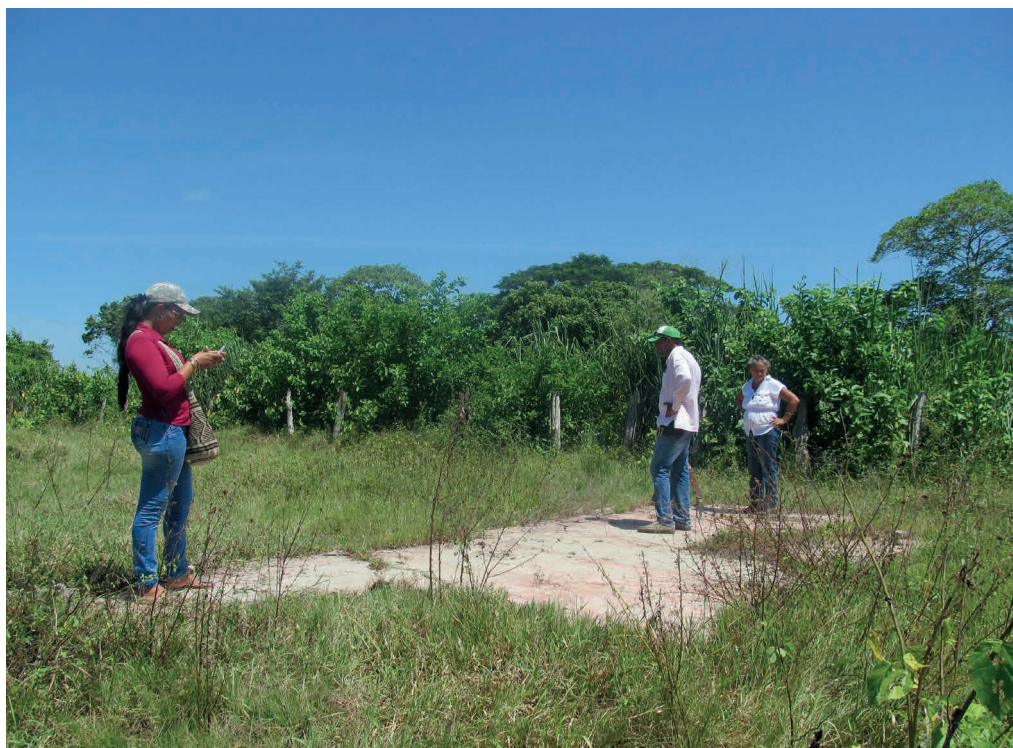
En las fincas que están en los predios que ocupaba Salaminita se pueden observar los cimientos de las viviendas que hacían parte del corregimiento.

Estos versos resumen el anhelo de los antiguos pobladores de Salaminita de volver a su tierra, recuperar sus raíces y acabar con el destierro al que los condenó el conflicto armado. Al escuchar la música varios bailaron como lo hacían en las fiestas patronales de la Virgen del Rosario. Tenían motivos para celebrar. Aunque la reconstrucción del pueblo no será de la noche a la mañana, ellos no pierden la fe de verlo renacer.