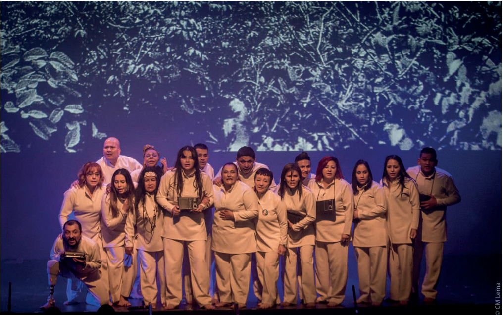
18 colombianos entre exparamilitares, exguerrilleros, militares, policías y víctimas de la guerra se reconciliaron en las tablas.

El año pasado fui elegida como consejera distrital para las comunidades negras en mi localidad en Bogotá. Estoy construyendo mi sueño, pero quiero volver a Quibdó. Quiero ayudar a mi tierra. Transformarla. Para algo ha de servir mi historia. Mire, hija, nosotros presentamos la obra en Caquetá a varios excombatientes. Al final se me acercó un hombre y me zampó tremendo abrazo. Quedé atónita. Él lloraba y me pedía perdón. Supe después que hizo parte del grupo armado que me hizo daño. No pude decirle ni mú. Hoy quisiera que sepa que ya lo perdoné”.