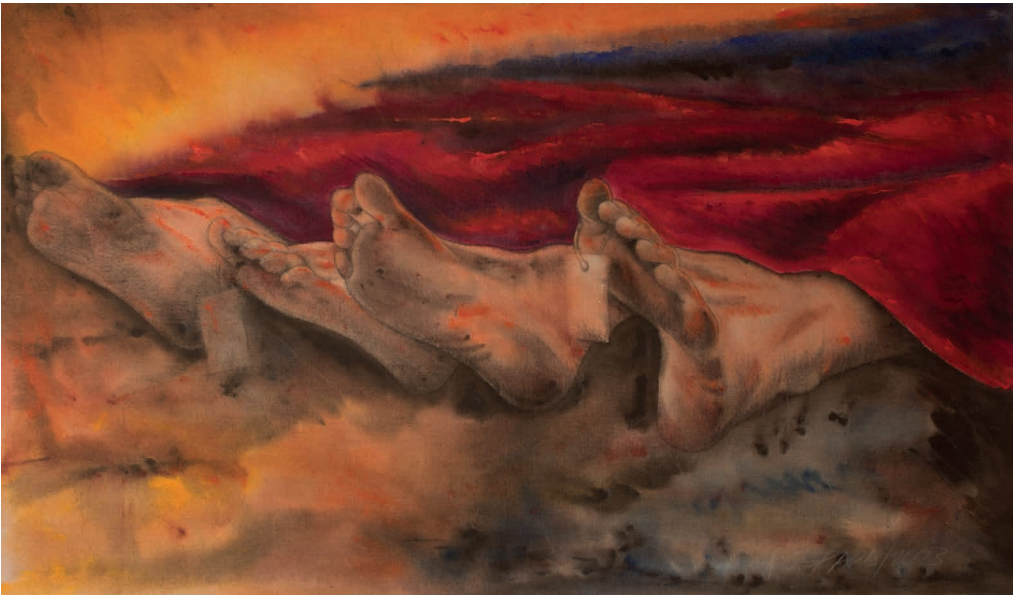
Ilustración realizada por el maestro Alfonso Espada.

una sola vez, sino que hay muchas personas que hacen daño todos los días y no por el hecho de que lo condenen es malo. La vida continúa y hay que seguir sirviendo. En unas formas acierta más que otras. Pero eso ya pasó, no hace parte sino la de la historia, eso nadie lo va a borrar, pero lo que estamos viviendo es ahora y ya. Hasta Luego.