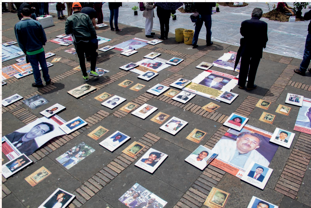
Memorial por las víctimas de crímenes de Estado en Bogotá, organizado por el MOVICE.