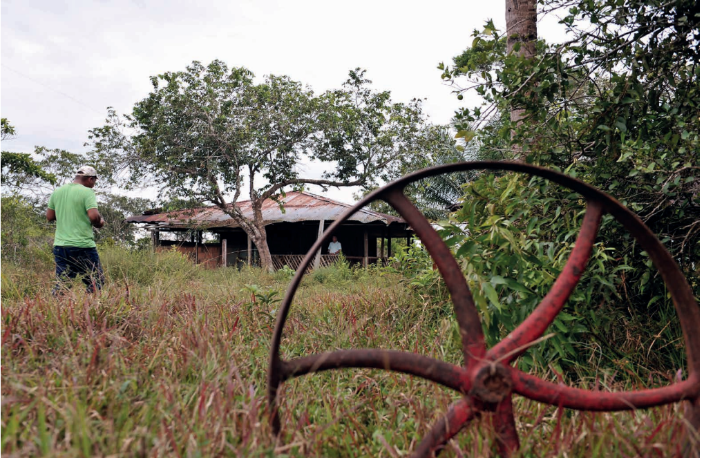
En el patio infinito de la hacienda Tranquilandia aún hay restos de la maquinaria de poder que tuvo el cartel de Medellín en estas sabanas de los Llanos Orientales.