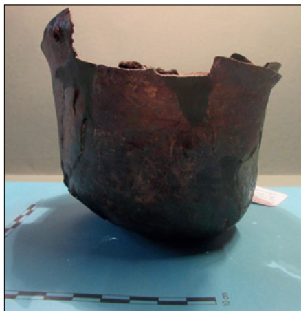
Figura 4.- Fotografía del acetre 12.12.106.A1.11.

12.12.50.9: Aplique de asa que se resume en un fragmento plano recortado en forma hexagonal. En su parte más proximal se curva sobre sí mismo. Longitud: 2'5 cm, Altura: 0'6 cm, Anchura: 1'6 cm y Grosor: 0'1 cm. Estaba junto a los fragmentos de la cazuela 12.12.50.7.