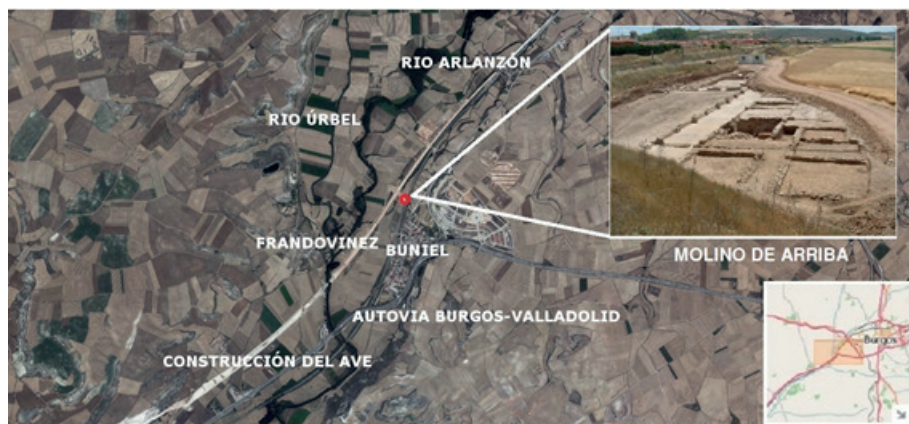
Figura 1.- Localización del yacimiento.

El yacimiento se encuentra situado en el término municipal de Buniel, a escasos 15 kilómetros de la ciudad de Burgos, cuyas coordenadas geográficas son 42° 19' 00''; 3° 49' 18''; mientras que las coordenadas UTM son, X: -4252217,62; Y: -4681544,42. Está incluido en un ámbito geográfico perteneciente a la Unidad Morfo-estructural definida como Páramos Calcáreos (Tejero, 1988:52), cuyos componentes son páramos, cuestras, terrazas y vegas fluviales (Moreno Peña, 1985:55-58). El curso de agua más destacado de la zona aparece determinado por el curso del río Arlanzón correspondiente al tramo medio. En detalle, el yacimiento se localiza dentro de un marco geomorfológico correspondiente a una llanura aluvial del río mencionado, que determina una zona llana surcada por varios