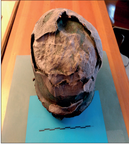
Figura 6.- Fotografía de las sítulas de la UE 106.