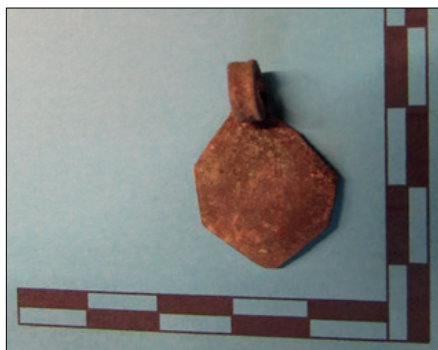
Figura 5.- Fotografía del aplique geométrico.

12.12.106.A2.3: Dos sítulas. Se encuentran sin restaurar y están fabricadas en una aleación de cobre, posiblemente bronce. Medidas de la sítula mejor conservada: Altura: 21 cm, Anchura: 24 cm, Longitud: 26 cm y Grosor: 0'4 cm. Tiene una forma cilíndrica con un borde exvasado, galbo curvo y un fondo en umbo. Perteneciente a la Agrupación 2. Se encuentran expuestas en las vitrinas sin acabar el proceso de restauración.