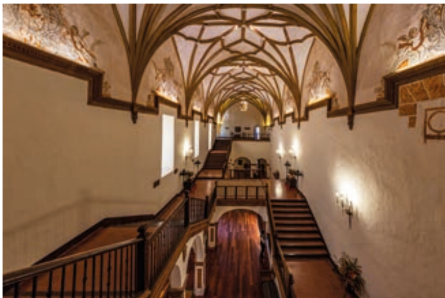
Fig. 8. Escalera del monasterio acomodada en la enfermería renacentista, 1522-1534.