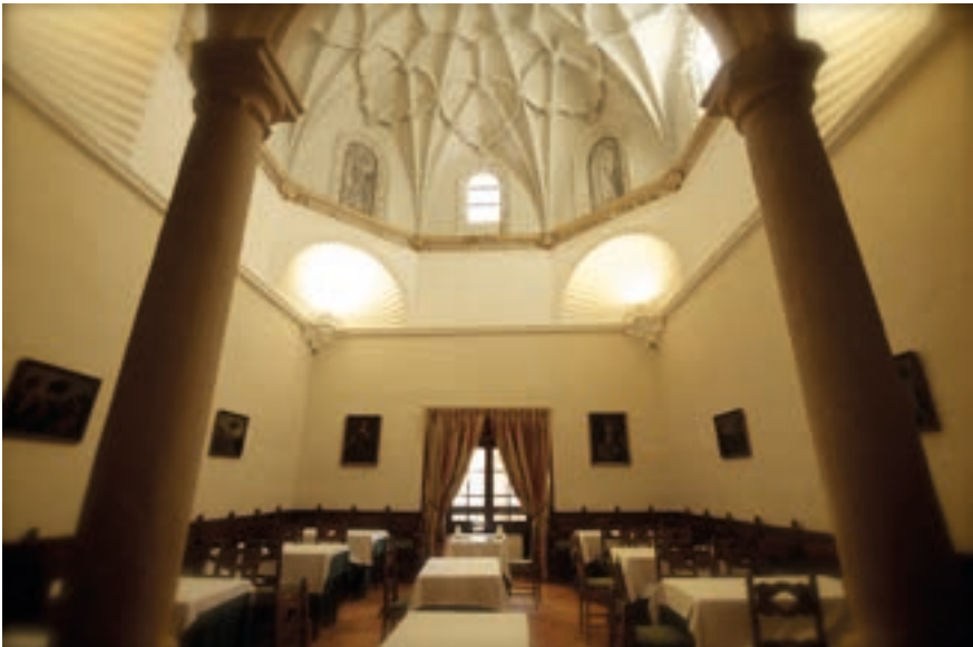
Fig. 12. Antigua escalera del claustro, 1581. Transformada en comedor.