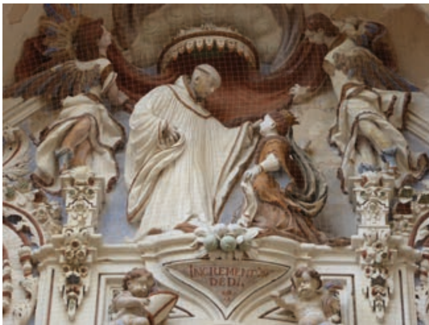
Fig. 19. Detalle de la decoración de la portada. Capilla de San Bernardo.

archangel san Miguel, todas en el cruzero de esta iglesia» (p. 113), recintos decorados con un exuberante exorno barroco realizado en yeso policromado que resultó muy dañado durante la guerra de la Independencia [figs. 17-19].