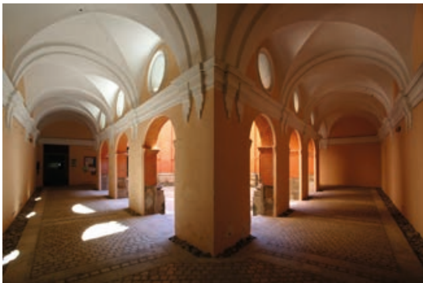
Fig. 21. Convento de Nuestra Señora de la Merced, Tarazona. Claustro. Diseñado por Matías Ibáñez antes de 1717.

Basurte. 64 Este oficial tomó las medidas por todos sus flancos anotando con precisión los palmos obtenidos e indicando todas las confrontaciones. 65 Ocho meses más tarde, Basurte, en compañía de los regidores turiasonenses, repitió la operación para certificar que los religiosos «no puedan tomar nada de la calle principal de dicha ciudad». 66