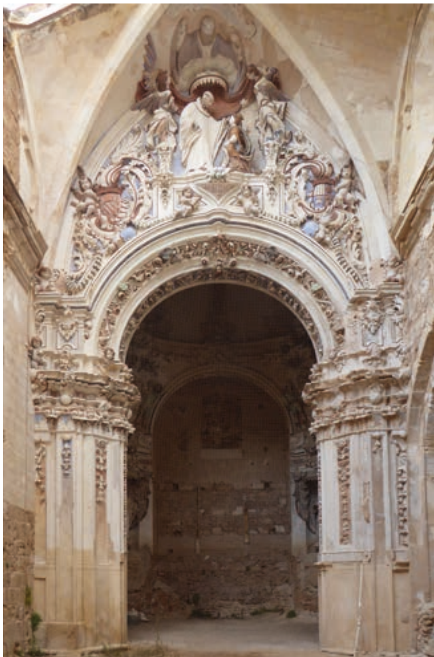
Fig. 18. Capilla de San Bernardo. Matías Ibáñez, h. 1700. Iglesia del monasterio.