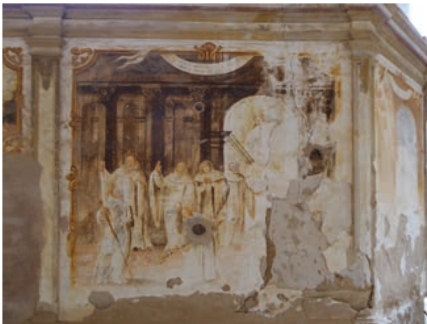
Fig. 28. Vestigio del trascoro. Iglesia del monasterio de Piedra, siglo XVIII.

toda la prodigiosa vida, del Doctor Dulcissimo, y padre san Bernardo abad» (p. 123), del que nos han llegado algunos restos [fig. n.º 28].