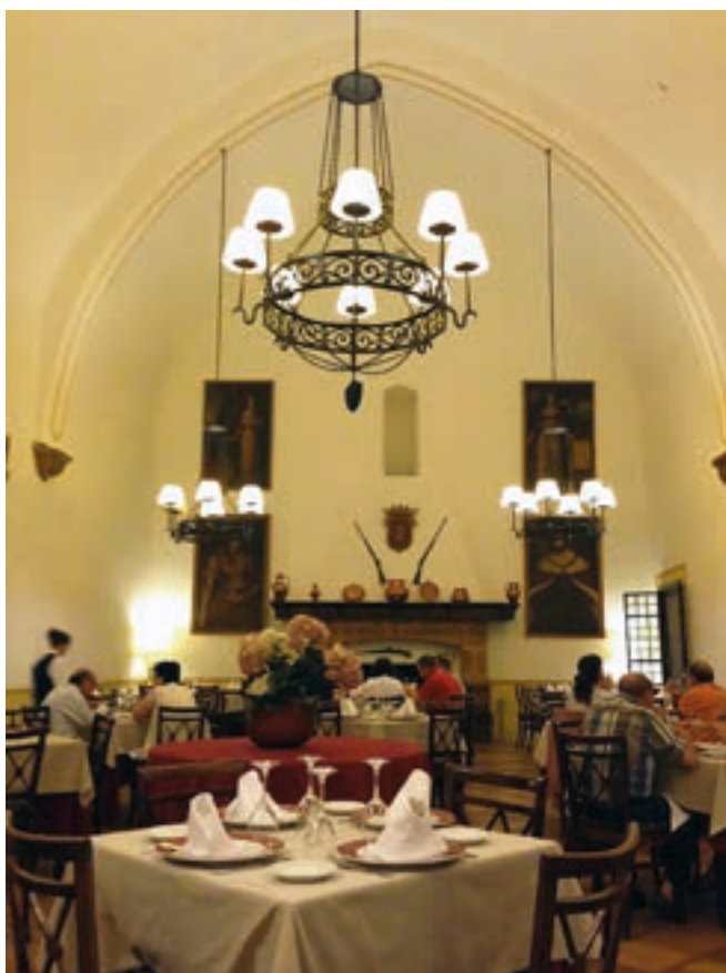
Fig. 9. Antiguo dormitorio de los monjes, siglo XIV.

las dependencias monásticas, se corresponde con la enfermería que Hernando de Aragón, futuro arzobispo de Zaragoza, había ordenado construir entre 1522 y 1535, años en los que residió en Piedra [fig. n.º 8]. Asimismo, por aquellas fechas fray Hernando prosiguió la fábrica del dormitorio de los monjes (p. 95), estancia de origen medieval, iniciada en época del papa Benedicto XIII (1394-1423) y situada sobre la sala capitular, convertida en la actualidad en uno de los restaurantes del complejo hotelero [fig. n.º 9].