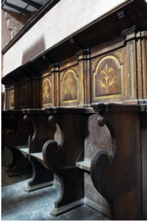
Fig. 27. Estalos de la sillería baja procedentes del coro de la iglesia monacal petrense. Coro de la iglesia de San Miguel de Ibdes.

Este se mantenía cerrado mediante un «grande rexado de bronce» coronado por una escultura de María, «diversos florones» y los escudos de las órdenes militares del Císter. 77 En el trascoro, de obra, estaba «pintada