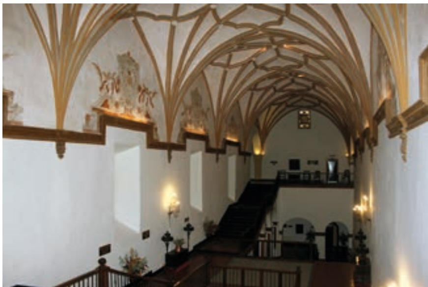
Fig. 16. Escalera del monasterio. Matías Ibáñez, h. 1700.

Ximénez de Cisneros era «tan observante, y contemplativo», mandó «cabar un peñasco» en la huerta «y disponer en su concabo una hermita» para el desarrollo de los ejercicios espirituales de los monjes (p. 105).