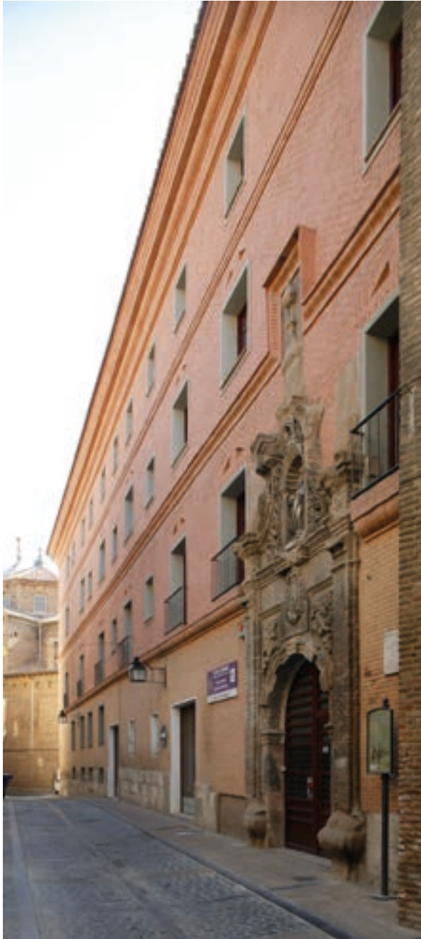
Fig. 20. Convento de Nuestra Señora de la Merced, Tarazona. Exterior. Diseñado por Matías Ibáñez antes de 1717.