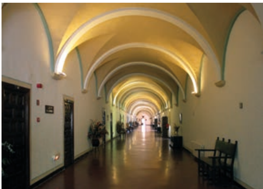
Fig. 15. Galería superior del claustro del monasterio. Matías Ibáñez, h. 1700.

comenzó aquella obra tan singular de la sala de la Diputación» (p. 100) y que, por su influjo, se inició «la hermosa y costosa obra, de la Cruz del Cosso, de Zaragoza», a la que califica de «fabrica, perfectissima, y comoda, que aun de los estrangeros ha sido mui aplaudida», sobre todo por actuar como relicario «en donde se guarda, y ven[era] tanta sangre, como derramaron, en defensiva de la Fe, de Christo, los Innumerables Martires de Zaragoza» (pp. 100-101). 60