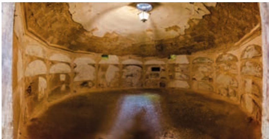
Fig. 13. Panteón o cripta de la iglesia monacal, 1618.

tada con él, consistente en la reconstrucción de una bóveda del dormitorio tras la demolición de la anterior. 58