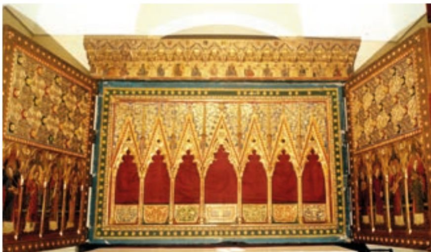
Fig. 5. Retablo relicario del monasterio de Piedra (abierto), 1390. Real Academia de la Historia, Madrid.

de viva carne, y sangre: Gran tesoro! con que quiso el Señor enriquecer la Religion de San Bernardo, y la Comunidad de Calatayud, para que todos los hereges, que obstinados, hazen tanta oposicion a este Divinissimo Sacramento, y al santo sacrificio de la missa, crean verdad tan infalible, ò se confundan con la misma. 35