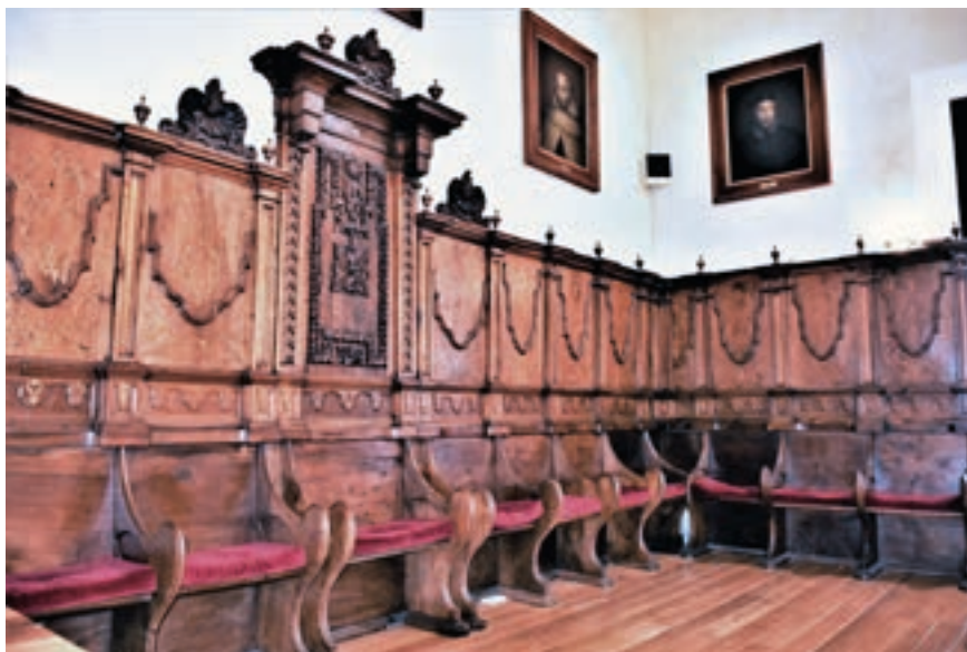
Fig. 26. Parte de la sillería alta procedente del coro de la iglesia del monasterio de Piedra. Salón de plenos del Ayuntamiento de Calatayud.

monacal [figs. núms. 24 y 25]. Estas tallas podrían adjudicarse al escultor Félix Malo, que se documenta trabajando en Piedra entre 1760 y 1763. 75