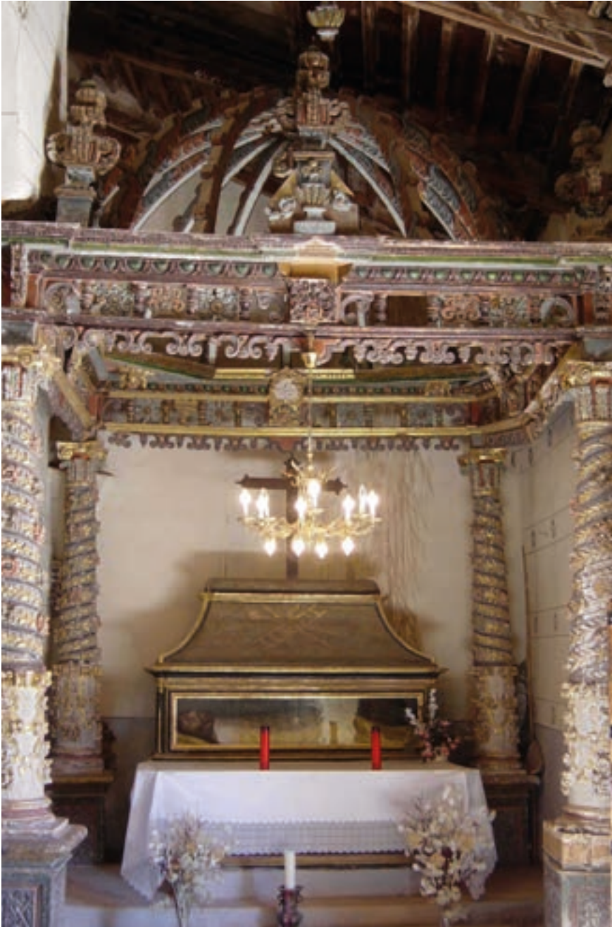
Fig. 31. Baldaquino de san Inocencio mártir, h. 1698. Ermita de la Virgen del Castillo de Monterde. Procede de la iglesia del monasterio de Piedra.