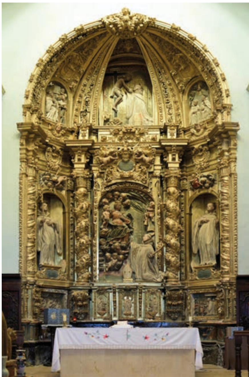
Fig. 30. Retablo mayor. Iglesia parroquial de Abanto. Procede de la iglesia del monasterio de Piedra.