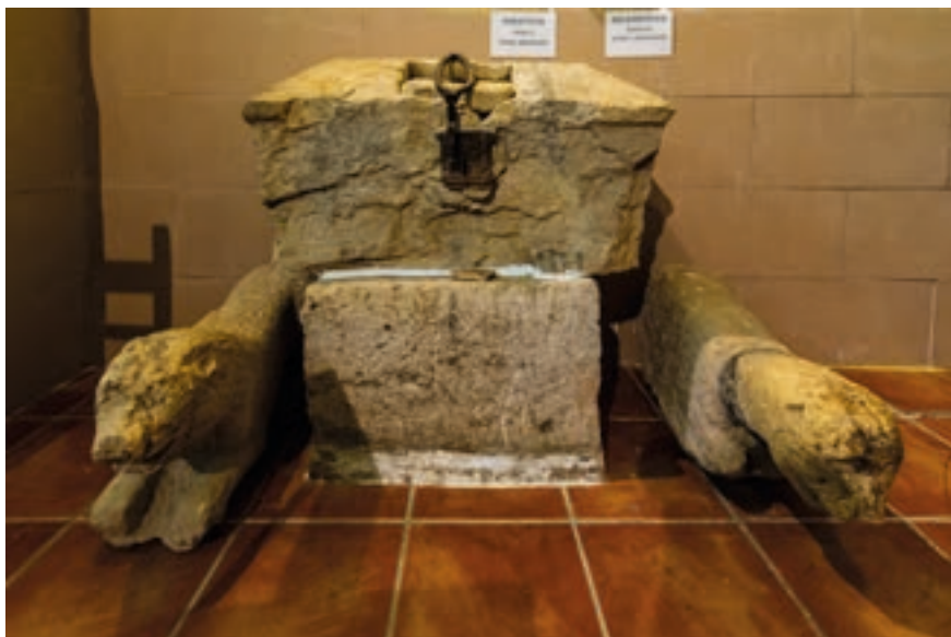
Fig. 7. Arca de piedra del Santo Dubio. Iglesia parroquial de Cimballa.

Tras una digresión acerca de la veracidad de las fechas del suceso (pp. 15-17), Sanz de Larrea calcula que don Martín entregó el sagrado corporal al monasterio de Piedra en 1400, bajo el mandato del abad Sancho Garlón (p. 85). No obstante, reconoce que «esta obscuridad, se origina de haberse perdido la escritura de donacion», debido a la «necesidad de ocultar los papeles, privilegios, y escrituras de este archivo, por el temor de las guerras, que a habido en Aragon, en diverssos tiempos», si bien atestigua que quedaba en el cenobio «el sello real, que estaba pendiente» y que describe con precisión (p. 18).