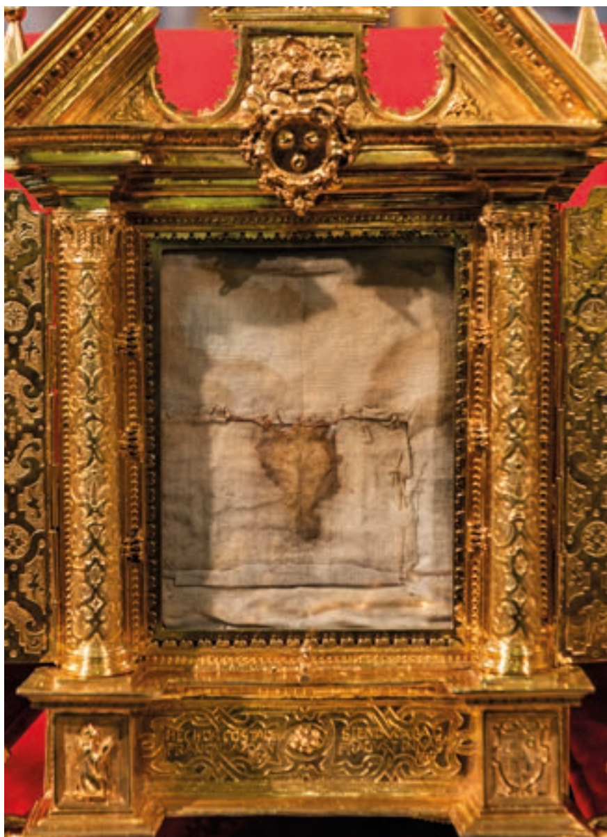
Fig. 3. Detalle del interior del relicario del Santo Dubio de Cimballa, 1594.