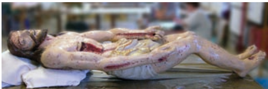
Fig. 32. Escultura del Cristo yacente. Ermita de la Virgen del Castillo de Monterde. Procede de la iglesia del monasterio de Piedra.

Sin duda, esta descripción se corresponde con el relicario de 1594 donde se custodian en la actualidad [fig. n.º 2], al que ya nos hemos referido y que se venera desde 1835 en la iglesia parroquial de Cimballa.