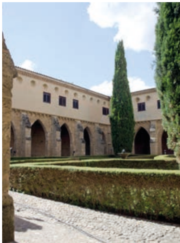
Fig. 14. Panorámica del claustro con los dos pisos que lo configuran.

La, en otro tiempo, escalera petrense [fig. n.º 12] es una pieza renacentista de notable interés que, más allá de sus referentes estructurales, debe valorarse en el contexto de la importancia que este tipo de elementos auxiliares adquirieron dentro de la arquitectura monástica en el transcurso del siglo XVI, a medida que se hizo cada vez más común la disposición de sobreclaustros y, en consecuencia, la necesidad de comunicar las partes bajas con las altas. Como sucede en Piedra, suelen situarse en un punto estratégico, muy cerca de una de las esquinas del claustro, y lo habitual es que adopten una solución de caja cerrada, generalmente sobre una base cuadrada que propicia la utilización de una cubierta abovedada, que a partir de los primeros años del siglo XVII será reemplazada por una media naranja. Más allá de que el espacio original esté desbaratado, es uno de los ejemplos aragoneses más bellos conservados de esta tipología.