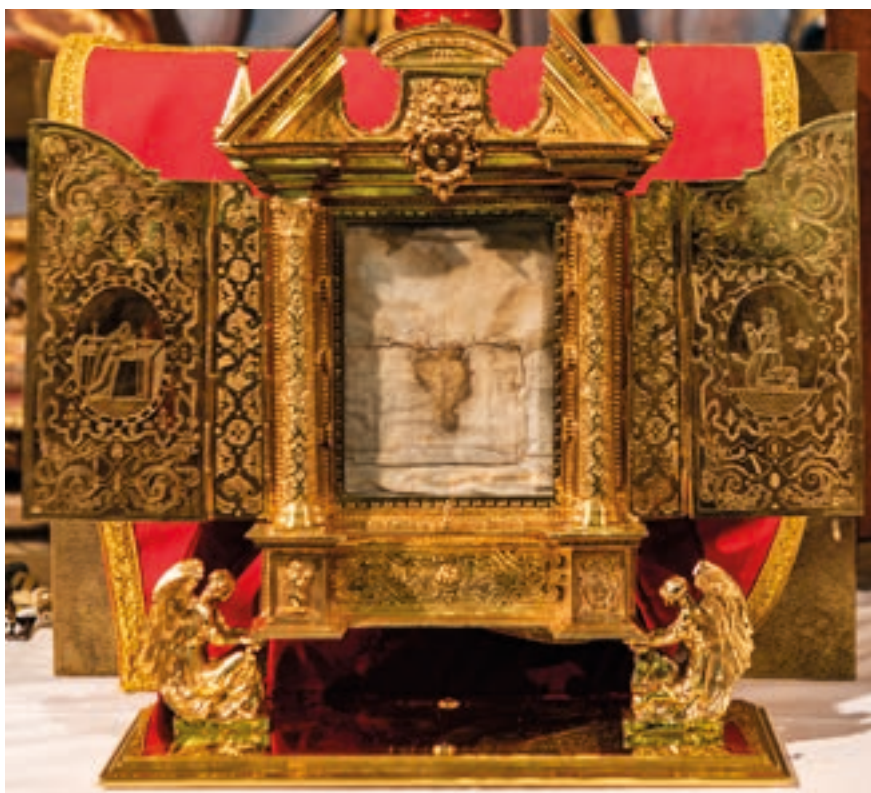
Fig. 2. Relicario del Santo Dubio de Cimballa, 1594.

allí, Argaiiz asevera que «ha obrado diferentes milagros», si bien únicamente recoge el sucedido el 5 de julio de 1593 cuando la exhibición de la reliquia desde el sobreclaustro dispó una gran tormenta de granizo. El beneditino finaliza su relato exponiendo que fue el obispo Pedro Cerbuna (1585-1597) quien, en una visita al cenobio, «viendo que no estava con la reverencia, que debia», ordenó renovar su contenedor. 25 Fue en ese momento cuando el corporal se incluyó en el relicario en el que se conserva en la actualidad, fechado en la propia pieza en 1594 [figs. núms. 2 y 3], 26 y custodiado en la iglesia parroquial de Cimballa desde 1835. 27