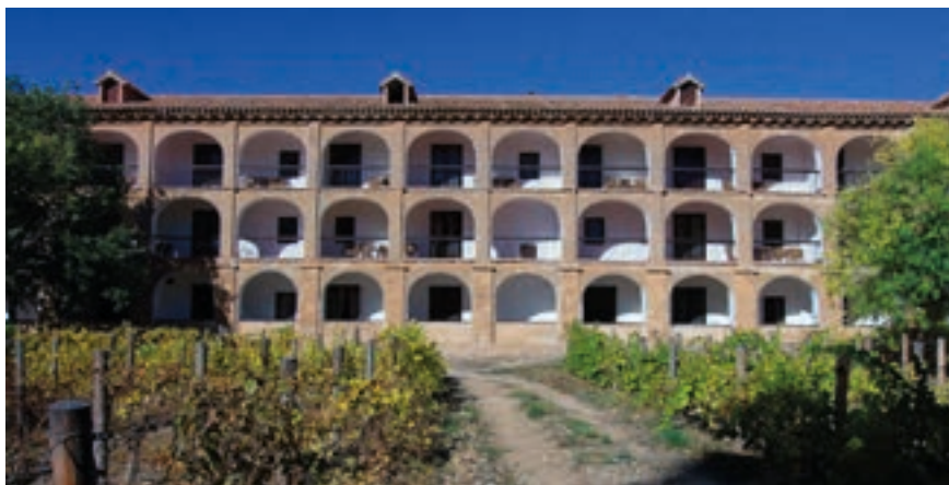
Fig. 22. Exterior de las antiguas celdas de los monjes. Monasterio de Piedra, siglo XVIII.

era gravísima pues, como los propios mercedarios reconocieron, «la ruina de la iglesia nos precisa a tener las puertas de ella cerradas; y a la prosecucion de la obra descubierta, el estar la mitad de los religiosos sin celdas», debido a que la fábrica de las dependencias conventuales diseñada por el cisterciense Matías Ibáñez todavía no había concluido. 68