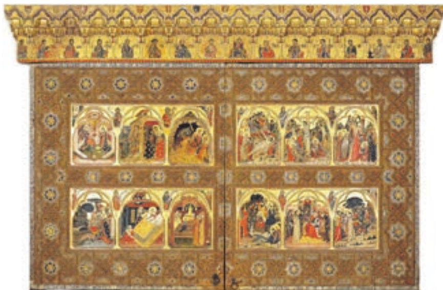
Fig. 4. Retablo relicario del monasterio de Piedra (cerrado), 1390. Real Academia de la Historia, Madrid.