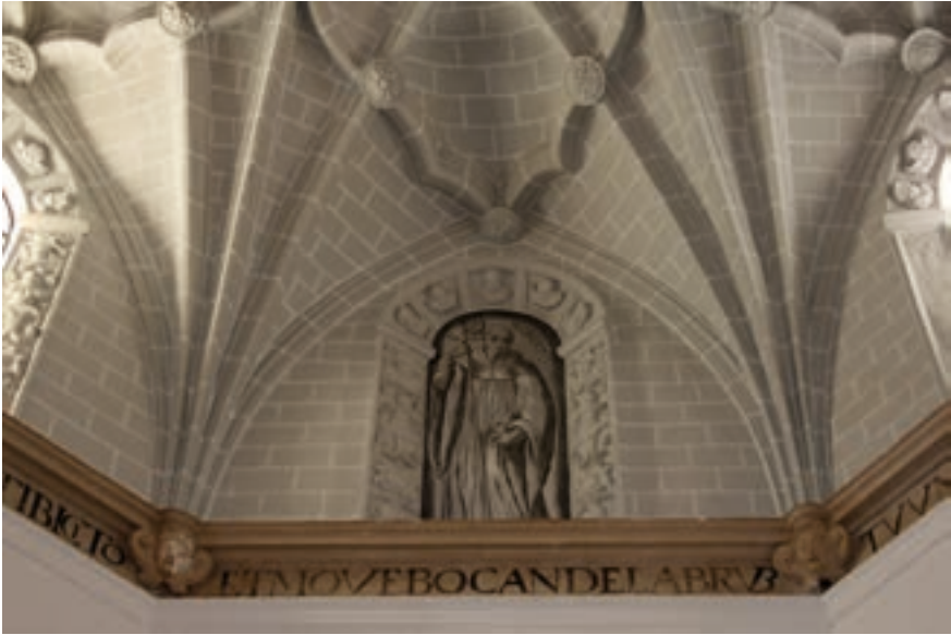
Fig. 11. Antigua escalera del claustro, 1581. Detalle de la bóveda.