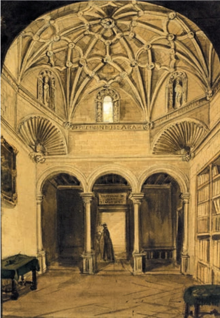
Fig. 10. Biblioteca del monasterio, antigua escalera mayor. Dibujo de Valentín Carderera, 18 de septiembre de 1840. Lápiz, aguada y acuarela. Colección Carderera, Fundación Lázaro Galdiano, Madrid.