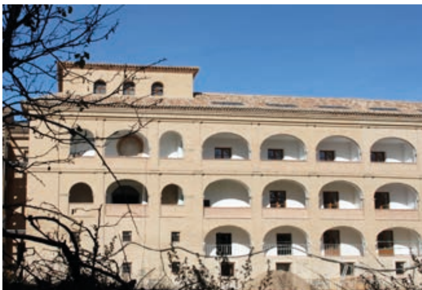
Fig. 23. Exterior del monasterio nuevo de Santa María de Veruela.

Regresando a las obras del monasterio de Piedra, Sanz de Larrea dedica el capítulo XII del libro I de su manuscrito a la descripción minuciosa del templo, loando su riqueza y suntuosidad. De los pormenores recogidos queremos destacar, en primer lugar, que el presbiterio estaba «adornado con colgaduras de damasco verde, y pajizo; y sobre ellas, colocados los retratos de los serenísimos reyes fundadores don Alonso II, y doña Sancha» (pp. 121-122). Ambas pinturas se conservan en la actualidad en el Ayuntamiento de Calatayud a donde llegaron entre 1836 y 1840. 71