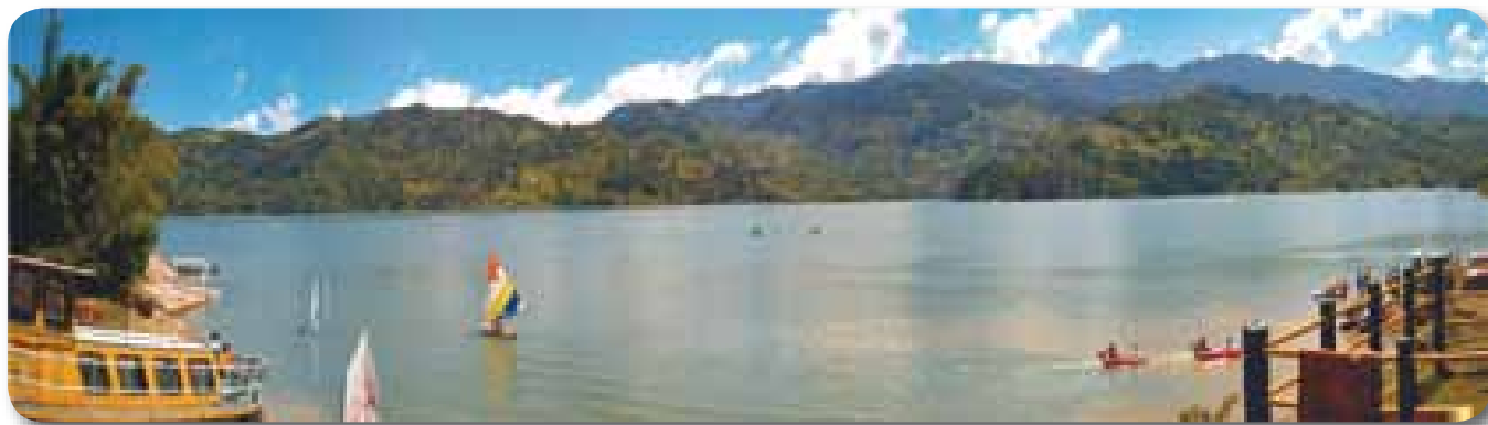
►► Panorámicas del embalse del Guavio (Gachalá).