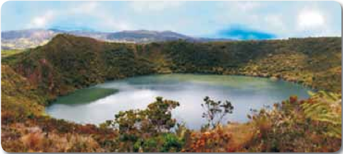
►► Laguna de Guatavita.

Las alturas registradas en la reserva varían entre los 2.880 msnm en el extremo suroeste, en la vereda Carbonera Baja del municipio de Guatavita y los 3.200 msnm en la cuchilla Peña Blanca del municipio de Sesquilé, aproximadamente en el centro de la reserva. La parte más alta del cono de la laguna alcanza una altura de 3.080 msnm.