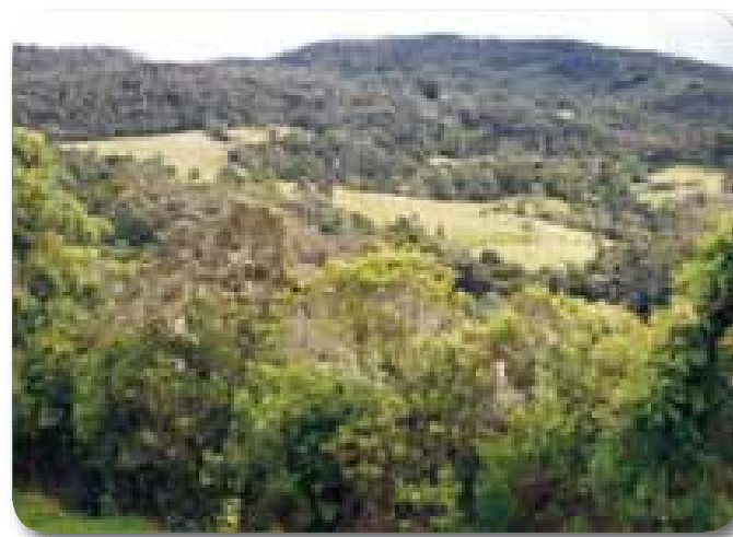
►► Panorámicas de la “Reserva El Encenillo”. Vereda La Concepción, Guasca.