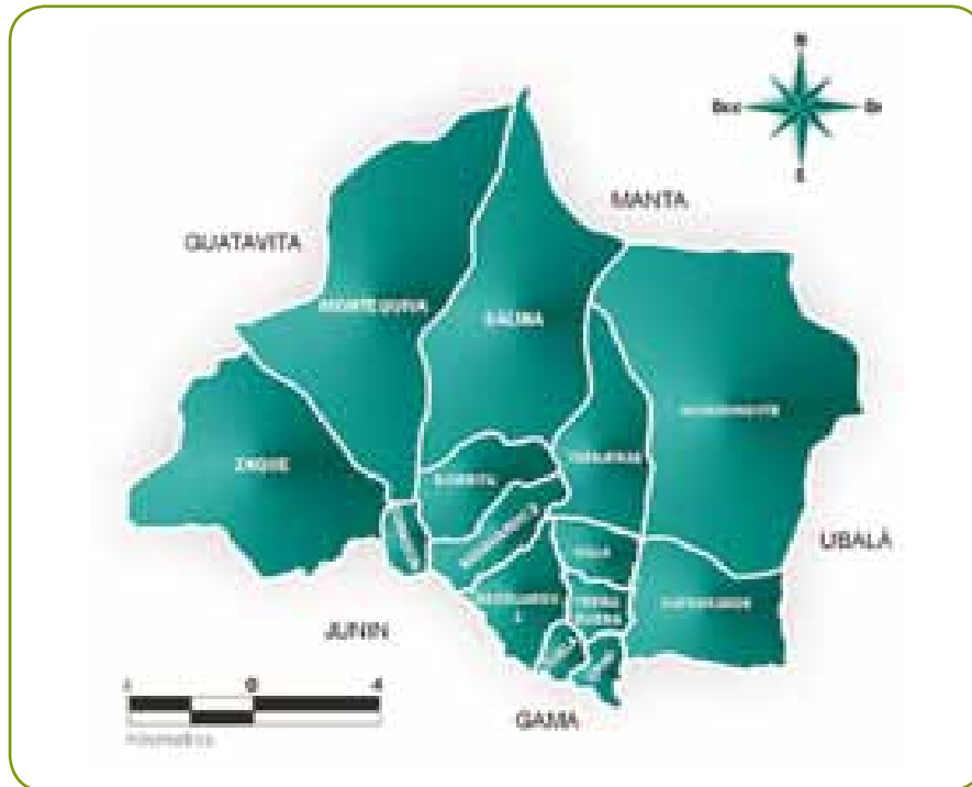
» Ubicación veredas de Gachetá.