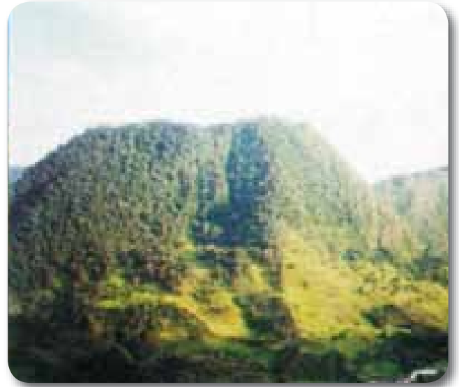
» «Reserva río Blanco» (cuchilla de California y veredas La Jangada, Mundo Nuevo y El Manzano).