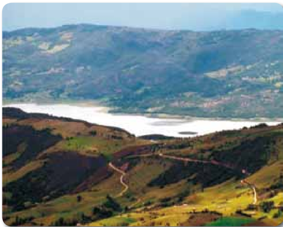
►► Panorámica del embalse de Tominé.

Al igual que en la mayor parte de las regiones del planeta, la zona del embalse de Tominé ha estado sufriendo las consecuencias de la creciente intervención humana sobre el paisaje; lo que ha traído como consecuencia, que gran parte de los hábitats que debieron haber existido se encuentren actualmente deteriorados o fragmentados, lo cual ha generado directamente la pérdida de la diversidad biológica. Hoy día, la fragmentación, destrucción y transformación de los hábitats naturales constituyen la principal amenaza para la subsistencia de la vida silvestre, ya que provoca la desaparición, migración o, en el peor de los casos, la extinción de las especies animales que allí habitan, producto de la eliminación de refugios, lugares de reproducción y fuentes alimenticias.