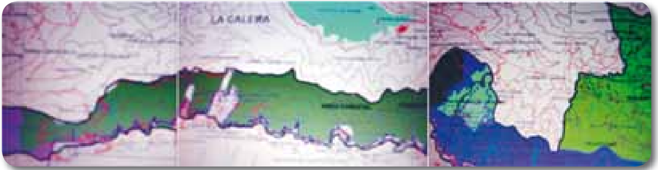
Cerros orientales de Bogotá.