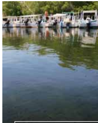
BAGRES Y SARDINAS EN LA RESTINGA

Los visitantes deben llevar dinero en efectivo. En La Restinga no hay cajeros automáticos ni puntos de venta