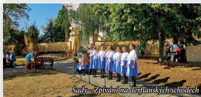
Sady - Zpívání na derflanských schodech