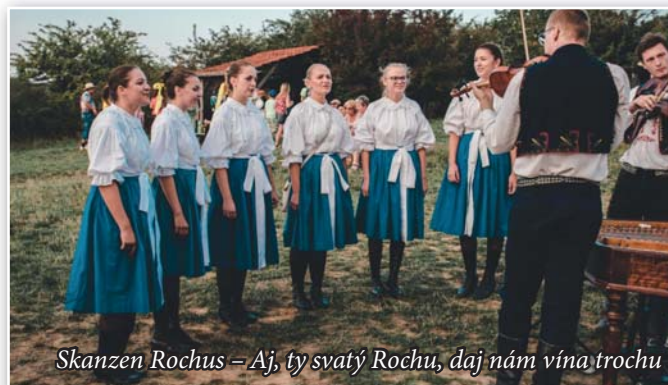
Skansen Rochus – Aj, ty svatý Rochu, daj nám vína trochu