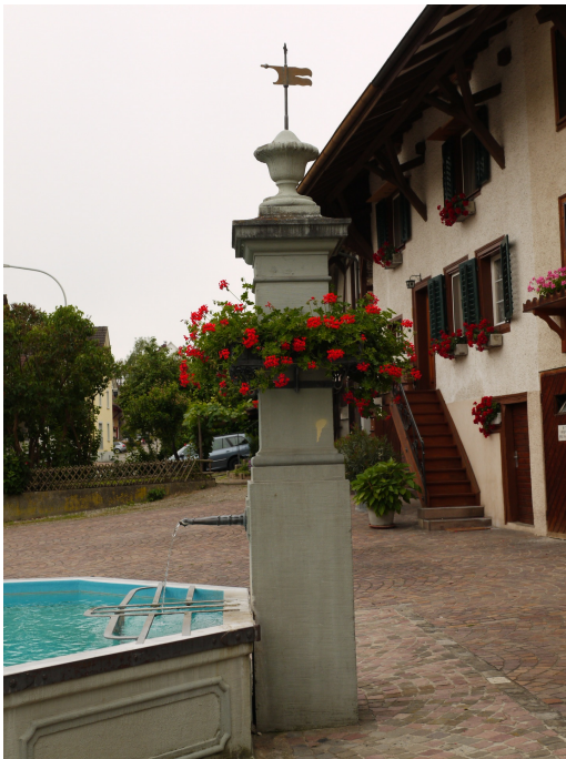
Dorf- oder Breitenbrunnen, Brunnenstock, Ansicht von O, 27.06.2013 (Bild Nr. D100572_03).