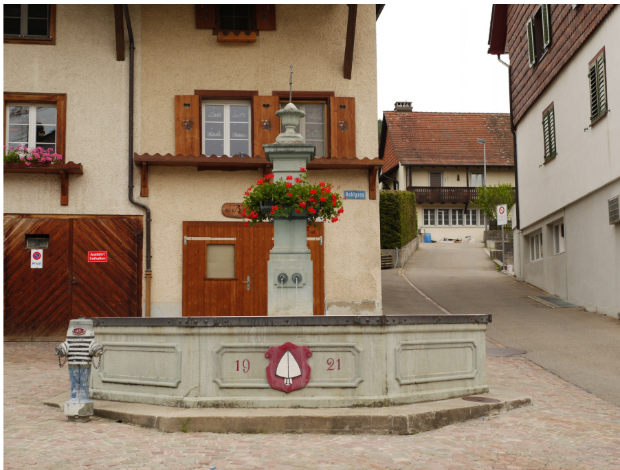
Dorf- oder Breitenbrunnen, Ansicht von S, 27.06.2013 (Bild Nr. D100572_01).