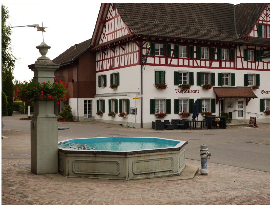
Dorf- oder Breitenbrunnen, Ansicht von W, 27.06.2013 (Bild Nr. D100572_05).