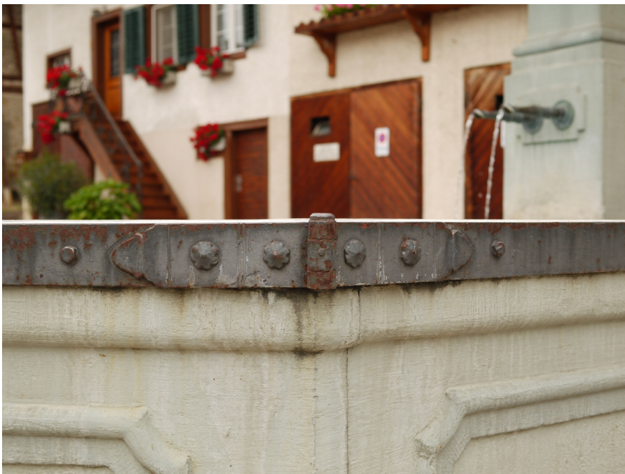
Dorf- oder Breitenbrunnen, Flacheisenband mit Scharnieren und Nietenköpfen, 27.06.2013 (Bild Nr. D100572_02).