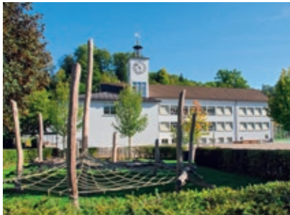
Schulhaus Hirsgarten, Rikon

Schulhaus Langenhard Langenhardstrasse 141 8486 Rikon T 052 551 05 76