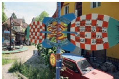
Winterquartier Circolino Pipistrello in Schöntal bei Rikon

Der Mitspielzirkus «Pipistrello» hat seit den 1980er-Jahren sein Winterquartier im Schöntal bei Rikon. Während der Tourneezeit in den Sommermonaten werden auf dem Zirkusareal regelmässig Kurse und Veranstaltungen für Jung und Alt angeboten.