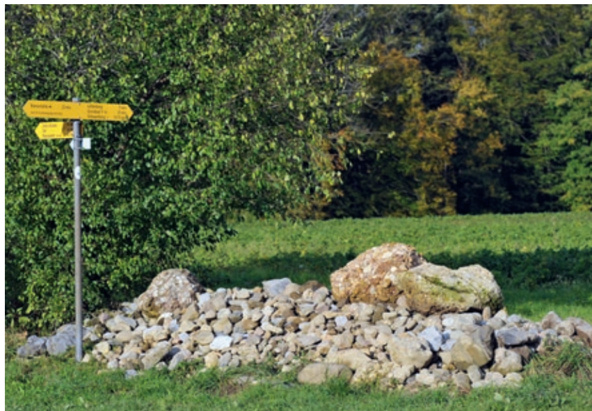
In Zell gibt es zahlreiche Wandermöglichkeiten.