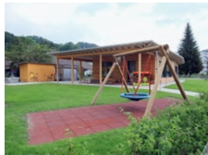
Kindergarten in Rikon