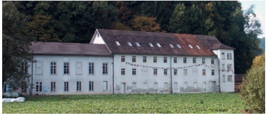
Die Spinnerei an der Neschwilerstrasse in Rikon