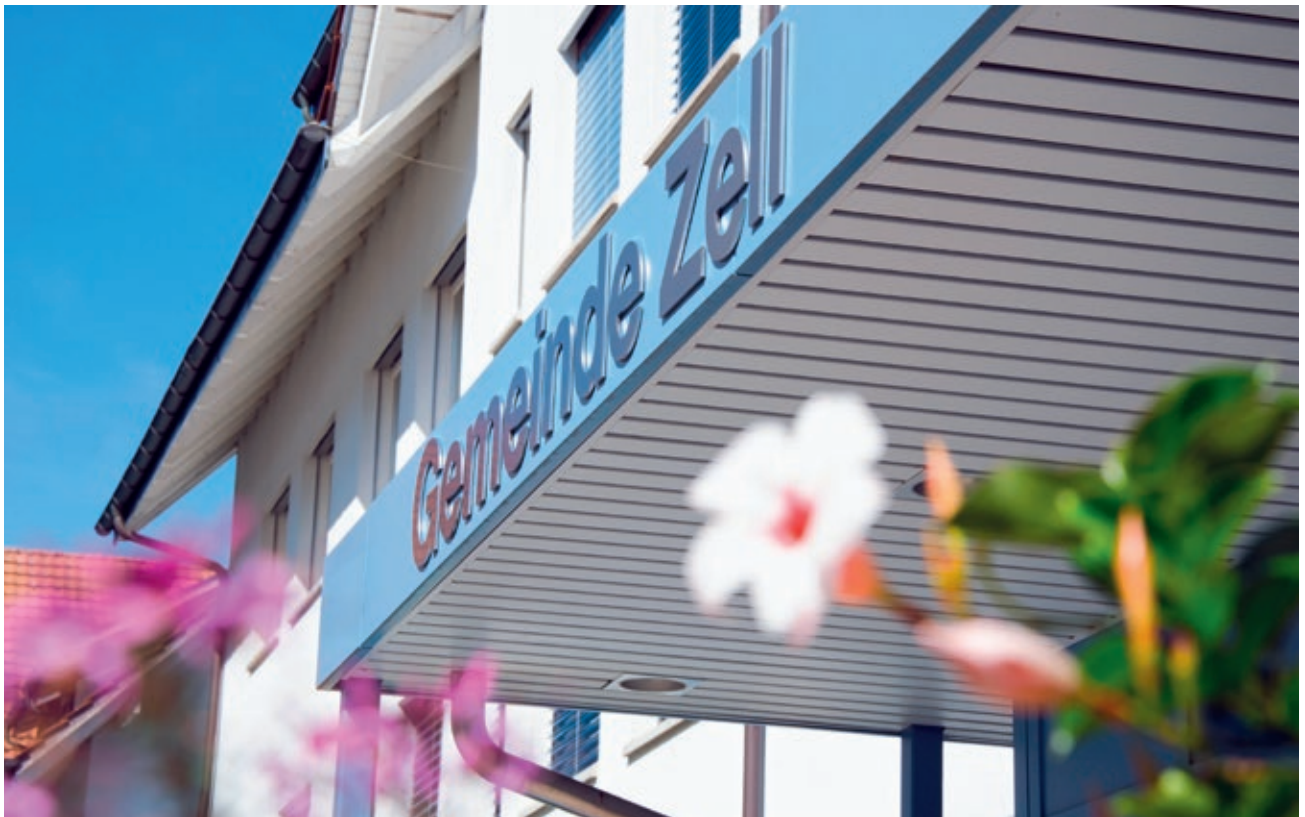
Gemeindehaus Zell im Zentrum von Rikon

Für besondere Anliegen können bei den Verwaltungsabteilungen auch Termine ausserhalb dieser Öffnungszeiten vereinbart werden!