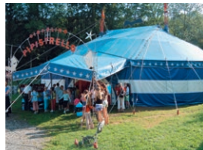
Circolino «Pipistrello», Schöntal, Rikon

Der Mitspielzirkus «Pipistrello» hat seit den 1980er-Jahren sein Winterquartier im Schöntal bei Rikon. Während der Tourneezeit in den Sommermonaten werden auf