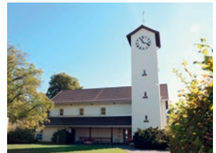
Reformierte Kirche Kollbrunn