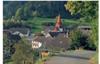
Zell mit reformierter Kirche