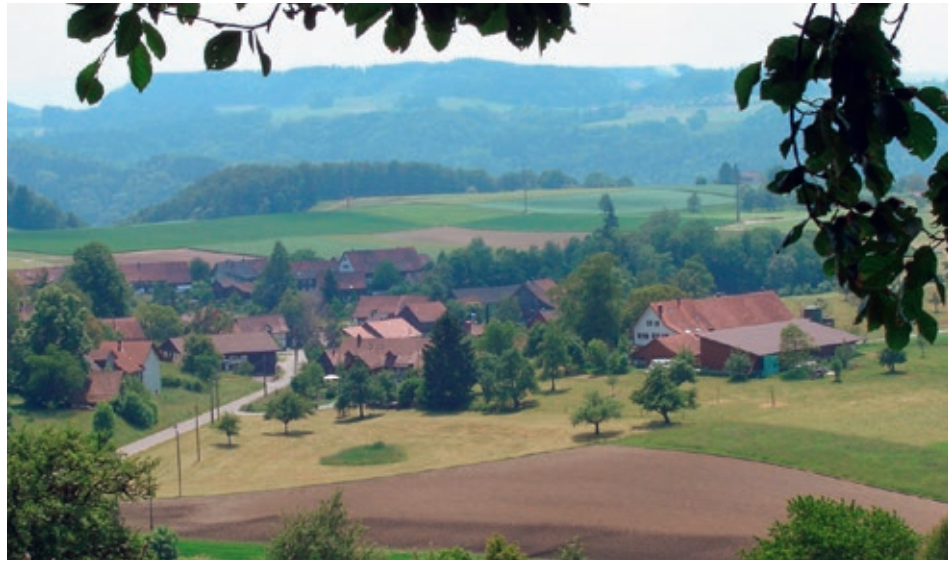
Aussichtspunkt Wissen in Langenhard

Der höchste Punkt der Gegend (889 m. ü. M.) bietet eine herrliche Rundumsicht. Von Bedeutung sind hier auch die Ausgrabungen der mittelalterlichen Burg der Herren von Schauenberg.