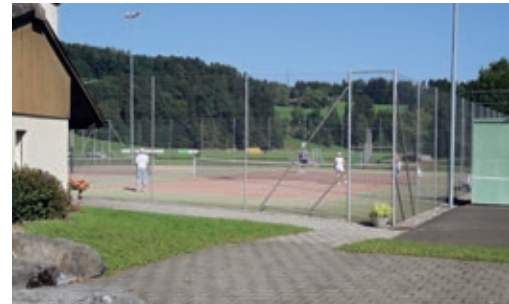
Tennisplatz in Rikon