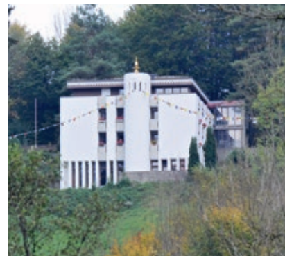
Tibet-Institut in Rikon

Quellen: Geschichte der Gemeinde Zell (zu beziehen bei der Gemeindeverwaltung in Rikon). Geschichte des Kantons Zürich, Band 3, Werd Verlag. Im Buchhandel erhältlich.