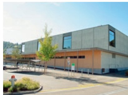
Mehrzweckhalle Rägeboge, Kollbrunn

Wartstrasse 5 8400 Winterthur T 052 203 08 00