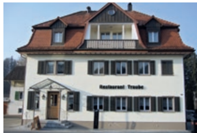
Restaurant Traube, Rikon

Ortsvertretung Zell Loni Kuhn Im Feld 22 8486 Rikon T 052 383 25 72/M 079 734 46 02