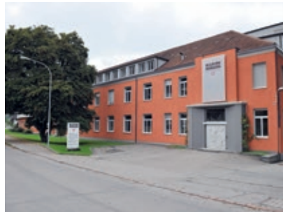
Kuhn Rikon AG