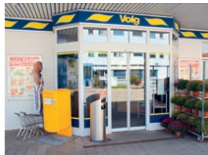
Dorfladen in Rikon

Direktverkauf ab Bauernhof: Milch, Eier, Wachteleier, Beeren, Obst usw.