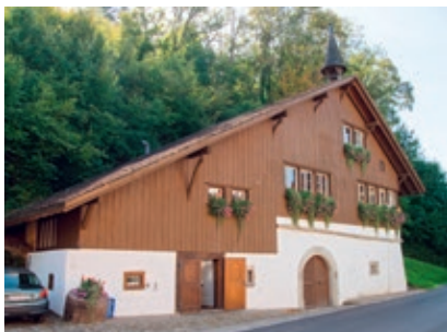
Die Zehntenscheune in Rikon