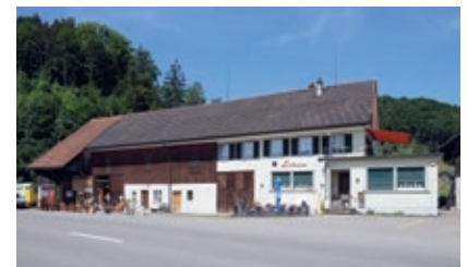
Restaurant Liebenau, Kollbrunn

Obstgarten, Oberlangenhart T 052 383 11 93