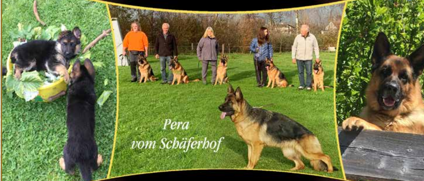
Pera vom Schäferhof