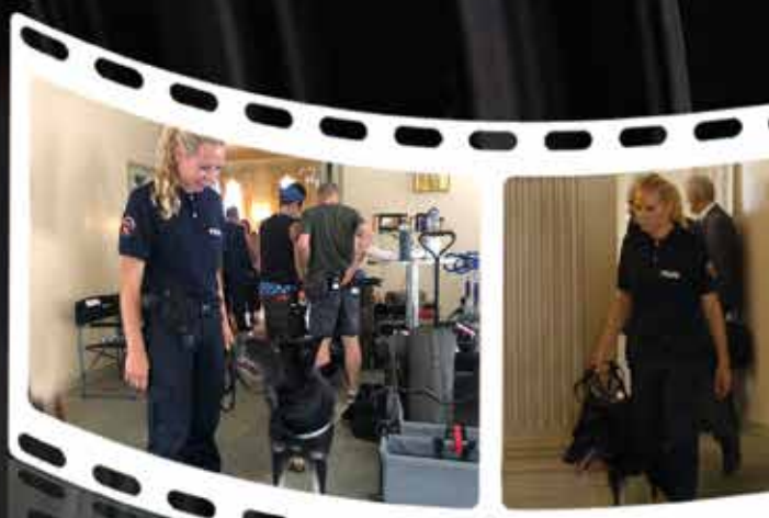
Sprengstoffsuchhund in Helvetica