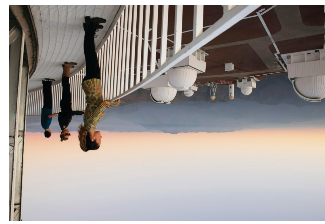
Arriba Disfrutando de un día de playa. Centro Sabrosa gastronomía con productos del mar. Abajo Panorámica Observatorio Cerro Tololo.

Ubicada en la zona centro-norte de Chile, la Región de Coquimbo ofrece una variedad de paisajes naturales y culturales dignos de conocer y recorrer en profundidad. Desde las ciudades, playas y balnearios que se extienden por toda su extensa costa hasta los valles interiores que se internan en la cordillera de Los Andes. La diversidad de productos turísticos que encuentra en sus 15 comunas la han convertido en uno de los destinos más demandados y valorados de Chile. La oferta turística tradicional y más desarrollada es la de sus áreas costeras, siendo la conurbación La Serena-Coquimbo la que ejerce la mayor atracción. Sin embargo, está emergiendo con fuerza el turismo orientado a satisfacer intereses especiales: excursiones a valles y cordilleras, observación astronómica, turismo rural y gastronómico, de salud y misticismo, deportes y observación de la naturaleza.