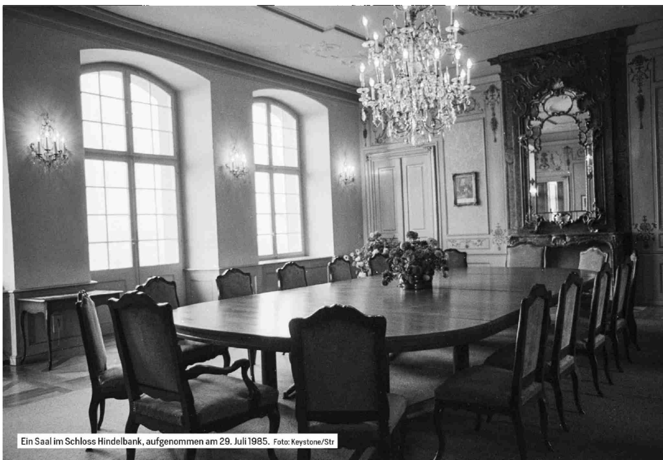
Ein Saal im Schloss Hindelbank, aufgenommen am 29. Juli 1985.

Referenz: 82128680 Ausschnitt Seite: 8/9