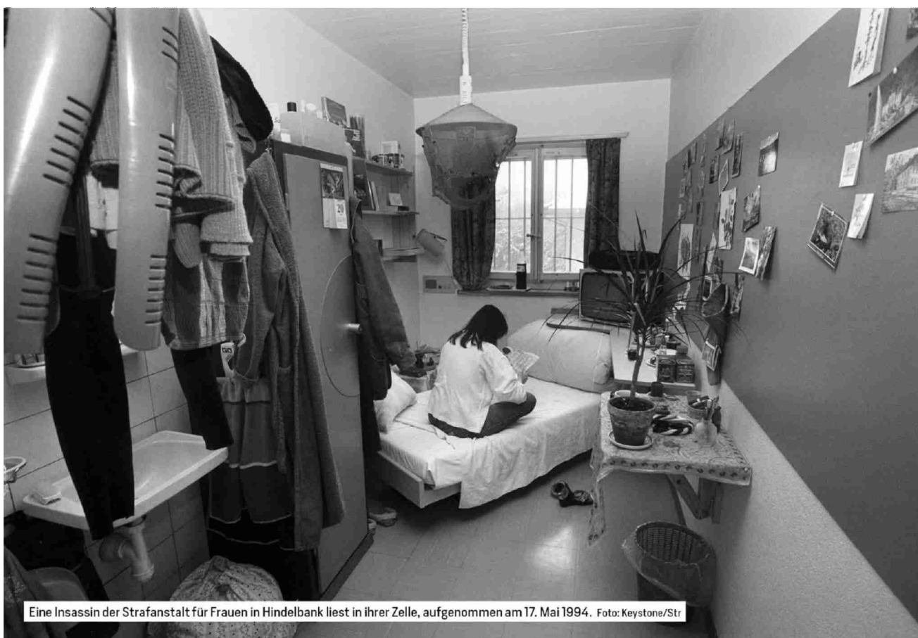
Eine Insassin der Strafanstalt für Frauen in Hindelbank liest in ihrer Zelle, aufgenommen am 17. Mai 1994.

Referenz: 82128680 Ausschnitt Seite: 6/9