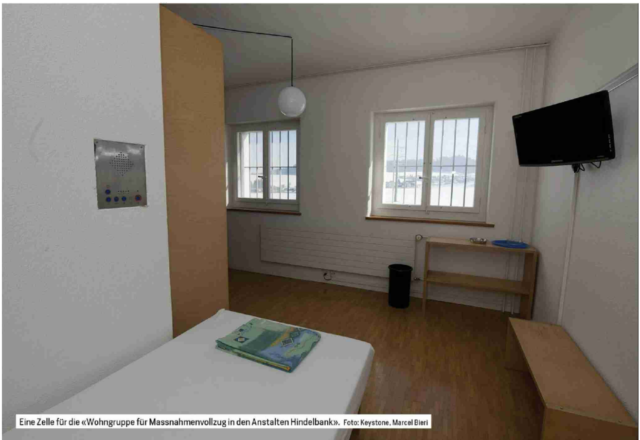
Eine Zelle für die «Wohngruppe für Massnahmenvollzug in den Anstalten Hindelbank».

Auftrag: 1077523 Themen-Nr.: 999.084 Referenz: 82128680 Ausschnitt Seite: 7/9