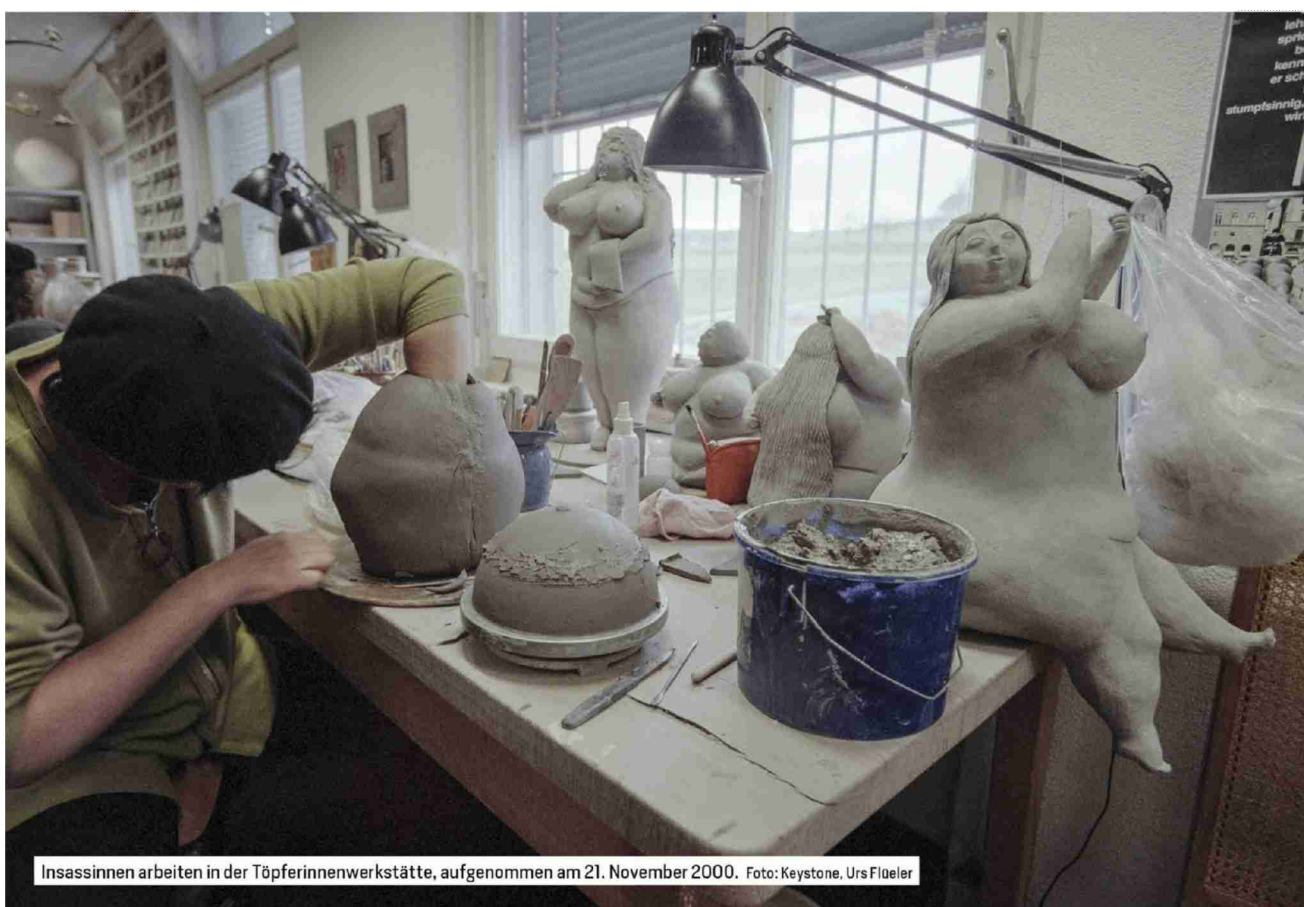
Insassinnen arbeiten in der Töpferinnenwerkstätte, aufgenommen am 21. November 2000.

Referenz: 82128680 Ausschnitt Seite: 5/9