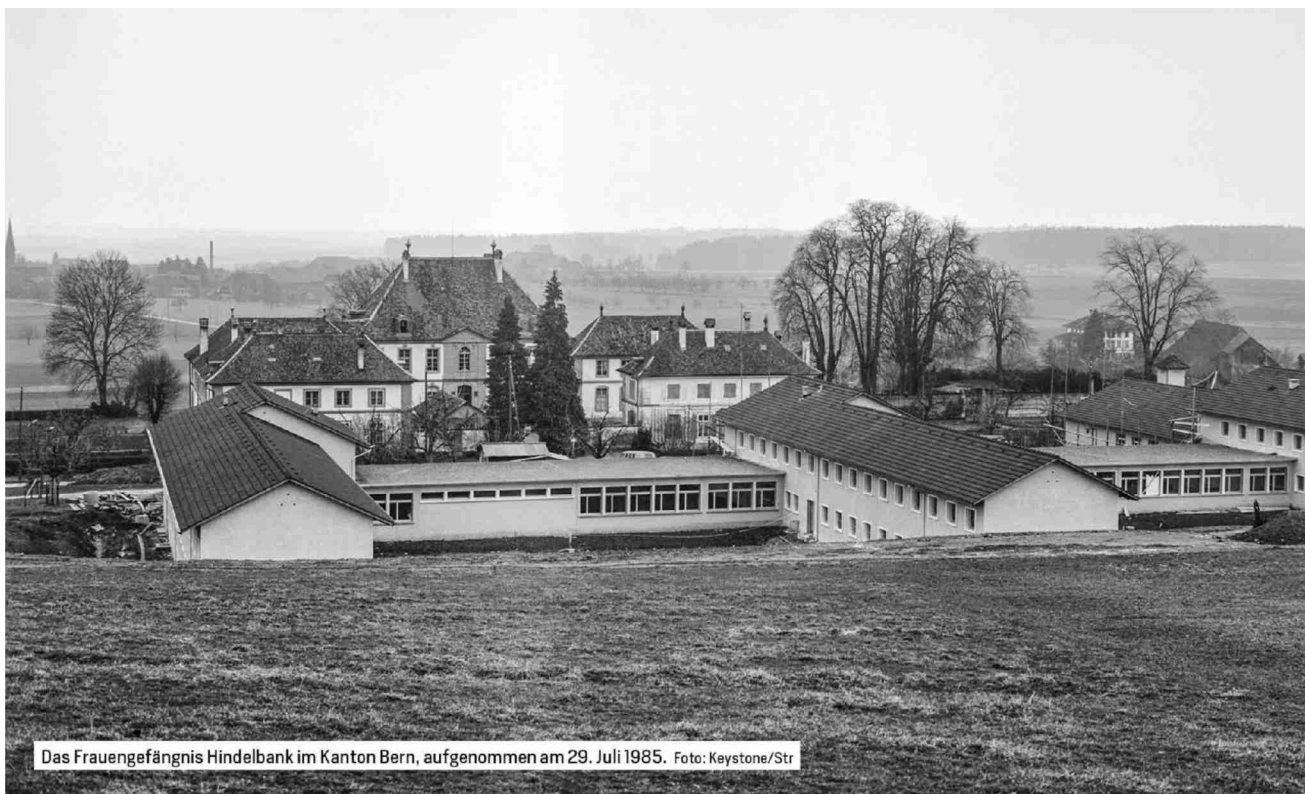
Das Frauengefängnis Hindelbank im Kanton Bern, aufgenommen am 29. Juli 1985.

Referenz: 82128680 Ausschnitt Seite: 3/9