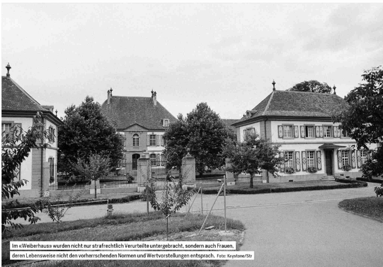
Im «Weiberhaus» wurden nicht nur strafrechtlich Verurteilte untergebracht, sondern auch Frauen, deren Lebensweise nicht den vorherrschenden Normen und Wertvorstellungen entsprach.

Referenz: 82128680 Ausschnitt Seite: 2/9