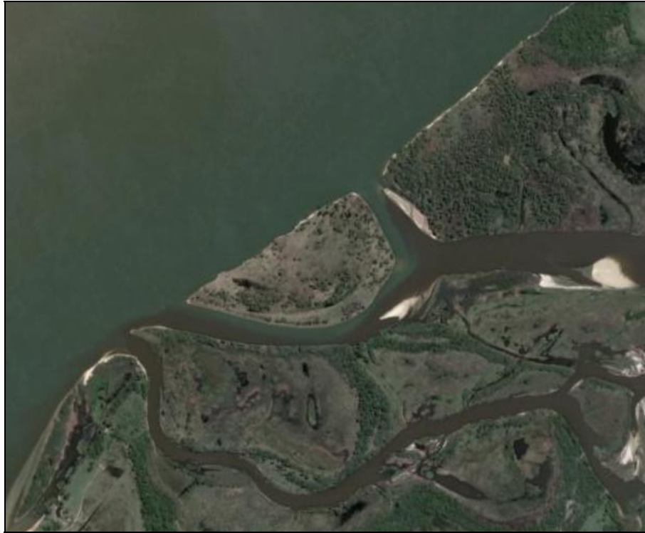
Desembocadura del río Santa Lucía en el río Paraná.

La Subsecretaría de Recursos Hídricos cuenta con estaciones hidrológicas a lo largo del río Santa Lucía. En el siguiente cuadro se detallan los caudales.