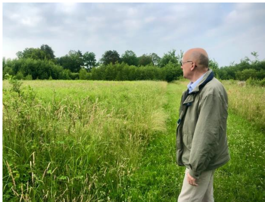
Genieten van de eindeloze natuur