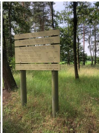
De geologische tuin