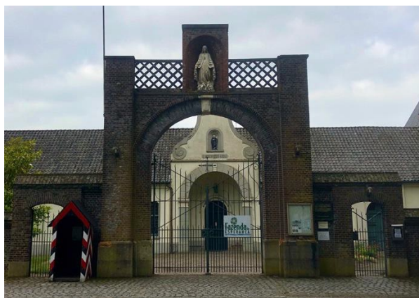
Inkooport Achelse Kluis