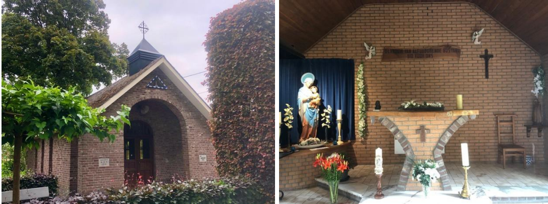
Het kapelletje van de Hees

Aan KP 213 neem je afscheid van het kanaal om richting Hamont te fietsen (KP 568). Links zie je het Boskapelletje van de Hees. De kapel is gewijd aan O.L.V. van Altijddurende Bijstand.