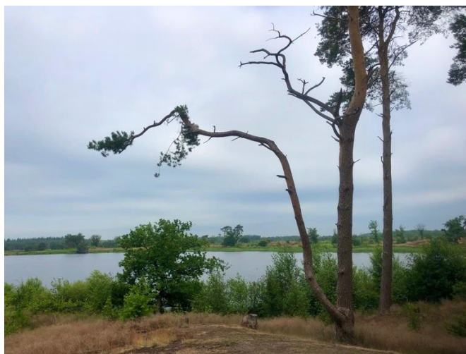
Oorverdovende stilte aan het Groot Malpieven