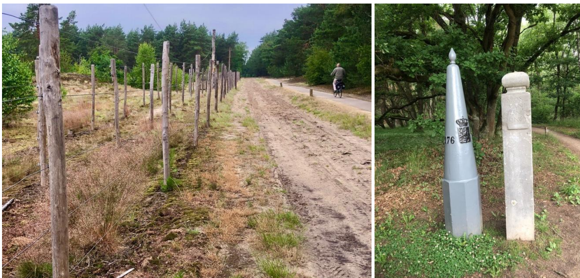
Fietsen langs den Doodendraad