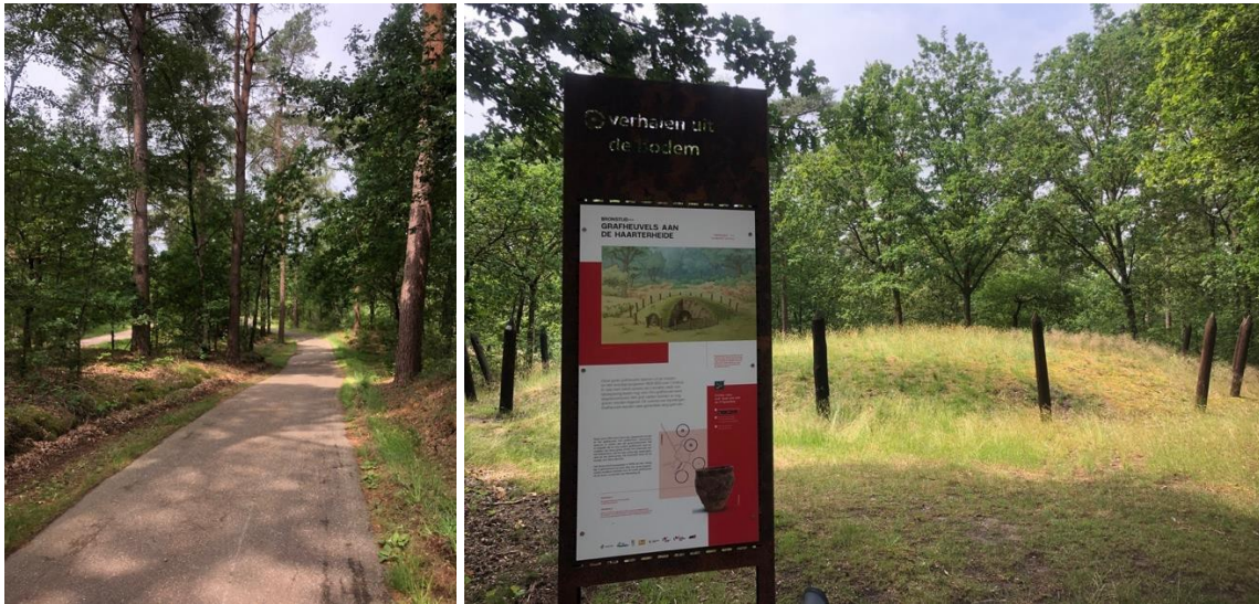
Door het bos tot aan de grafheuvels van de Haarterheide

Wat verder kom je aan de ruïnes van de Waag. Dit gebouw werd opgericht in 1772. De boeren uit de dorpen Achel, Lille en Hamont moesten hier verplicht hun graan komen wegen. De Waag lag tussen twee bestaande molens. Onder de Franse bezetting veranderden de wetten. Iedereen kon terug het graan laten malen waar hij wou. De Waag werd een gewone boerderij die tot in 1956 actief was. Wat verder zie je een geologische tuin. Langs het wandelpad heeft men een planetenpad aangelegd.