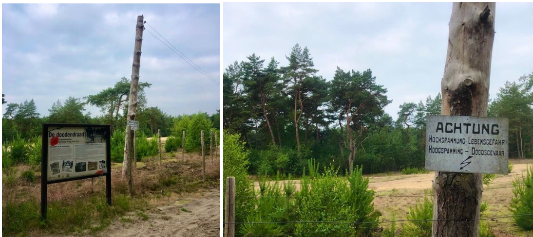
De reconstructie van 'Den Dood', een blijvende herinnering aan WO I

Met de rug naar het café ga je links. Na 160 m draai je links af op de Mulk . Na 550 m ga je terug links op Mulkerheide . Ook op de Ruiterstraat houd je links aan. Je volgt vanaf hier het fietsknooppuntennetwerk Limburg (richting KP 216). Je komt aan 'Den Doodendraad', een blijvende herinnering aan de Grote Oorlog. Om tijdens Wereldoorlog I te verhinderen dat Belgische oorlogsvrijwilligers naar het neutrale Nederland zouden vluchten, plaatste de Duitse bezetter langs de 300 km lange grens een draadconstructie. De middelste draadversperring stond onder een spanning van 3000 volt. Wie ze aanraakte, werd geëlectrocuteerd. Vanaf 1916 spanden de Duitsers een extra draad op circa 80 m van de doodendraad. Alle huizen in de sperzone werden afgebroken. Volg KP 38 en 36. Je rijdt een stukje langs Den Doodendraad op Nederlands grondgebied. Je geniet met volle teugen van natuurgebied 'De Grootte Heide'. Je komt aan de Achelse Kluis. KP 217 ligt letterlijk op de grens.