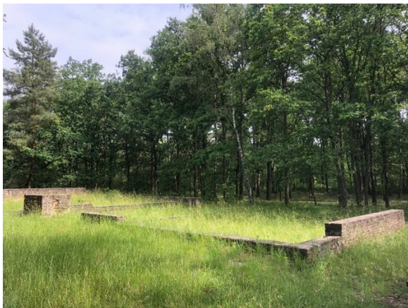
De ruïnes van de Waag

Wat verder kom je aan de ruïnes van de Waag. Dit gebouw werd opgericht in 1772. De boeren uit de dorpen Achel, Lille en Hamont moesten hier verplicht hun graan komen wegen. De Waag lag tussen twee bestaande molens. Onder de Franse bezetting veranderden de wetten. Iedereen kon terug het graan laten malen waar hij wou. De Waag werd een gewone boerderij die tot in 1956 actief was. Wat verder zie je een geologische tuin. Langs het wandelpad heeft men een planetenpad aangelegd.