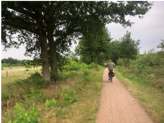
Dwars door de Grootte Heide