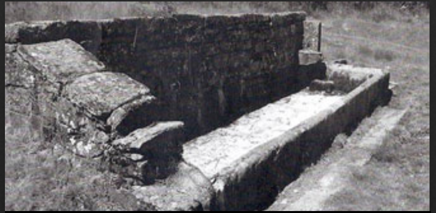
Fuente de los Carballos.

dad del contrabando y algunas residencias de carácter señorial. Las grandes edificaciones de piedra se alternan con otras sencillas arquitecturas populares que han mantenido el encanto de lo sencillo. En estas edificaciones, también de piedra, son características las galerías y solanas, que llegan a ocupar todo el frontal de las viviendas, e incluso varias plantas.