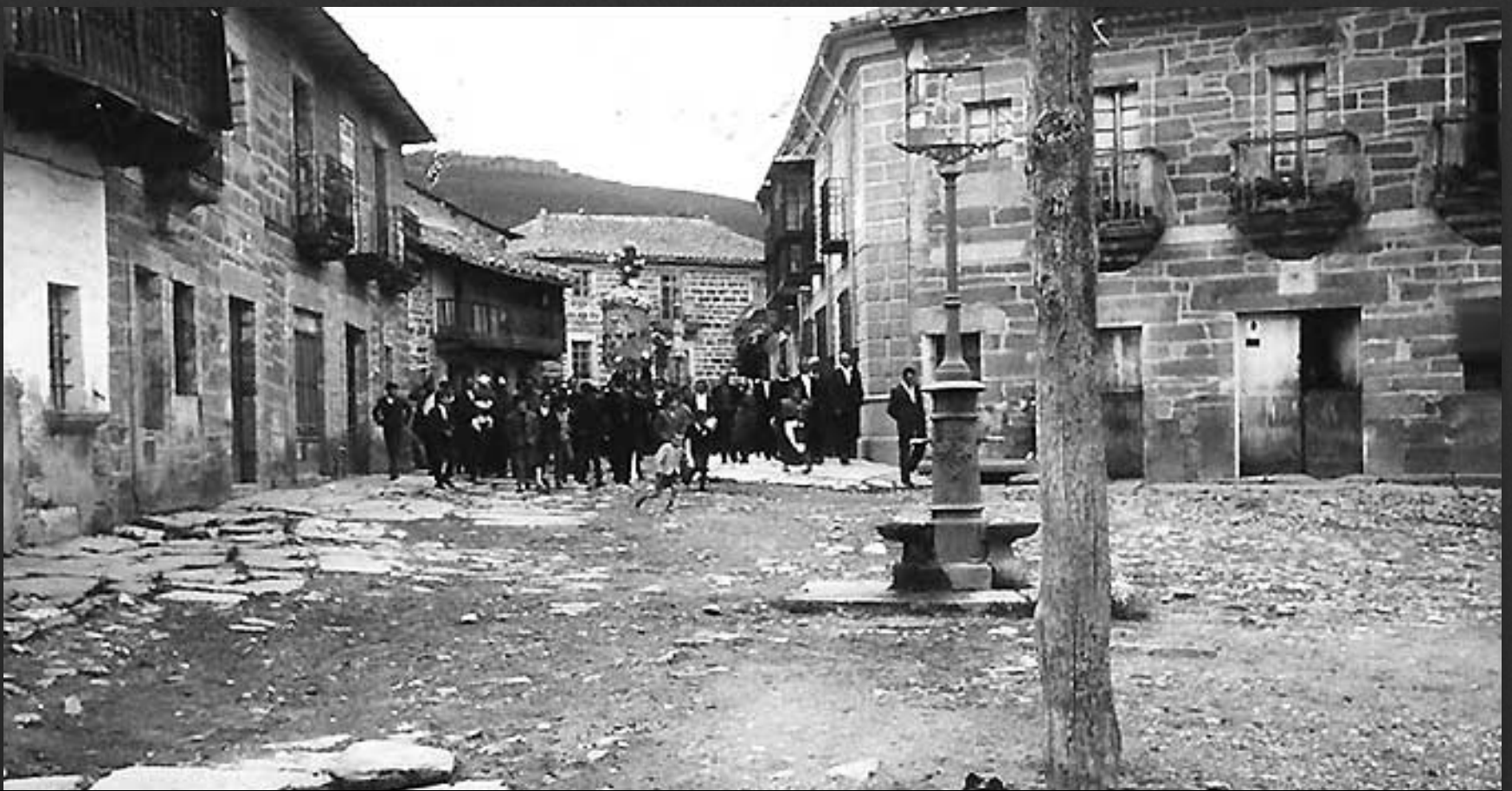
Calles de Villardeciervos.