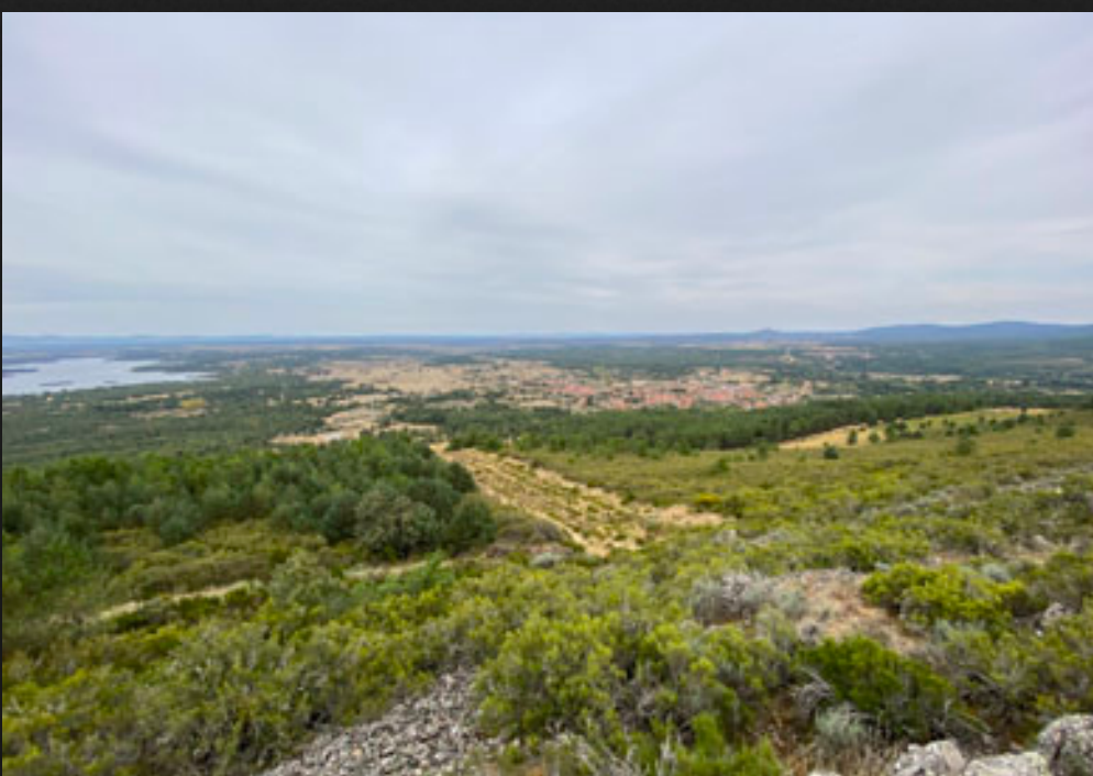
Vistas desde Peña del Castro de Villardeciervos y el embalse de Valparaíso

Desde este punto se distinguen los sinuosos entrantes del embalse de Valparaíso, las cumbres de la Sierra de la Cabrera al fondo, y el pueblo de Villardeciervos a los pies de la Peña. Del otro lado, la Sierra de la Culebra, el pueblo de Boya, los extensos pinares del Portillo y el Valle de la Barota, todo un regalo para la vista.