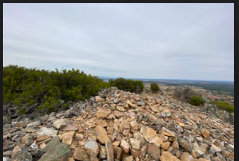
Peña del Castro