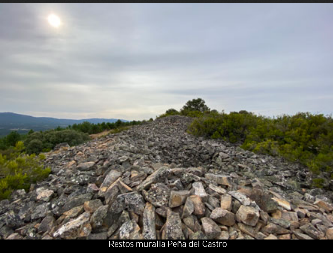
Restos muralla Peña del Castro

Dentro del casco urbano existen varias edificaciones de cierto valor histórico y cultural, por un lado la iglesia de Nuestra Señora de la Asunción así como las ruinas del llamado “Palacio”, por otro lado un conjunto de edificaciones de piedra de los siglos XVIII y XIX con importante presencia en el pueblo como la casa de los balcones.