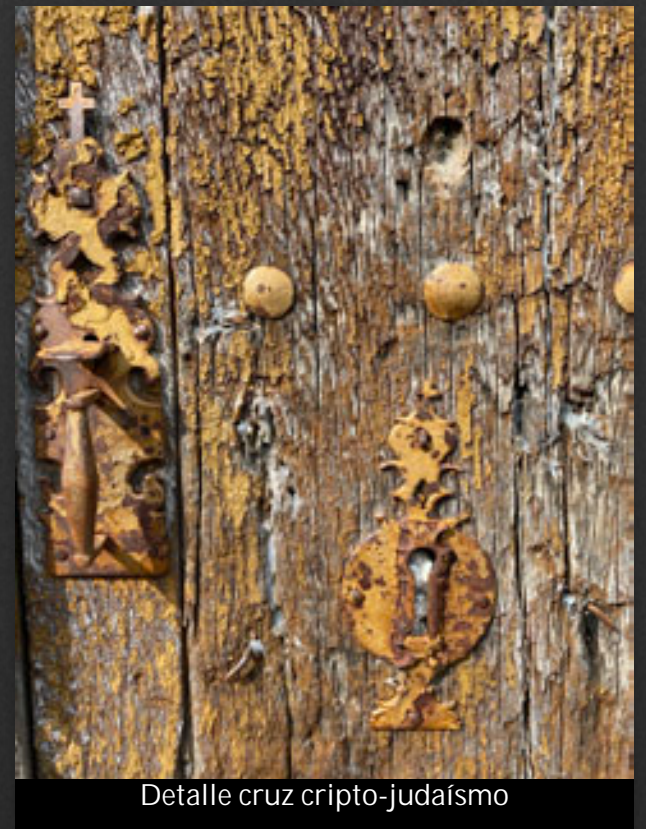
Detalle cruz cripto-judaísmo