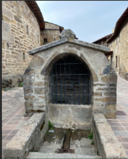
Fuente de Triviño

RUTA DE LA PEÑA DEL CASTRO. En la parte más alta del núcleo rural, se encuentra una gran fuente y una zona de descanso y recreo con castaños. Desde este punto comienza la ruta. Desde la Fuente, a la izquierda, atravesamos un tramo de unos doscientos metros, paralelos a la carretera, hasta un pinar, que bordeamos. Atravesamos un castañar hasta desembocar en un cortafuegos. Debemos tomar el mismo, a la derecha, en suave pendiente. Caminamos por él durante más o menos veinte minutos (aproximadamente 1 kilómetro de distancia) hasta un hito de piedras en el borde, entre el cortafuegos y el brezal, a la izquierda. Este es el punto más problemático del recorrido y debemos prestar mucha atención. Desde este punto se inicia un moderado ascenso por el tupido brezal hasta el cortafuegos superior, a través de un estrecho sendero. Una vez en el cortafuegos, a la derecha, andamos unos doscientos metros hasta la cima: la Peña del Castro. Un montón de piedras de la antigua muralla que rodeaba el enclave nos indica que hemos llegado.