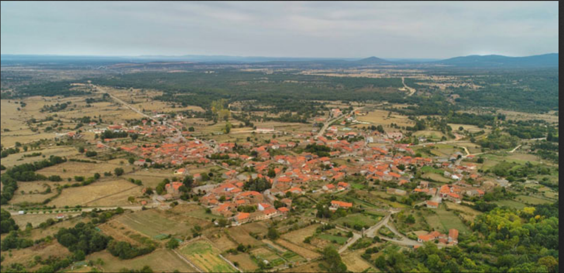
Villardeciervos a vista de drone

El núcleo está declarado Bien de Interés Cultural en la categoría de Conjunto Histórico, por constituir un bello ejemplo de la arquitectura rural de La Carballeda. Construcciones de piedra de sillería, cerramientos en maderas nobles y tejados en la anaranjada teja tradicional.