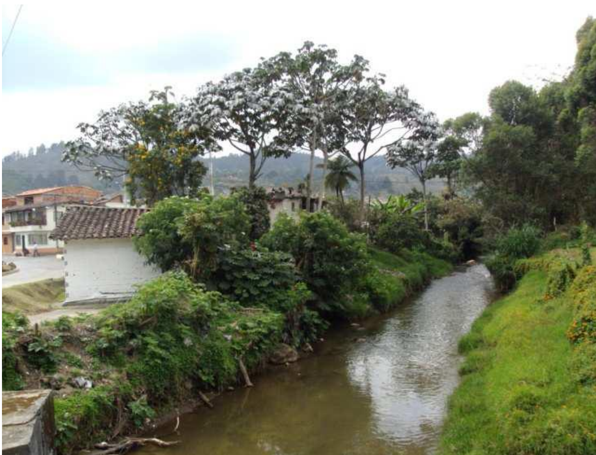
Figura 2. Amenaza por inundación en el barrio El Pino, quebrada La Agudelo, municipio de El Retiro, Antioquia, Tomada de la referencia anterior.

Quebrada La Agudelo y Rio Pantanillo en el municipio de El Retiro, Antioquia.