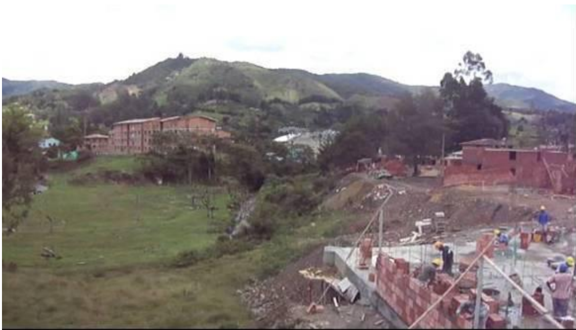
Figura 1. Confinamiento de la margen derecha del Río Pantanillo, en el municipio de El Retiro, Antioquia.

El municipio de El Retiro se encuentra ubicado al Sur Oriente del Departamento de Antioquia en una depresión de la Cordillera Central de los Andes, particularmente en el Altiplano del Oriente Antioqueño, también denominado Valles de San Nicolás al cual corresponden otros ocho municipios. La cabecera municipal se encuentra determinada por las coordenadas geográficas 6°03'36" de Latitud Norte y 75°24'19" de Longitud Oeste, con relación al meridiano de Greenwich, y las coordenadas planas X1:832.000 X2:848.000 y Y1: 1.151.000 Y2:1.174.000 con respecto al centro de Bogotá. Sus límites geográficos son: al Norte con los municipios de Envigado y Rionegro, al Este con los municipios de Rionegro y La Ceja, al Sur con La Ceja y Montebello, al Oeste con Caldas y Envigado.