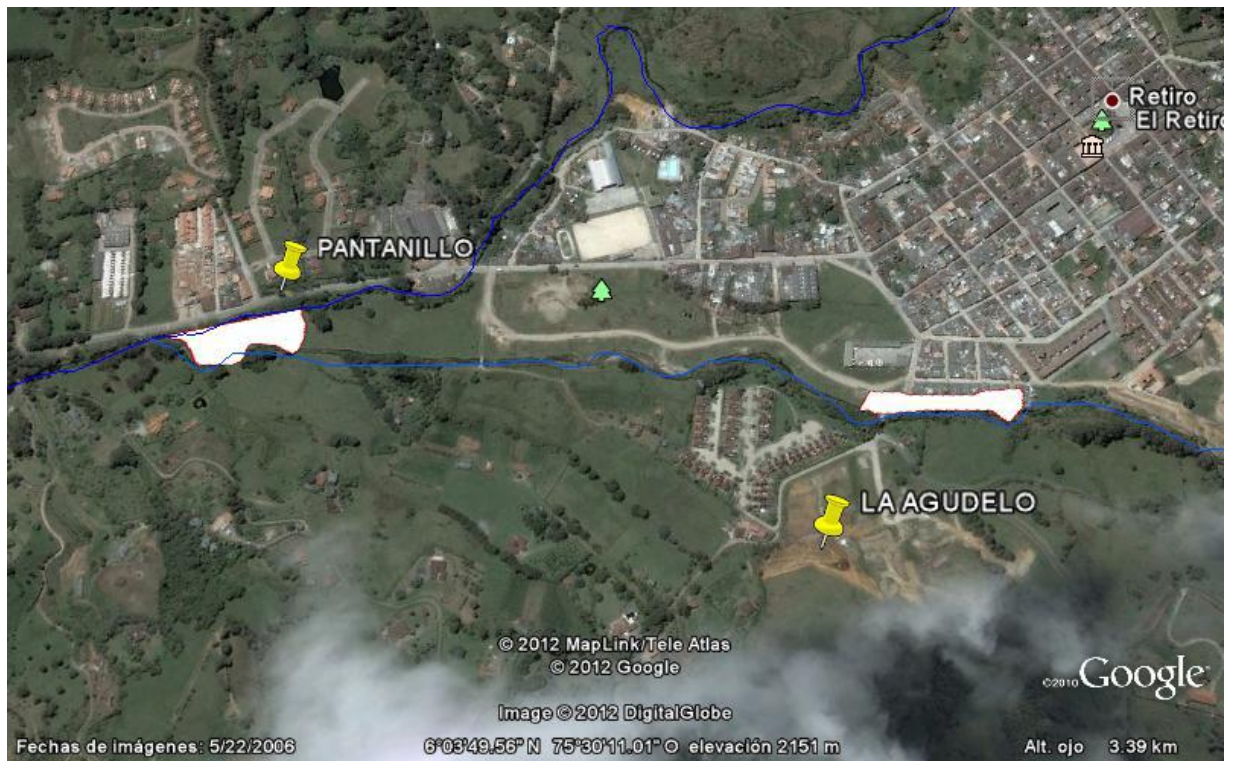
Figura 3. Zonas susceptibles a inundación lenta por La quebrada La Agudelo.