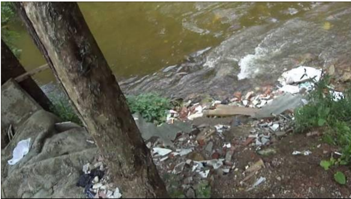
Figura 7. Botadero de escombros en la quebrada La Agudelo ubicado en la esquina con cruce de la quebrada con la Carrera 23 A.