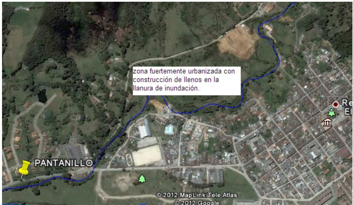
Figura 4. Zona con invasiones de la llanura de inundación por urbanizadores, (planta de fig.1).

el retiro planteado en el plan de ordenamiento. Los llenos se realizan, una vez cumplido el retiro obligatorio, este confinamiento crece aun más durante la construcción debido a que el material proveniente de la excavación se deposita sobre el terraplén marcado por las condiciones de retiro. Ver figura 1.