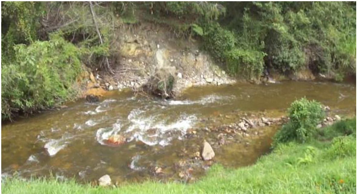
Figura 6. Erosión de márgenes laterales en el recorrido urbano de la quebrada La Agudelo en el municipio de El Retiro.