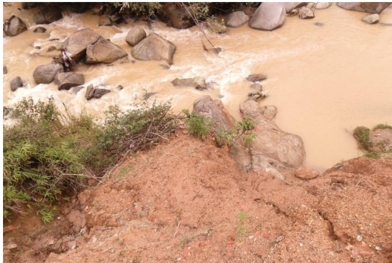
2. Material depositado en el Río San Matías