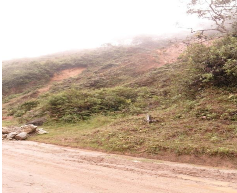
1. Deslizamiento en el talud de corte de la vía