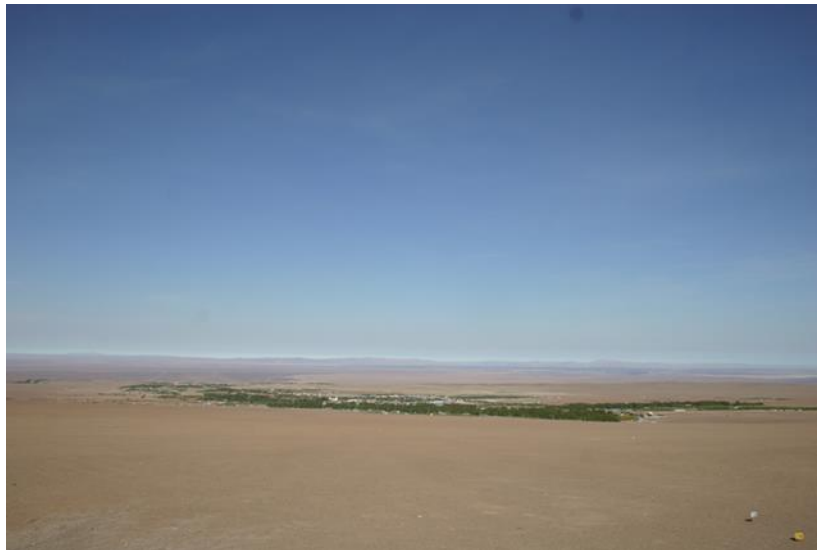
Fotografía 1: Pica desde el sector del Mirador