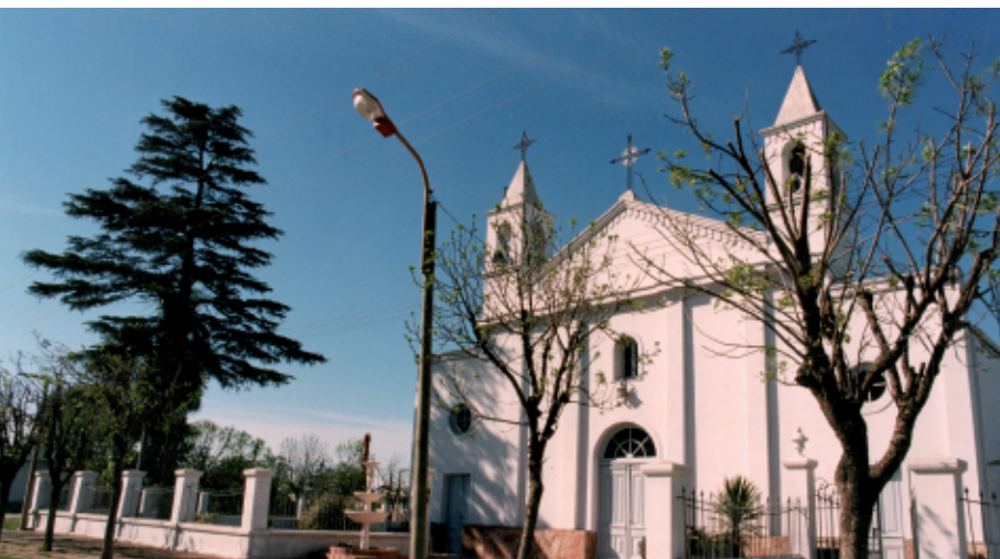
Parroquia San José

Sobre los habitantes informa el padre Luis Brizio, entre otras cosas: "En aquellos tiempos heroicos, hombres y mujeres, alimentándose con verduras y mate, y raras veces con carne de gallina, iban todo el día, y no pocas veces buena parte de la noche, caminando tras la reja del arado"