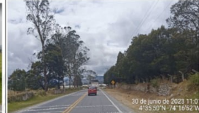
PR4+920 AL PR4+990 SECTOR RAMAL A SOACHA: SE EVIDENCIA LAS VANDAS ALERTADORAS