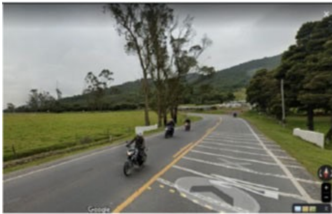
PR4+800 AL PR4+850 SECTOR RAMAL A SOACHA: SE EVIDENCIA LAS SEÑALES VERTICALES SP-75 DELINEADORES DE CURVA Y DE ACCESO AL PARQUE CHICAQUE.

A través de contrato de concesión 01 de 1996, el concesionario DEVISAB S.A.S ha venido ejecutando acciones puntuales de reforzamiento señalización vertical y horizontal, así como de control en el sector de acceso al Parque Natural Chicaque k4+800, lo anterior con el objetivo de reducir la velocidad de operación, factor el cual es la principal causa de accidentalidad. Se realizó la construcción de bandas alertadoras en concreto y bandas reductoras en estoperoles, antes del inicio de la curva en sentido Soacha Mondoñedo y Mondoñedo Soacha, tal como se ilustra en la siguientes imágenes.