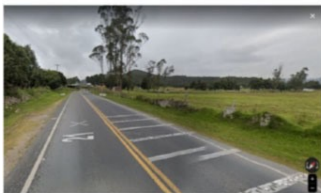
PR4+800 AL PR4+850 SECTOR RAMAL A SOACHA: SE EVIDENCIA LAS SEÑALES VERTICALES SP-75 BANDAS ALERTADORAS