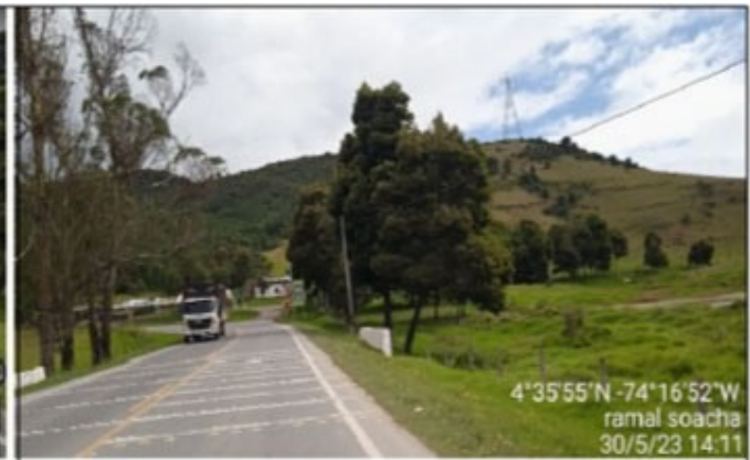
PR4+660 AL PR4+750 SECTOR RAMAL A SOACHA: SE EVIDENCIA LAS VANDAS ALERTADORAS.