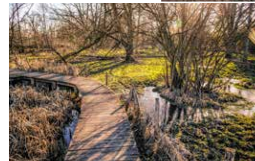
Het 'kwelwater', of grondwater dat naar de oppervlakte komt, veranderde de Broekbeemd in een vochtig moeras.