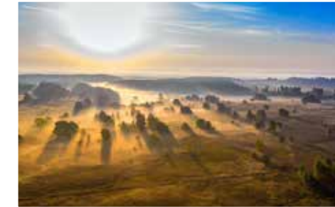
In augustus en september staat de heide in bloei, maar ook in de andere maanden is de Mechelse Heide adembenemend mooi.