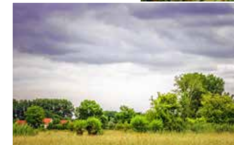
Het beschermde natuurgebied Schulensbroek, waar het gakken van ganzen alomtegenwoordig is.