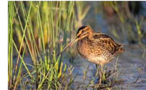
De vallei van de Zwarte Beek staat steeds garant voor ongerepte natuurpracht. En met wat geluk spot je tussen de weilanden een watersnip.