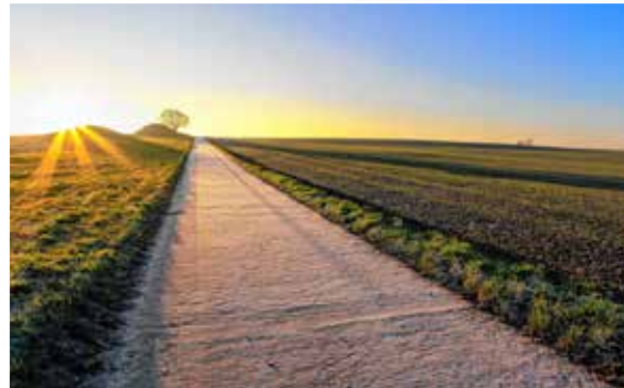
Een heldere hemel, weidse akkers, en dan plots twee Romeinse grafheuvels.