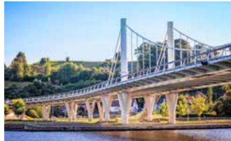
Natuur en vooral stiltte vormen de rode draad doorheen de wandeling.