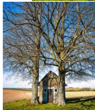
De wandeling biedt een ongebreideld uitzicht over de velden.