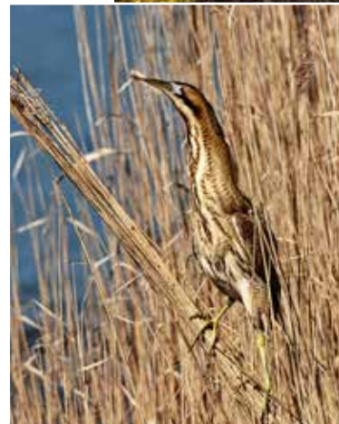
In dit lappendeken van vijvers is het speuren naar de roerdomp. Al zit die vaak perfect gecamoufleerd tussen de rietstengels.