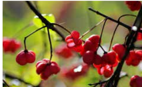
De tocht langs bossen en weilanden eindigt in beschermd gebied, waar je even vergeet dat je in Hasselt zit.