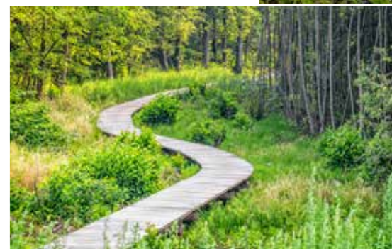
Genieten van het zicht op de hoogste terril van Waterschei of van de aparte fauna en flora.