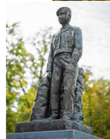
Tijdens je tocht door Leopoldsburg via de Leopold I-route wordt de geschiedenis van Het Kamp tastbaar.