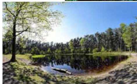
Den Tus is een ven gevuld met zuur regenwater.

Wie Gerheserheide zegt, zegt ook Den Tus. Het is een prachtig natuurlijk ven of een waterplas. En dat midden in het bos met een uitzonderlijke fauna en flora tot gevolg. Den Tus is een mooie extra attractie tijdens een rustige tocht doorheen het groen.