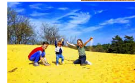
Het klimwerk wordt beloofd met een prachtig uitzicht.