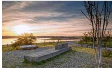
Even stoppen in Herbricht, en genieten van het uitzicht over de machtige Maas.