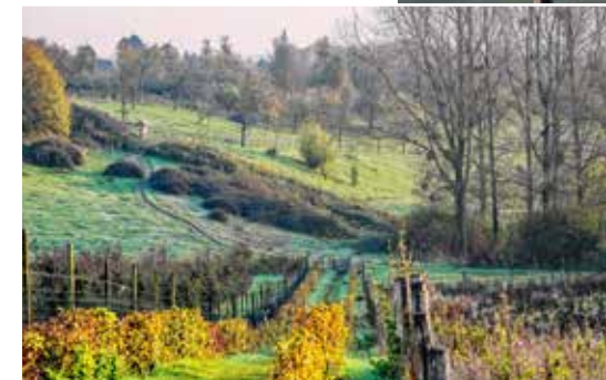
Op de Bollenberg, het hoogste punt in Borgloon, word je getraakteerd op weidse uitzichten.