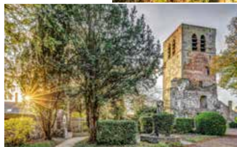
De omgeving van de Oude Maas geniet Europese bescherming.