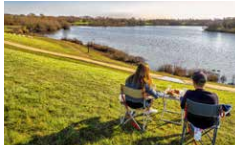
Genieten van prachtige uitzichten.