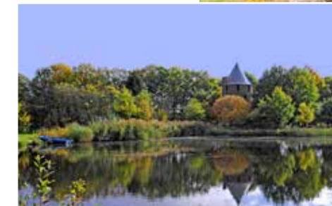
Op je tocht langs de Warmbeek passeer je stukjes Achelse geschiedenis, zoals Den Tomp en de Achelse Kluis.