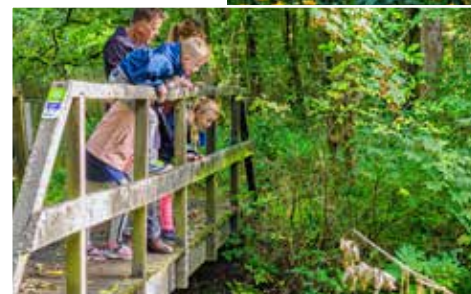
In de natte vallei van de Bollisserbeek kan je unieke fauna en flora spotten.