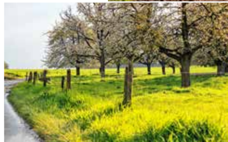
De wandelroute in Heks voert je langs akkers, hoogstamboomgaarden en de spoorwegbedding van de 'zwarte tram'.