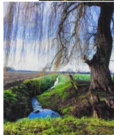
De tocht voert je niet alleen langs akkers en fruitplantages, ook een waterburcht en enkele historische hoeses liggen op de weg.