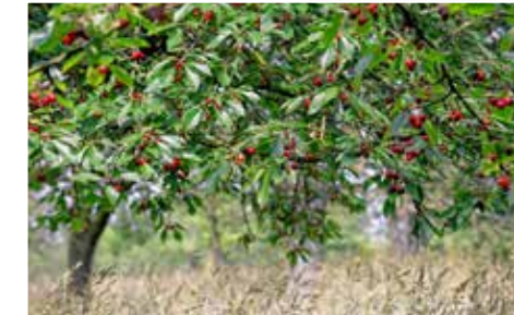
Heerlijk genieten van lekkere kersen die je vanaf het wandelpad kan plukken.