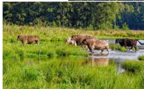
Taoussen in Bocholt. Op je passage langs de Abeek kan je deze oerrunderen bewonderen tijdens hun middagdutje.