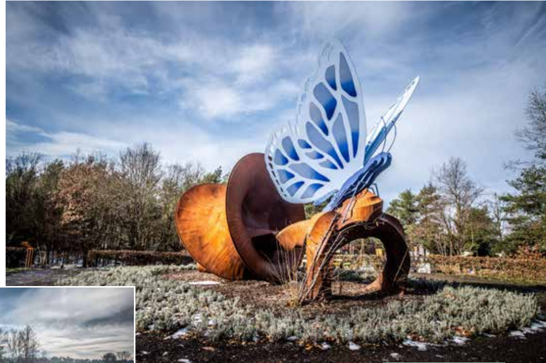
Kunstwerken, vers geurende dennenbossen en heide: variatie troef in het Kattenbos.