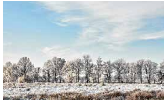
In volle bloei of onder een witte sneeuwlaag: het Stramprooierbroek, een van de stilste plekje in Limburg, is steeds betoverend mooi.