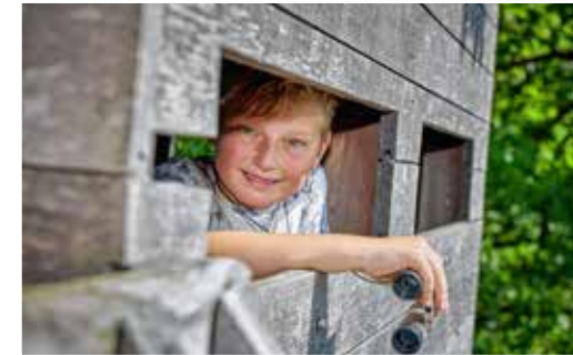
De Resterheide is de ideale plek om verschillende watervogels te spotten, zoals de aalscholver en de blauwe reiger.