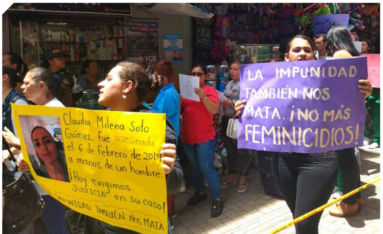
Memoria femenina - Facebook

"Lo que hicimos fue que a la Mesa de Erradicación