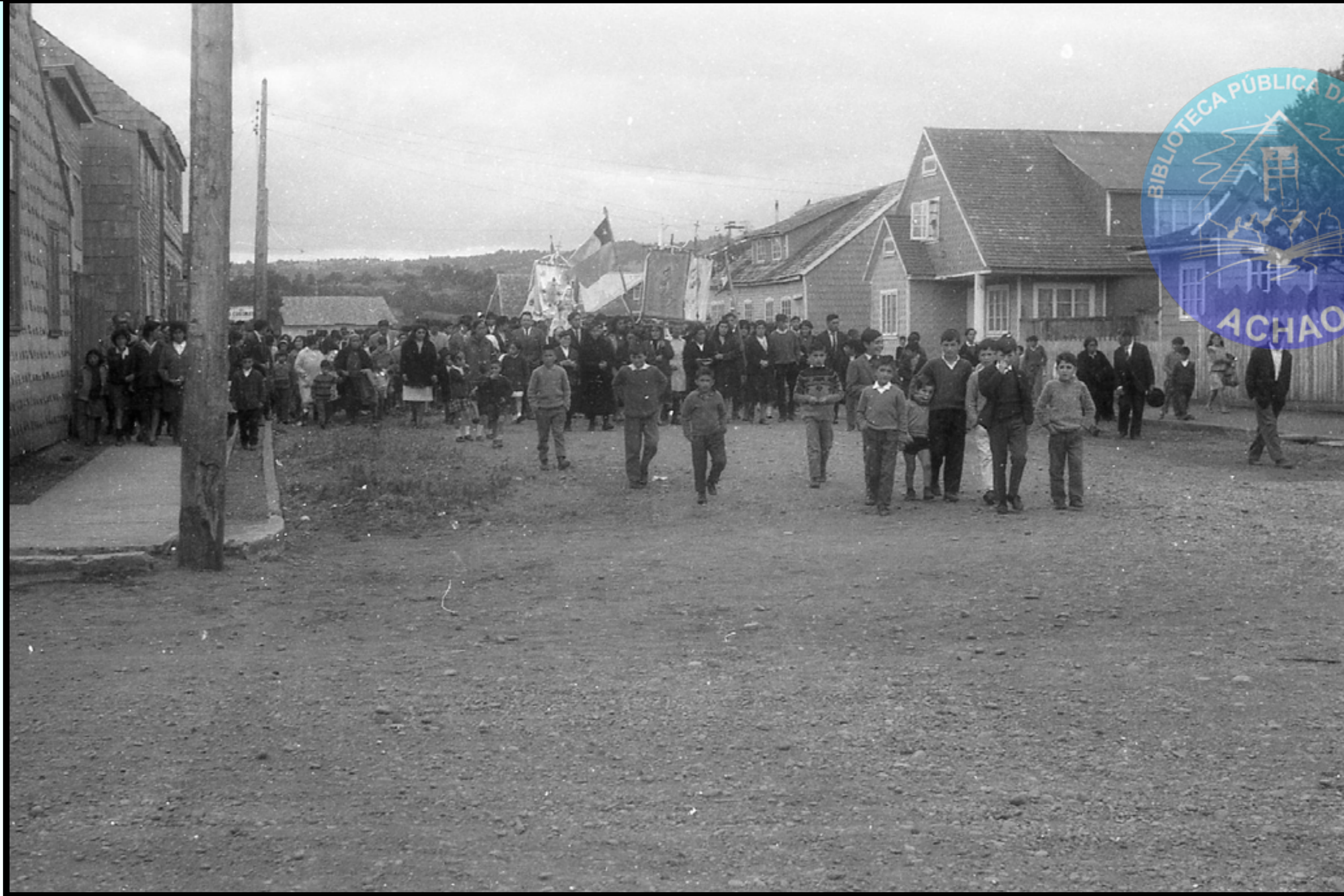
PROCESIÓN CON BANDERA CHILENA Y ARCOS TRIUNFALES ACOMPAÑADOS POR NIÑOS QUE POSAN PARA LA POSTERIDAD EN SUS RECORRIDOS POR LA CALLE CENTRICA MIRANDA VELASQUEZ.