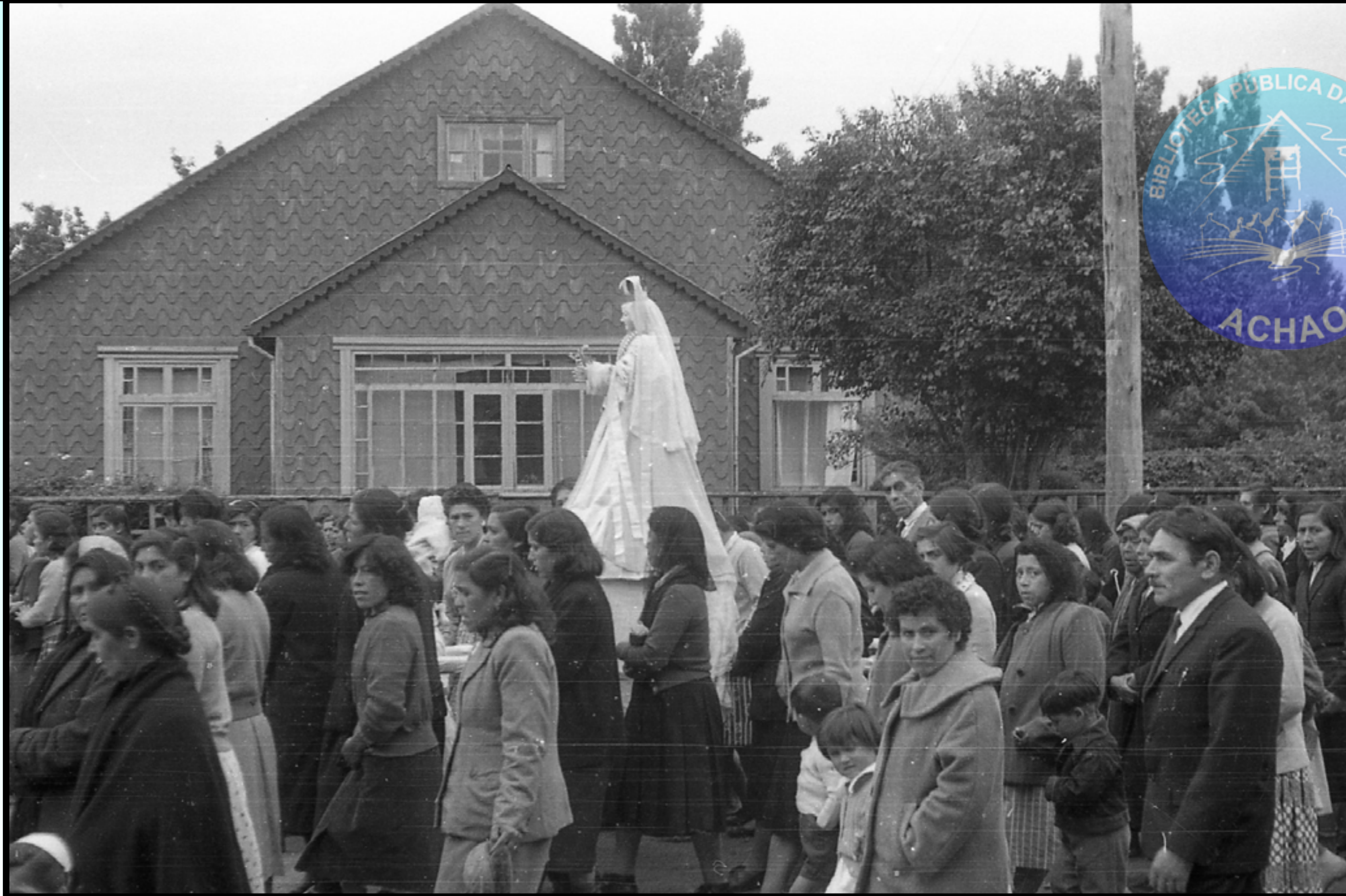
NUESTRA SRA. DE GRACIA ES ACOMPAÑADA POR UNA MULTITUD DEVOTOS EL DIA 1° ENERO 1965.