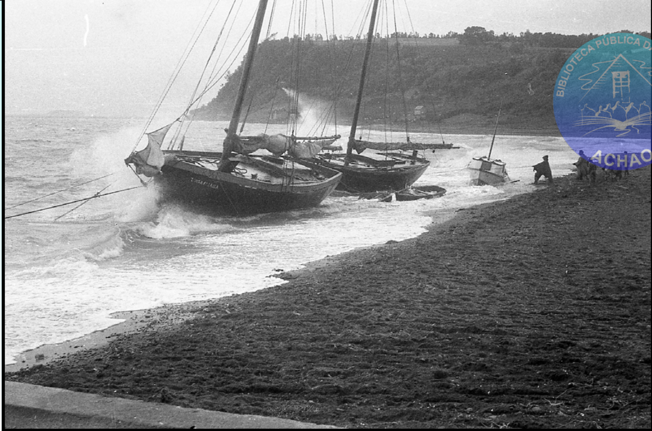
LOS GRANDES TEMPORALES DEL INVIERNO ACHAINO A MEDIADOS DE LOS 60 ARRASTRABAN MUCHAS VECES LOS CHALUPONES A VELA EN LA PLAYA DE ACHAO.