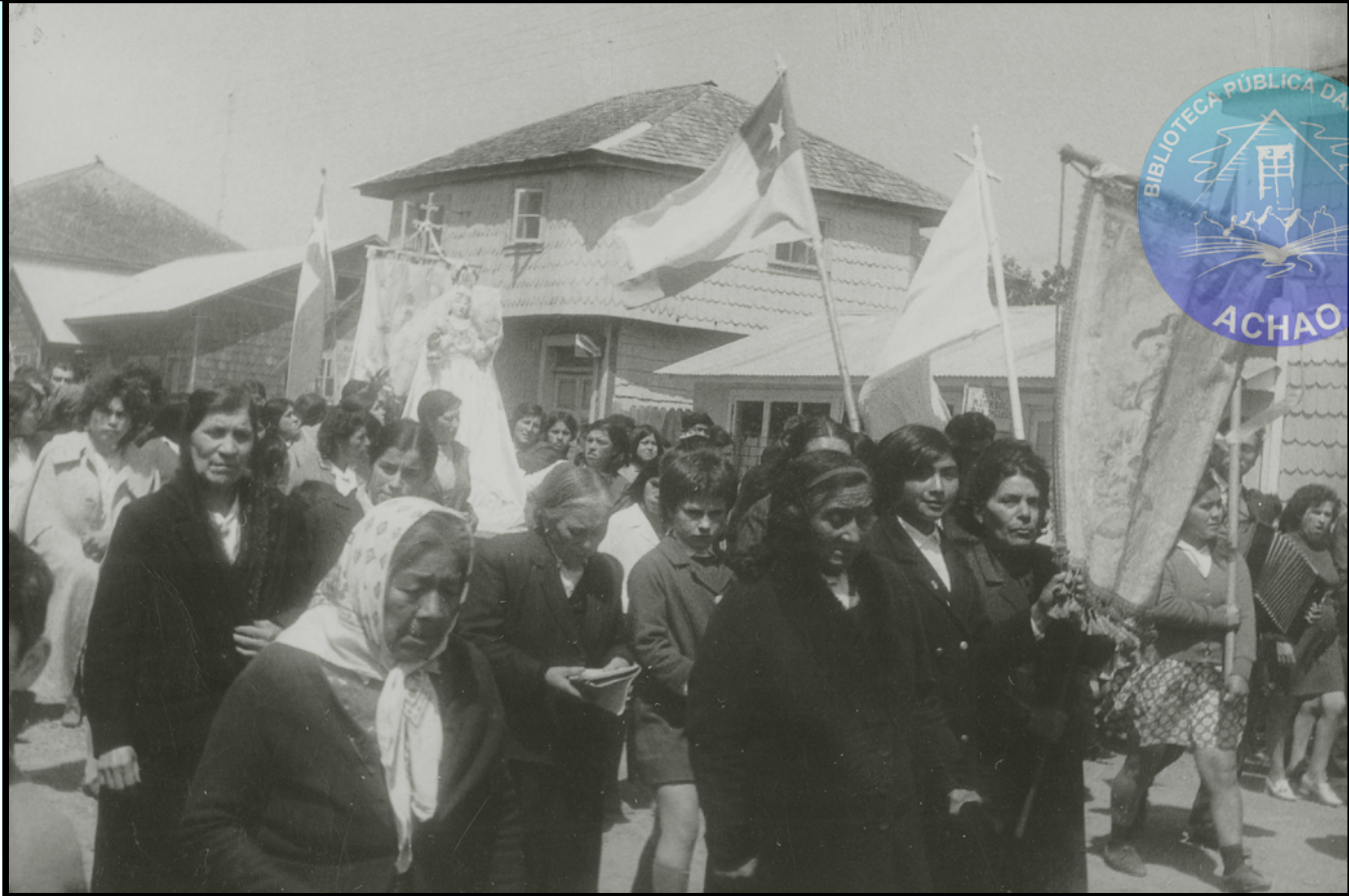
PROCESIÓN DEL 1° ENERO 1967 RECORRIENDO LA CALLE SERRANO DE ACHAO CON SUS ESTANDARTES Y BANDERAS.