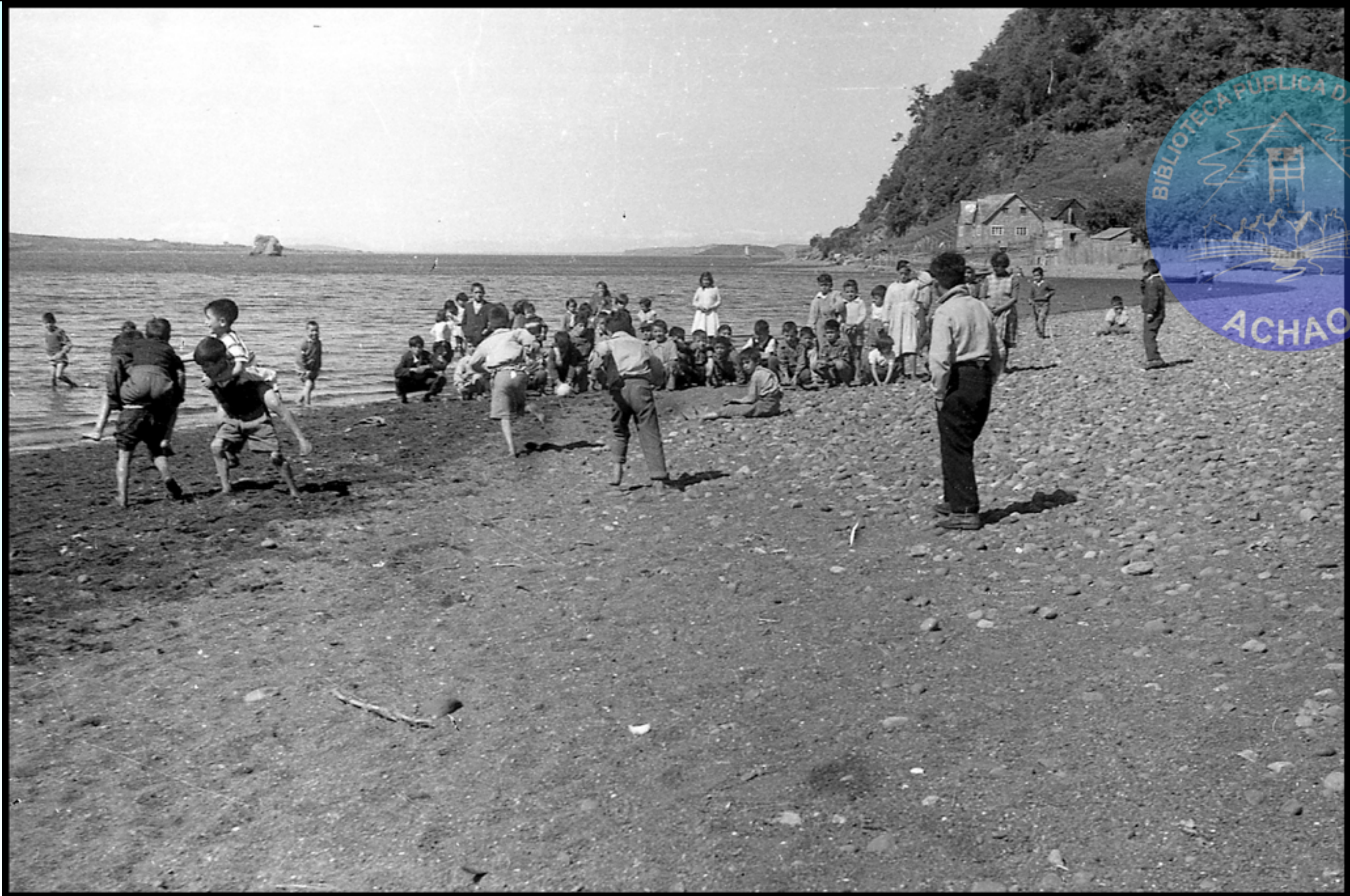
VERANO DE MEDIADOS DE LOS 60 NIÑOS CON SUS PADRES DISFRUTANDO DE UN DIA DE PLAYA FRENTE A LA ISLA CHEQUETEN Y PIEDRA DE ACHAO.