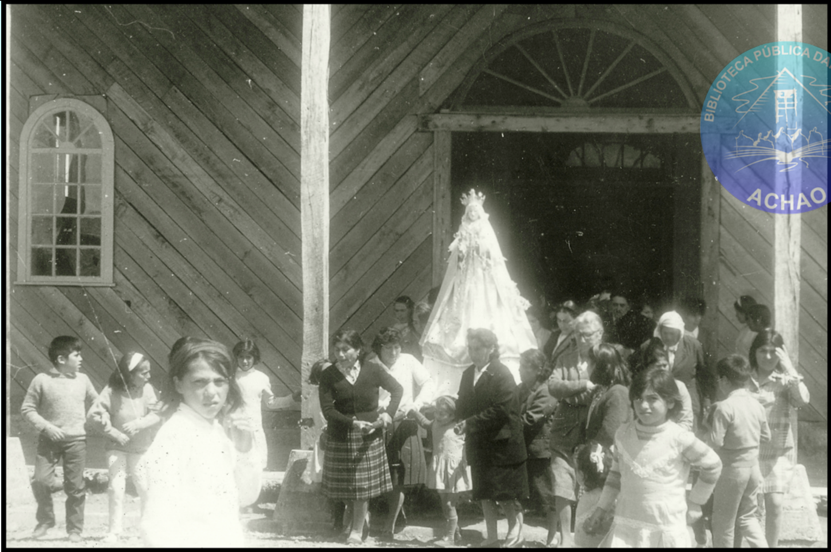
LAS IMÁGENES DE LAS VIRGENES DE QUINCHAO Y MATAO ES SACADA EN ANDAS DEL INTERIOR DE LA IGLESIA SANTA MARIA DE LORETO DE ACHAO , EPOCA DE RESTAURACIÓN DE LA IGLESIA 1° ENERO 1967.