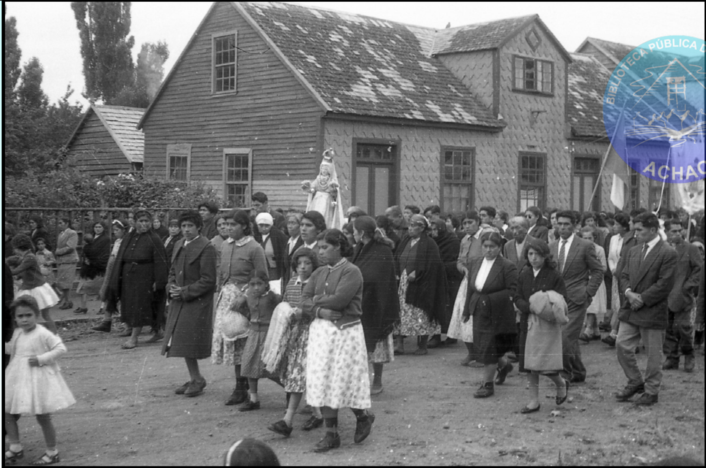
LA PROCESIÓN DE LAS VIRGENES RECORRIENDO EL CENTRO DE ACHAO EN SU PASO POR CALLE DELICIAS 1° ENERO 1965.