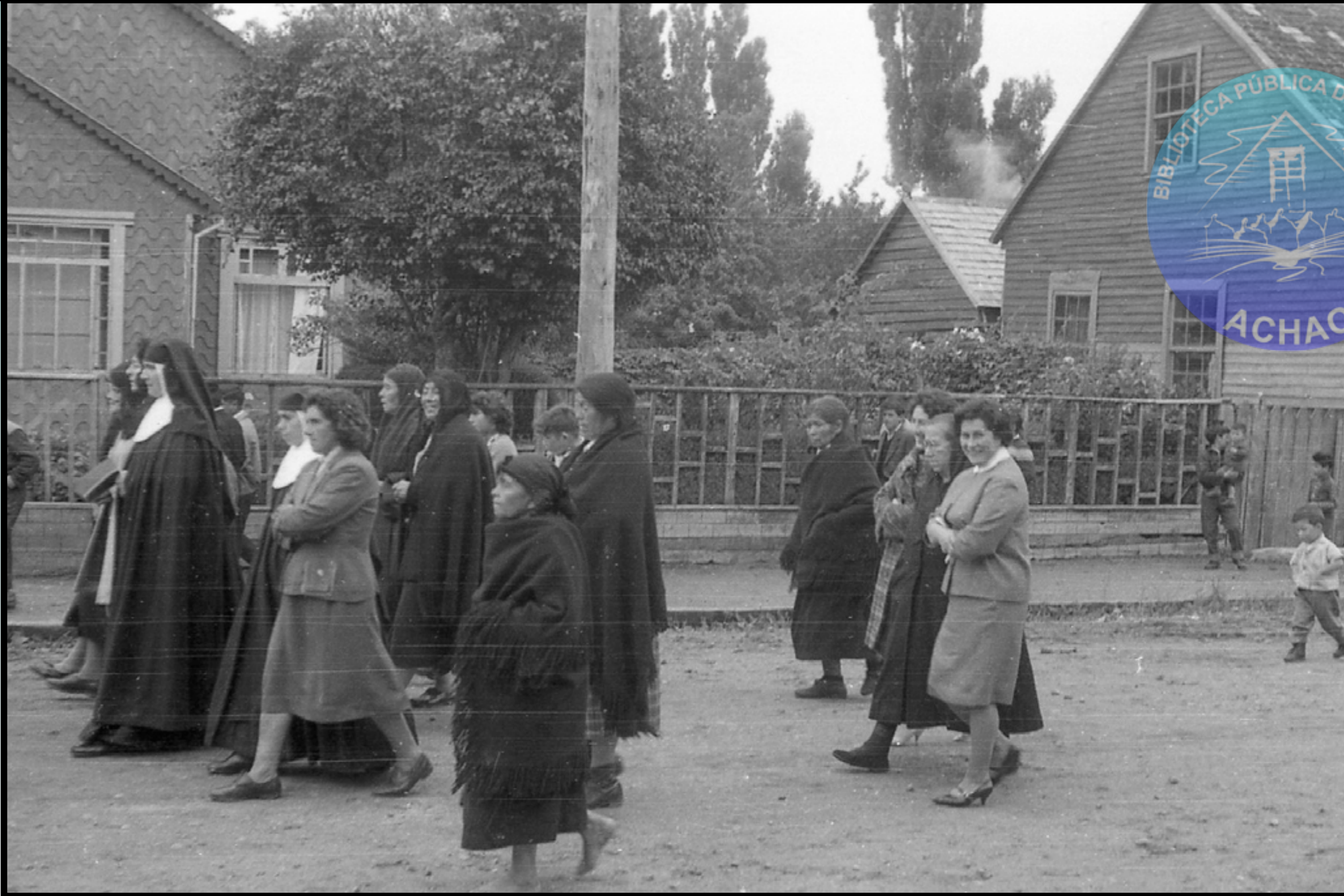
RELIGIOSAS FILIPENSES Y VECINAS DE LOS SECTORES RURALES Y URBANO AVANZAN EN EL COMPAS DE LAS VIRGENES POR LA CALLE DELICIAS DE ACHAO 1° ENERO 1965.