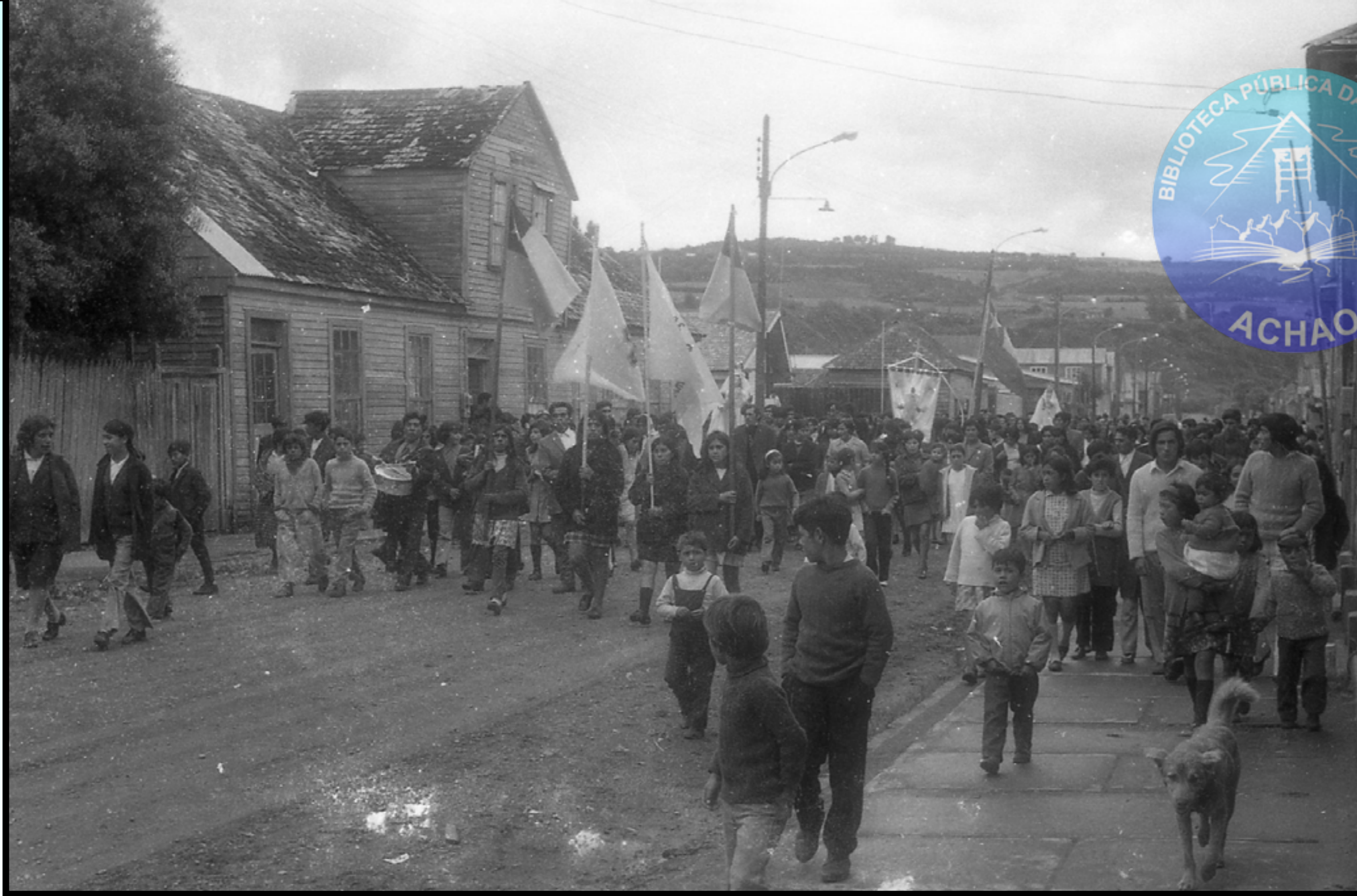
UNA MULTITUDINARIA MUESTRA DE FE Y DEVOCIÓN EN LA CALLE DELICIAS 1° ENERO 1968.