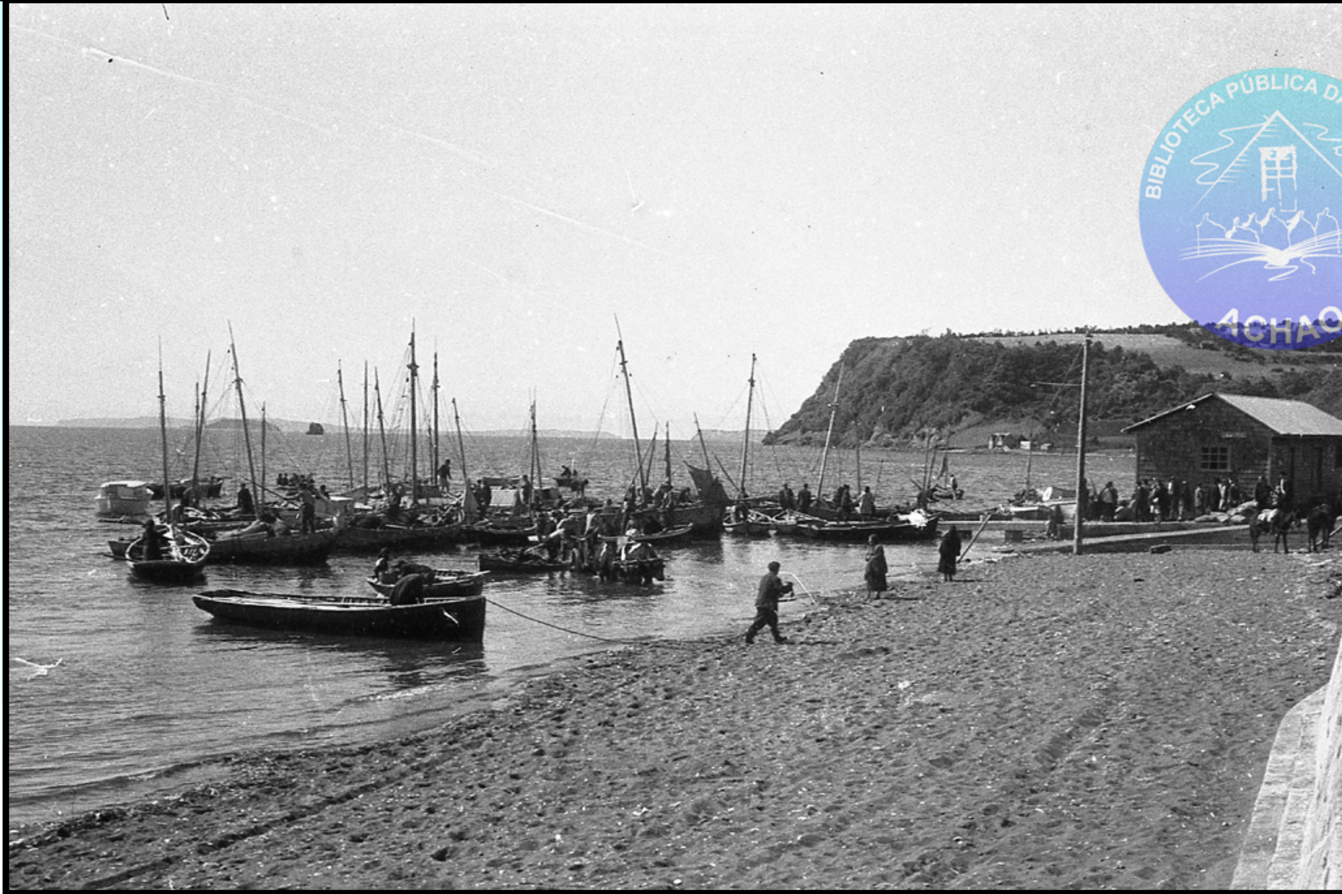
TESTIMONIO DEL PUERTO DE ACHAO CON SUS LANCHAS VELERAS A MEDIADOS DE LOS AÑOS 60.