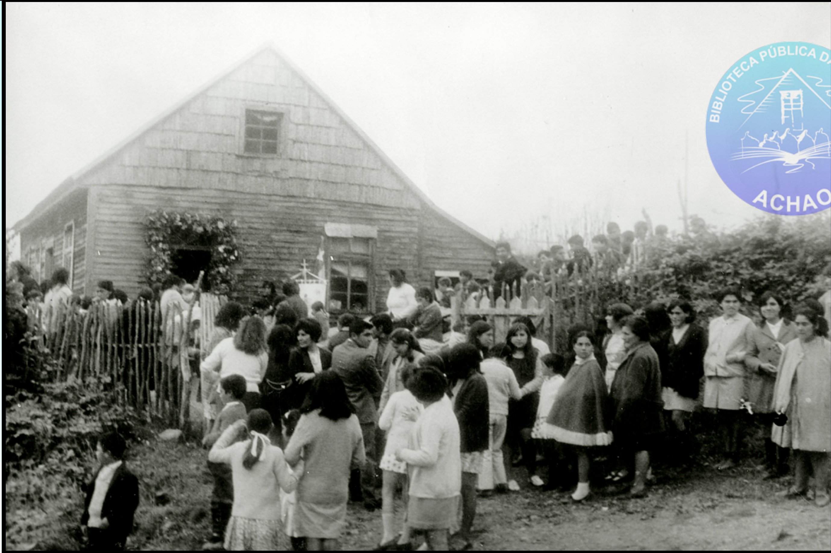
MOMENTO EN QUE SE HACE UN DESCANSO EN LA PROCESIÓN PARA PROCEDER AL CAMBIO DE VESTIMENTA DE LAS IMÁGENES 1° ENERO 1967.