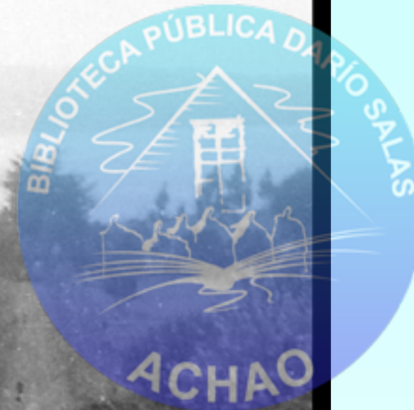
LA PROCESIÓN DE LAS MARCHAS DE LAS VIRGENES DEL 1° ENERO 1968 SIGUE SU RUTA DE REGRESO DE QUINCHAO Y MATAO AVANZANDO POR EL SECTOR DE PUTIQUE.