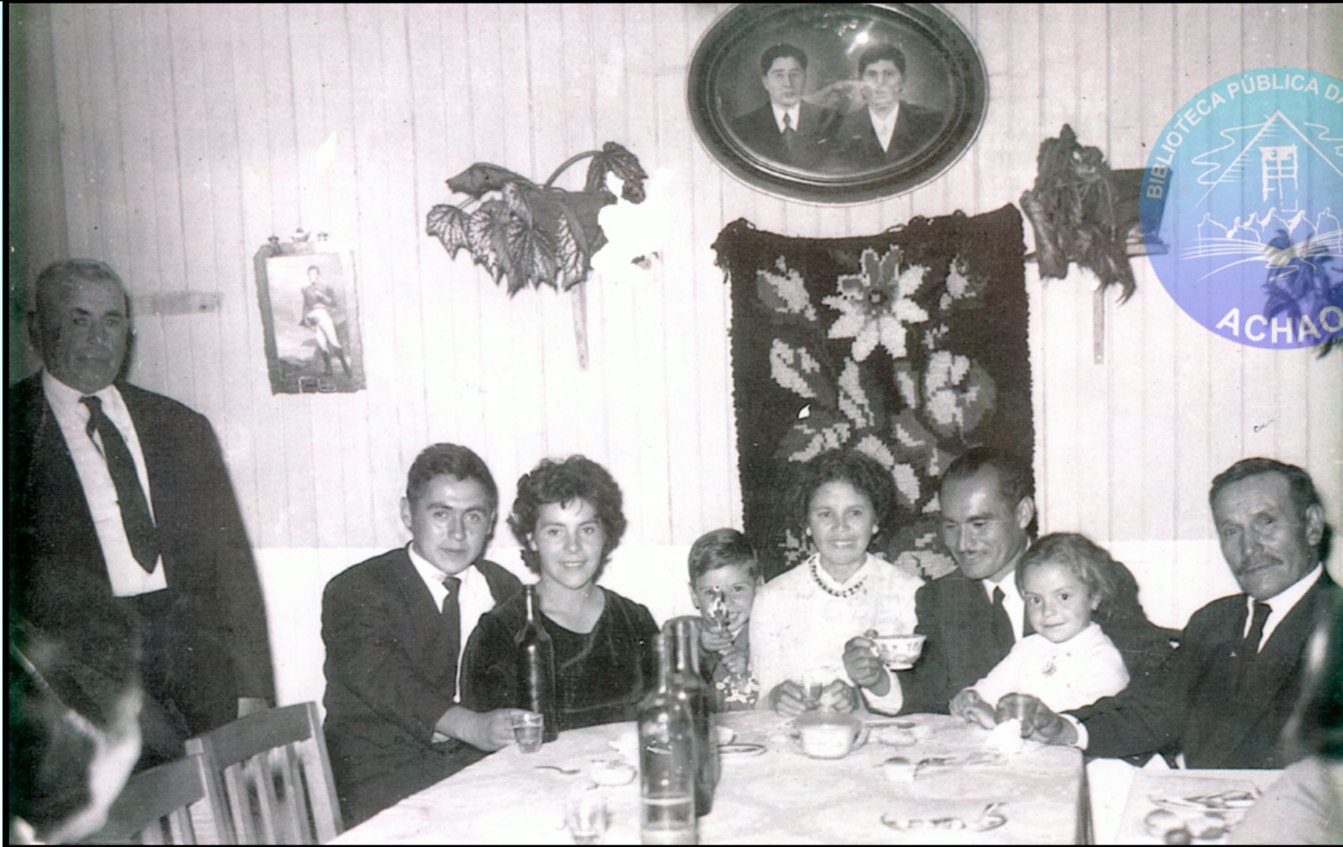
FAMILIA AGUILAR DIAZ MEDIADOS DE LA DECADA DE LOS 60.