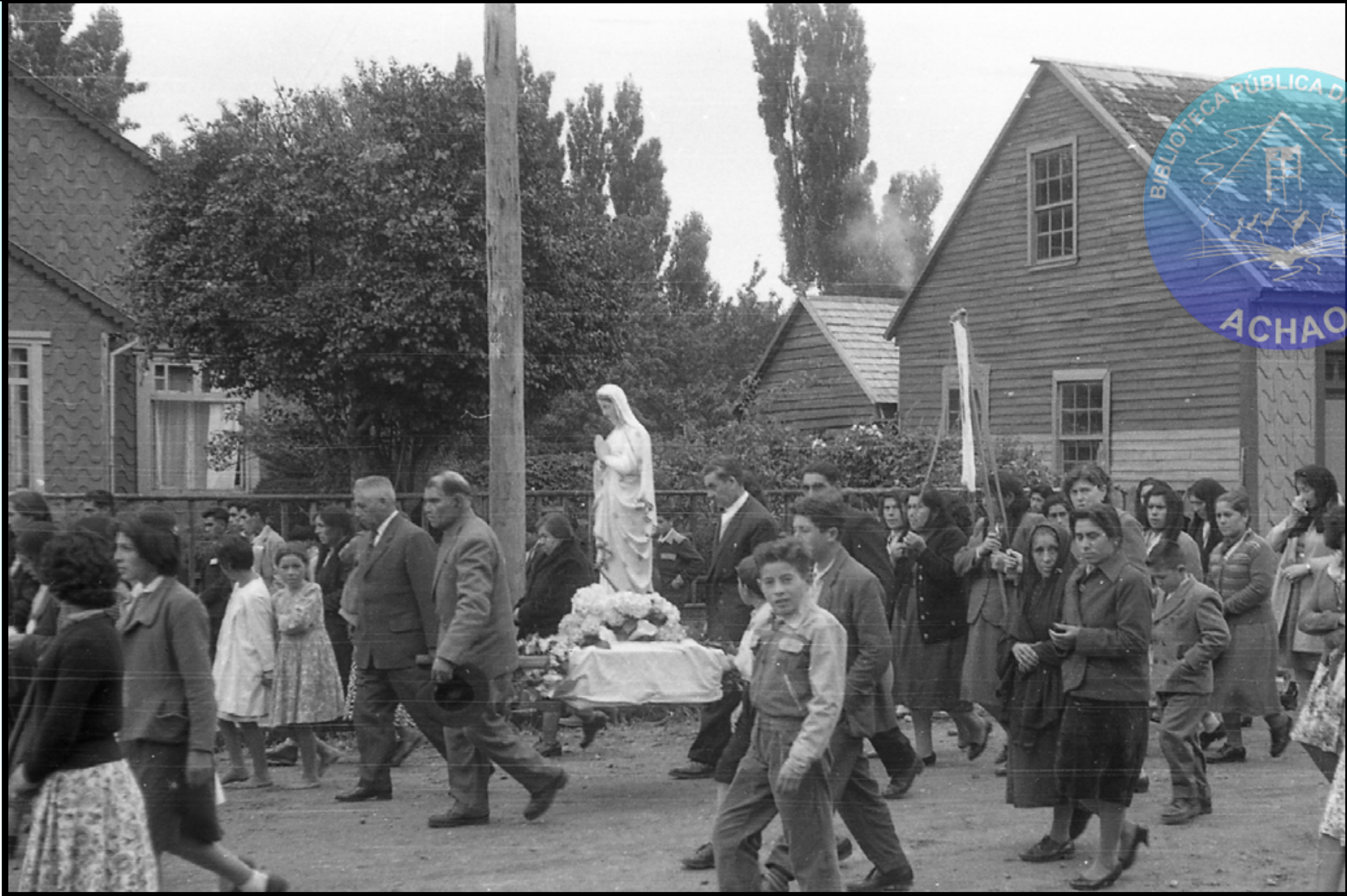
IMAGEN RELIGIOSA QUE ES TRANSPORTADA POR ANTIGUOS VECINOS DE ACHAO Y FELIGRESES POR EL CENTRO DE LA CIUDAD AÑO 1965.