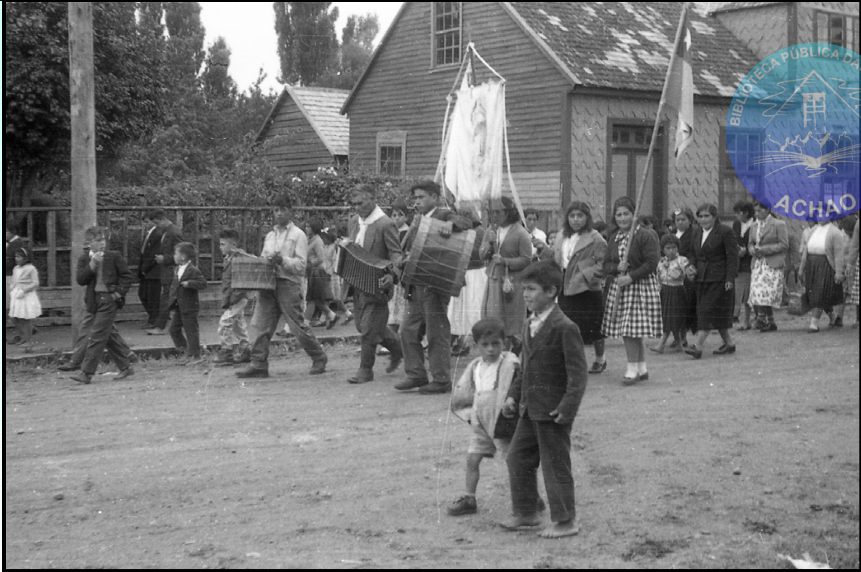
BANDA DE MUSICOS ACAMPAÑADA POR ACORDIONISTA A BOTONES CON SUS RESPECTIVOS BOMBOS Y TAMBORES ACOMPAÑANDO EL RITMO DEL PASACALLE EN CALLE DELICIAS 1° ENERO 1965.