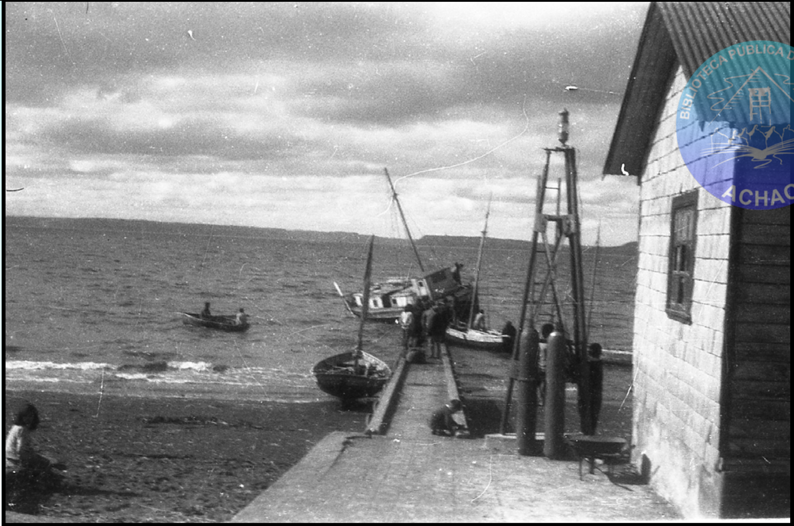
ANTIGUA RAMPA DE ACHAO JUNTO AL FARO QUE ILUMINABA LA LLEGADA DE EMBARCACIONES.