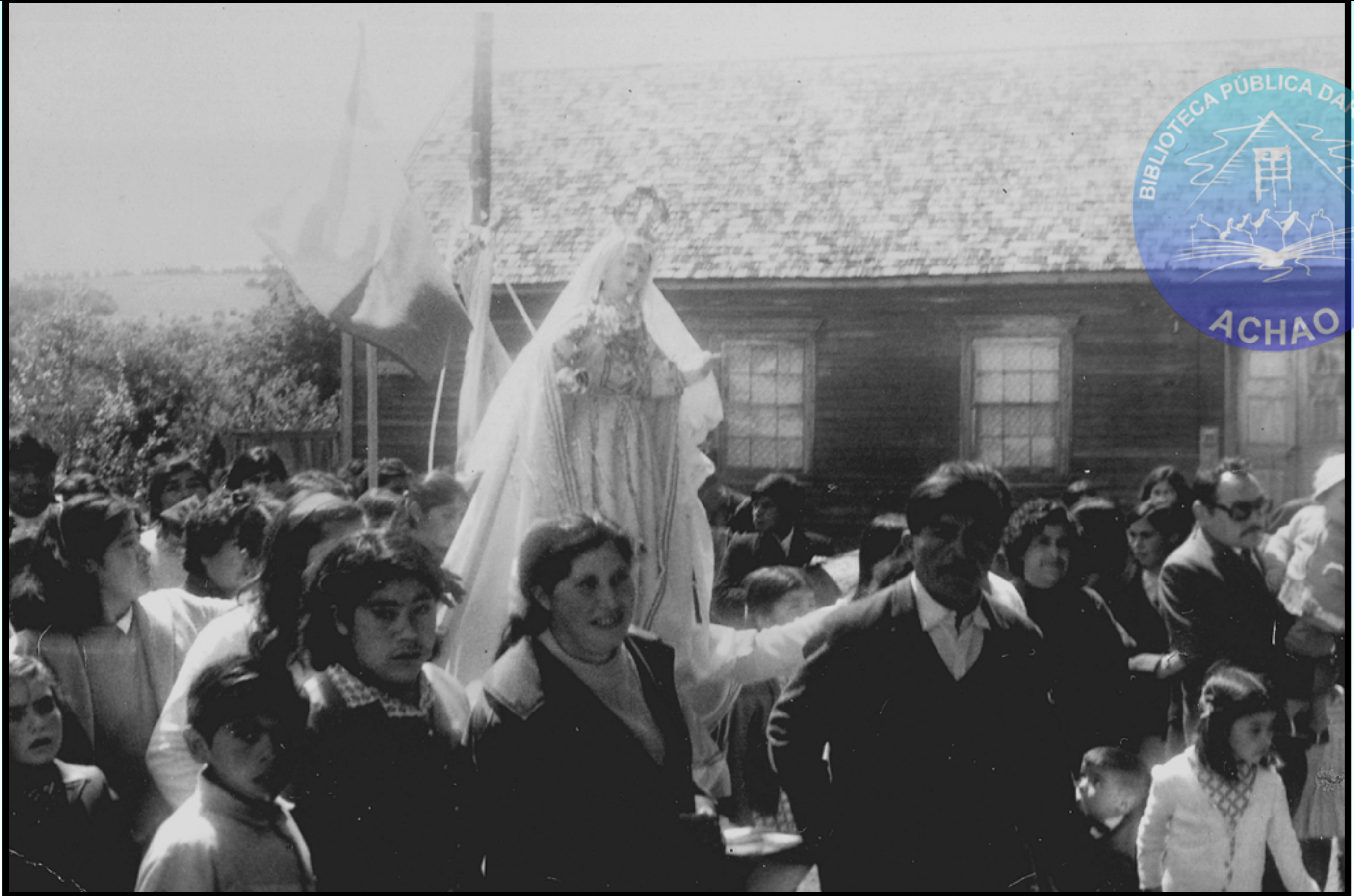
VIRGEN DE GRACIA DE QUINCHAO , INGRESANDO A LA IGLESIA SANTA MARIA DE LORETO DE ACHAO 1° ENERO 1967.