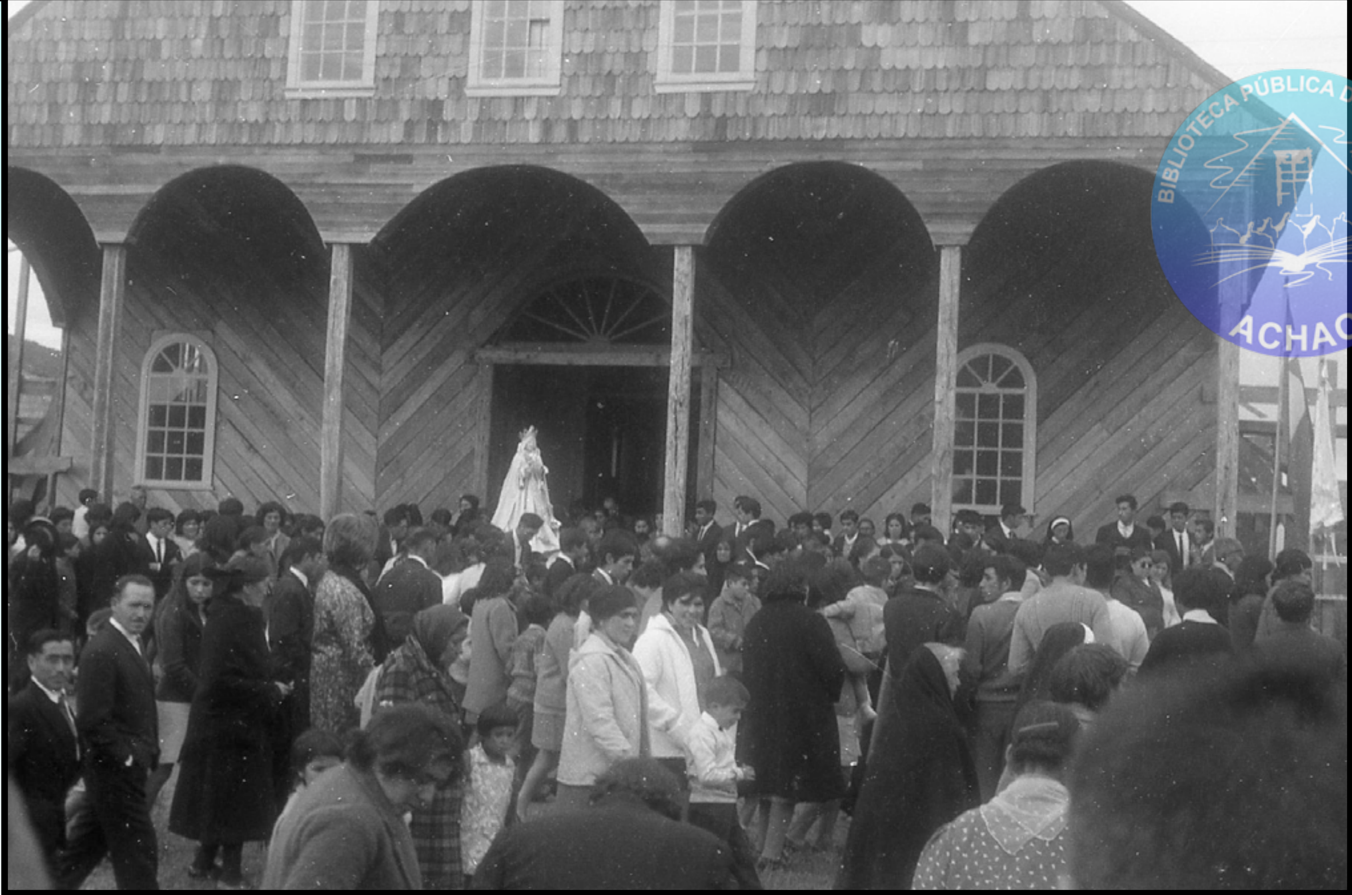
GRAN PROSECIÓN DE LAS VIRGENES 1° ENERO 1967.