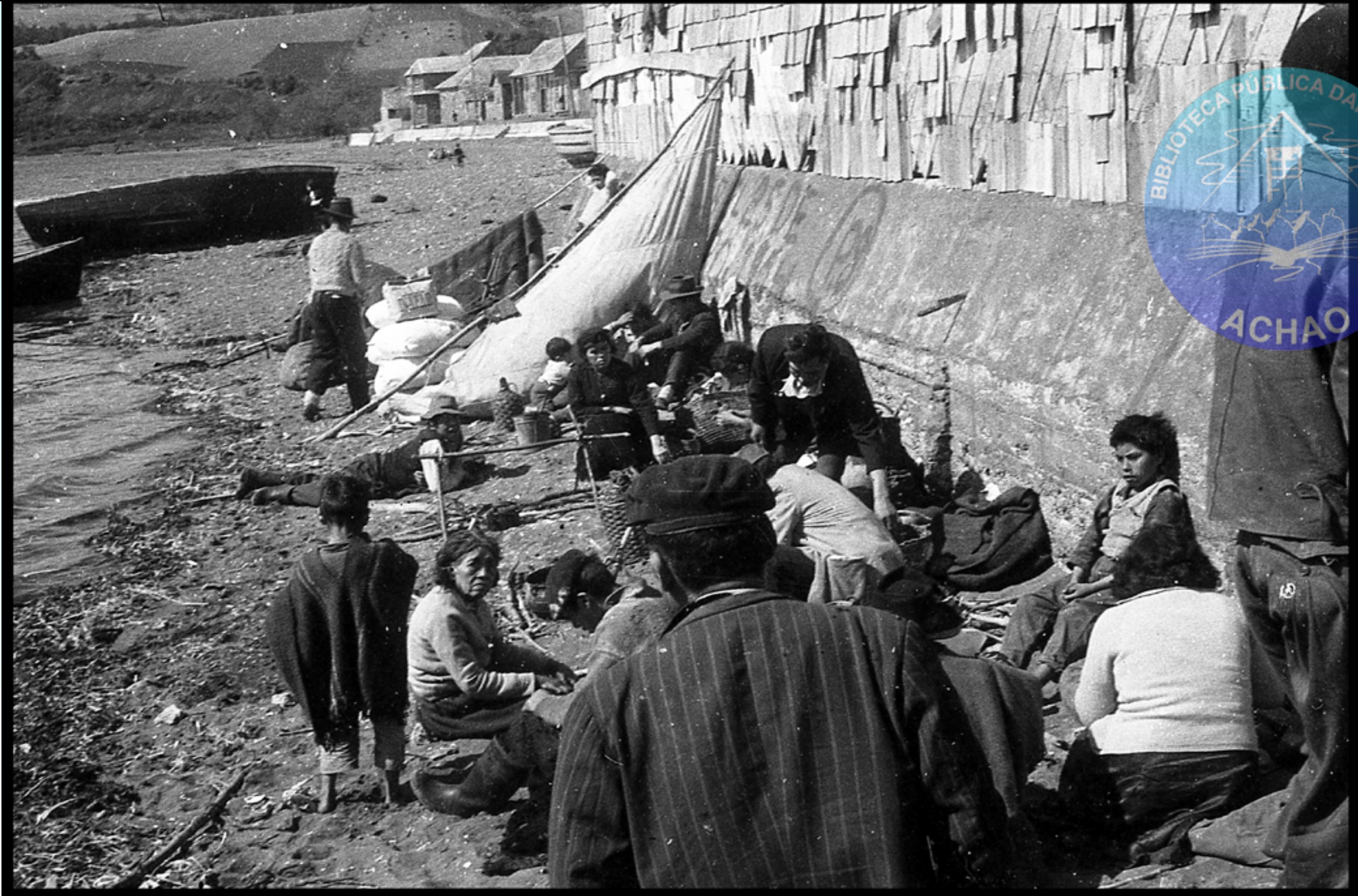
IMAGEN DE LOS NAVEGANTES DE LAS ISLAS POR CONDICIONES CLIMATICAS ADVERSAS DEBIÁN PERNOCTAR VARIOS DIAS EN COMPAÑÍA DE SUS FAMILIAS Y USABAN EL VELAMEN DE LOS CHALUPONES COMO TECHO DE ABRIGO.