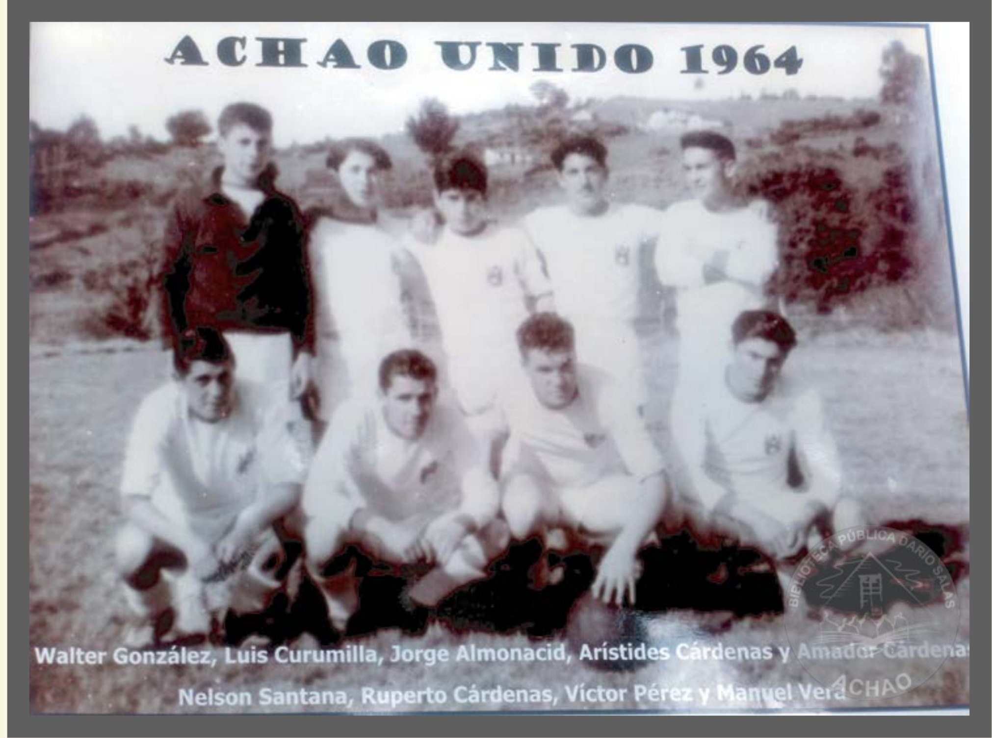
Club Deportivo Achao Unido - Glorias del Deporte local año 1964.