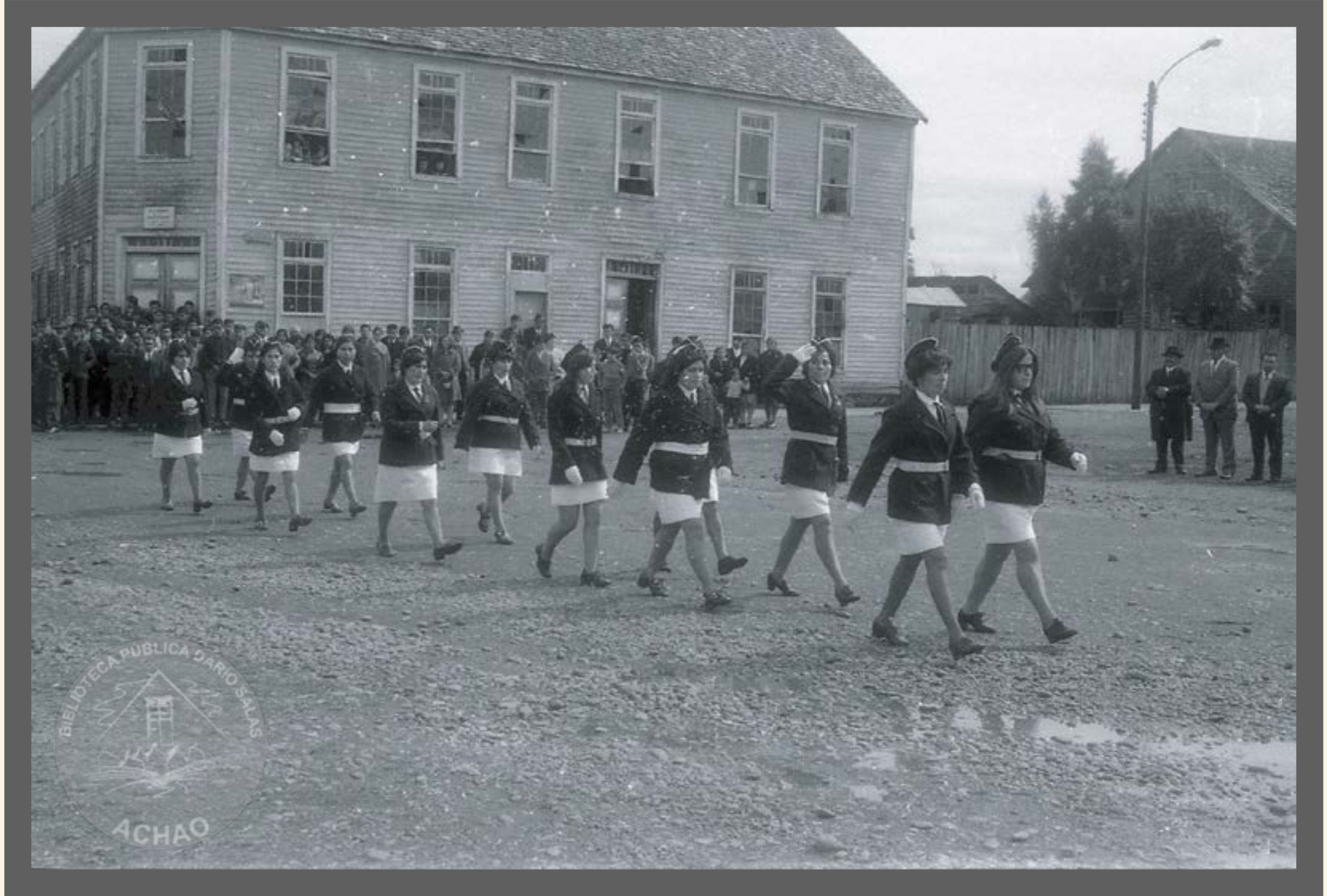
Voluntarias de la Tercera Compañía de Mujeres Cuerpo Bomberos de Achao , desfilan gallardamente año 1962.-