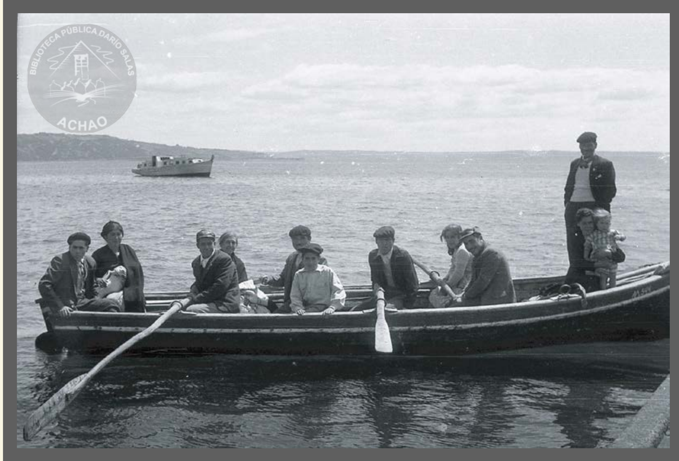
Retorno de los viajeros isleños a bordo de embarcación a remo año 1963.