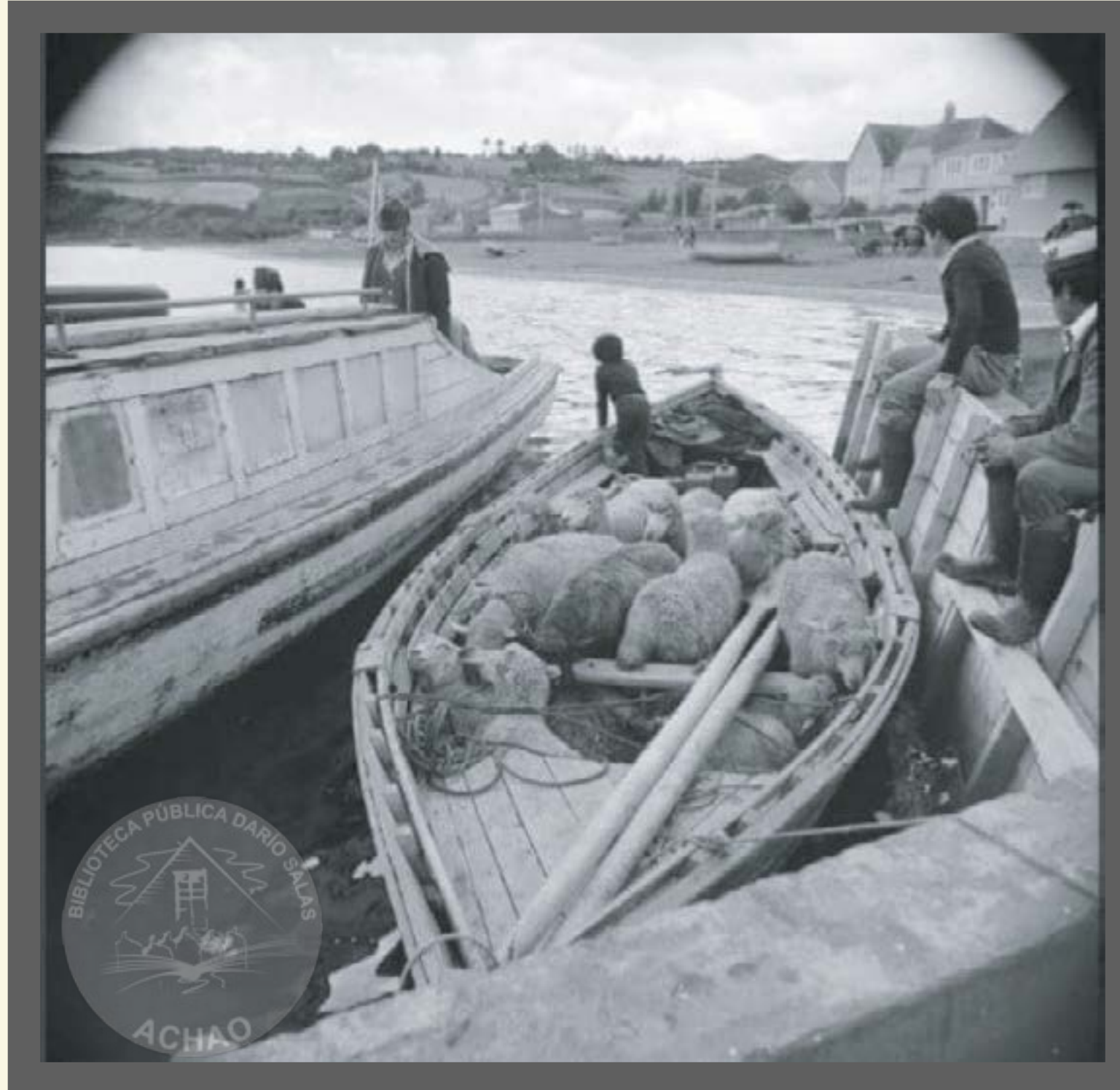
Chalupones cargados de ovinos para la venta de Fiestas de fin de año en el Puerto de Achao año 1964.