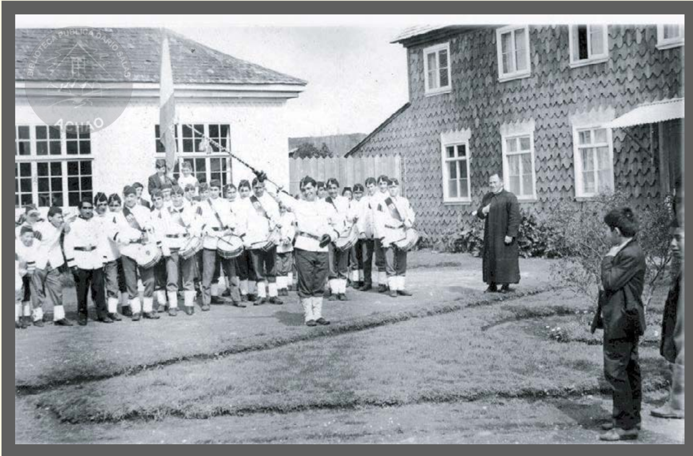
Banda Liceo Ramón Freire año 1963.