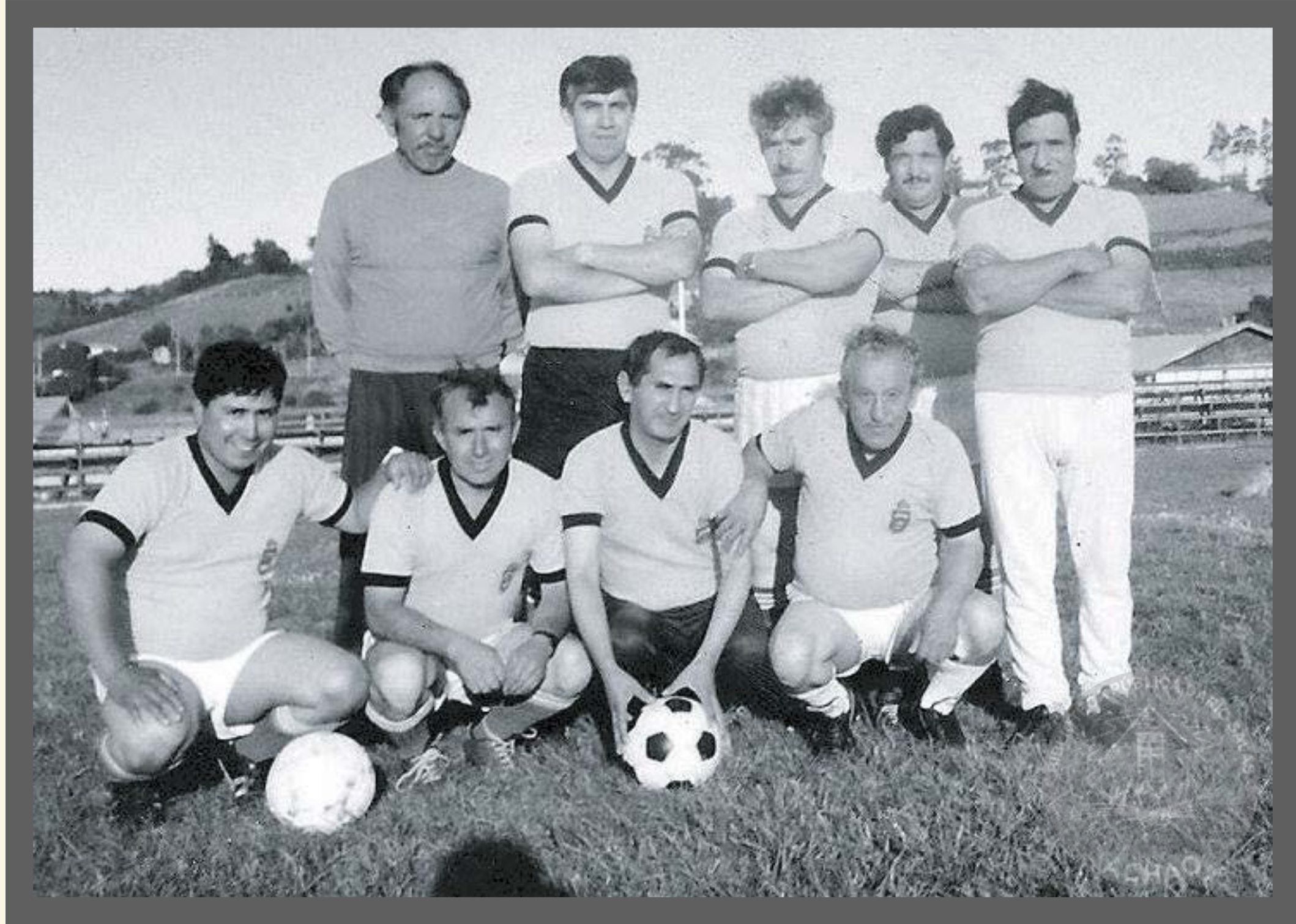
Club Deportivo Porvenir año 1996.