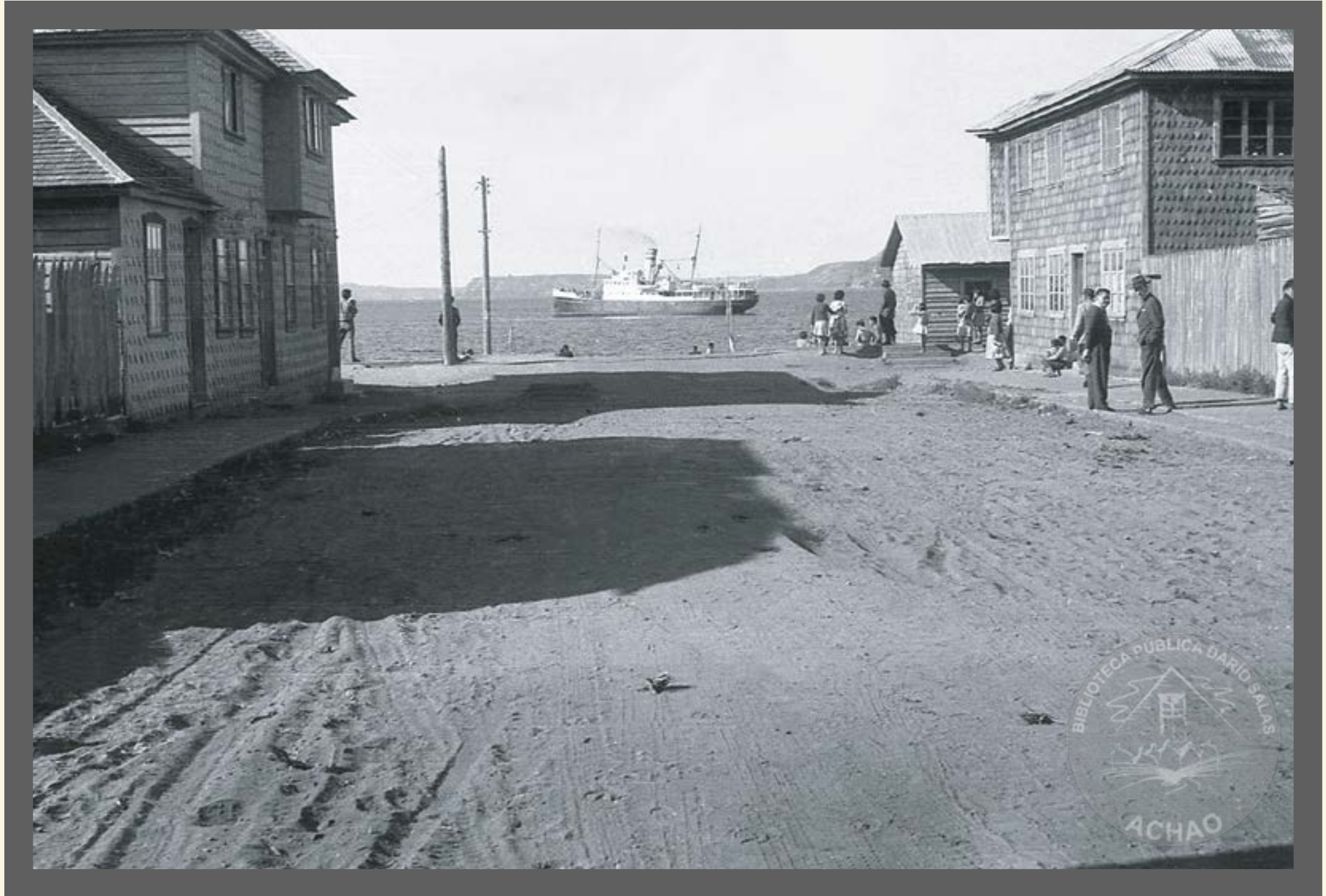
Vapor Trinidad Zarpando desde Achoa a Puerto Montt año 1962.