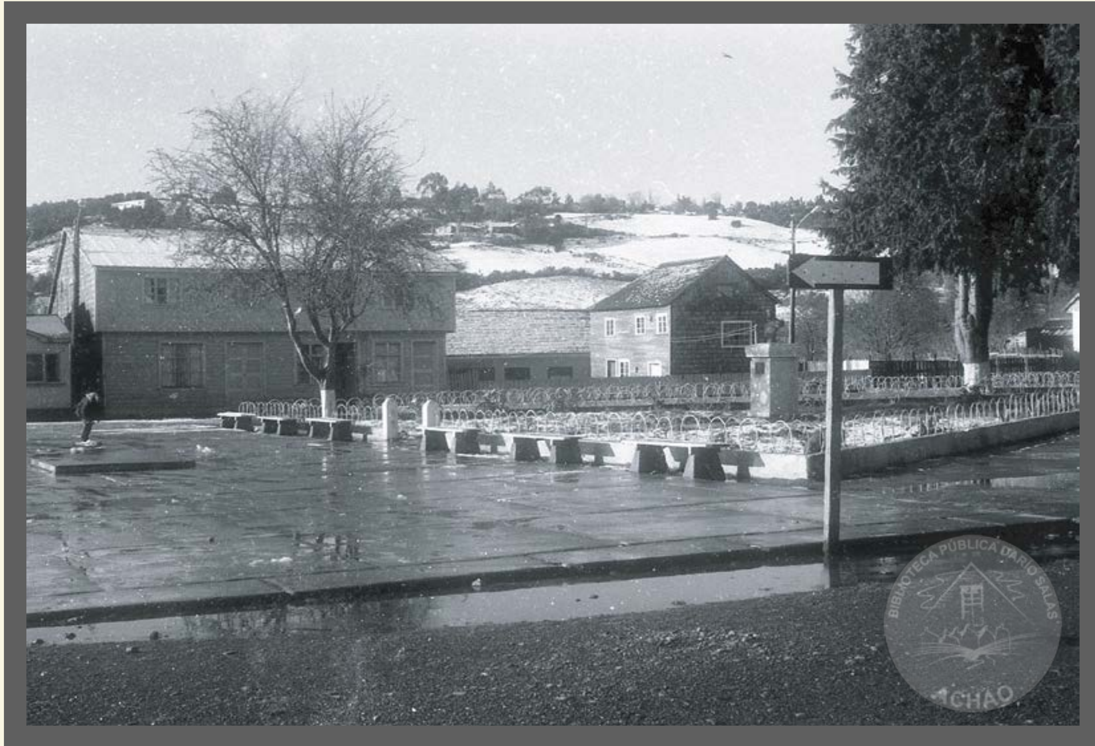
Plaza de Armas de Achao , nevazón año 1972.