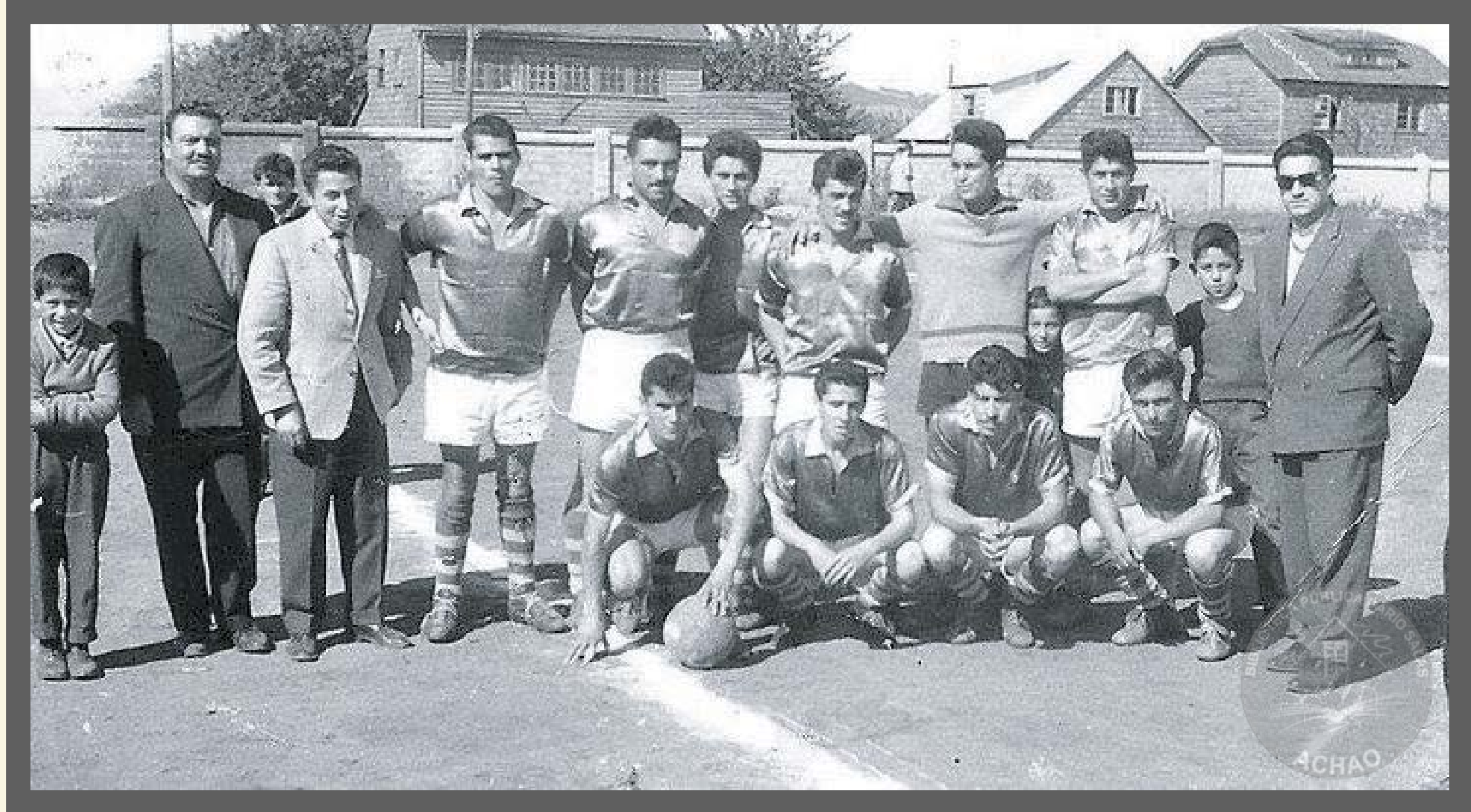
Club Deportivo Porvenir - Decano del futbol achaino año 1965.