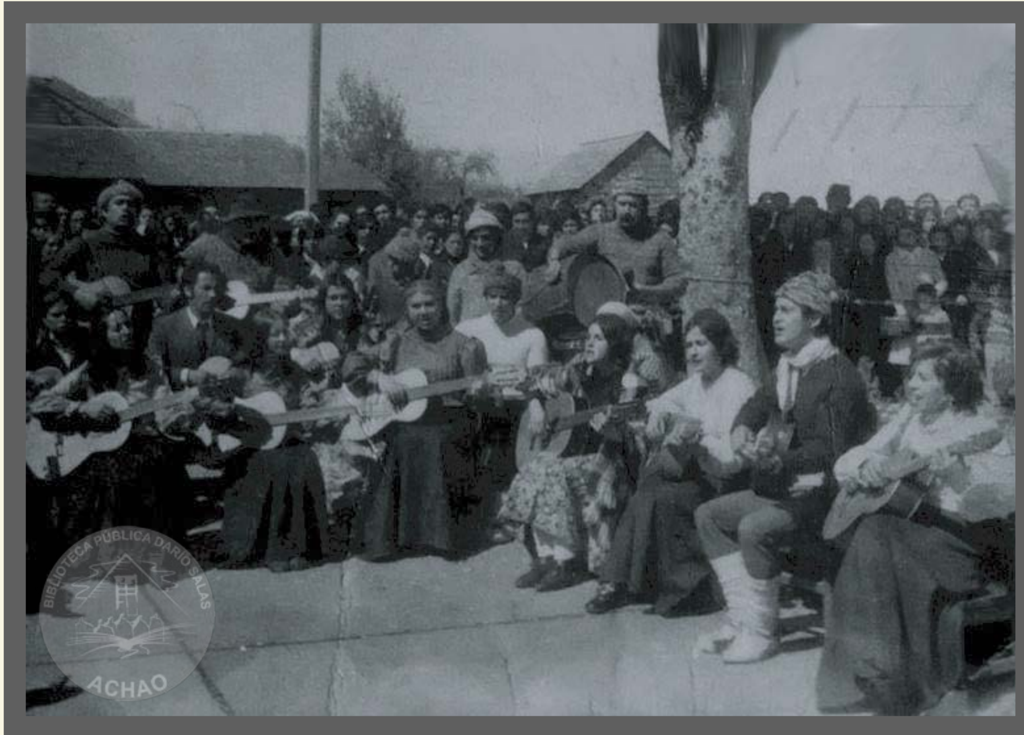
Conjunto de Proyección Folclórica Achao del Magisterio de Quinchao año 1976.