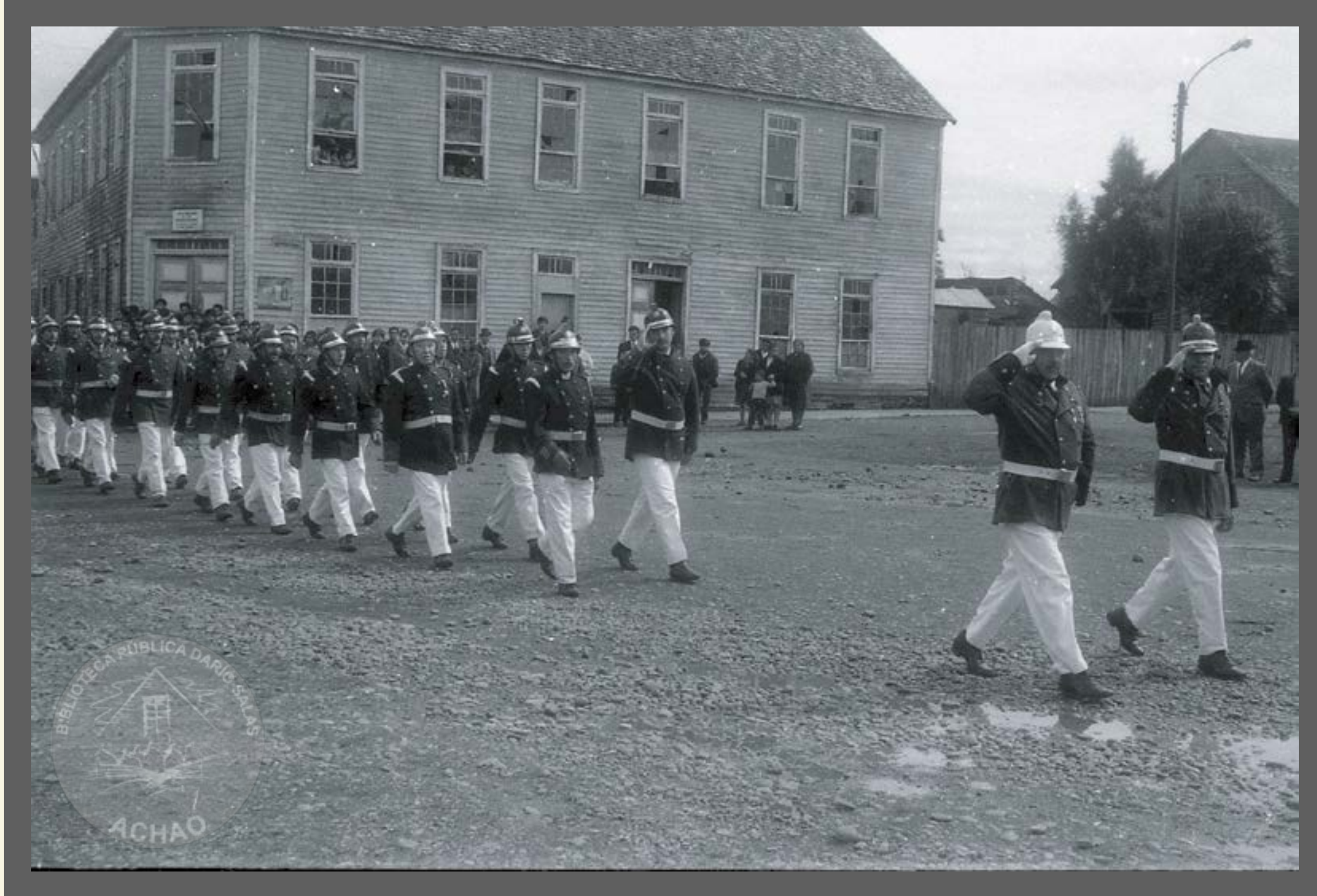
Nostálgico desfile de los voluntarios del Cuerpo de Bomberos Achaó año 1962.