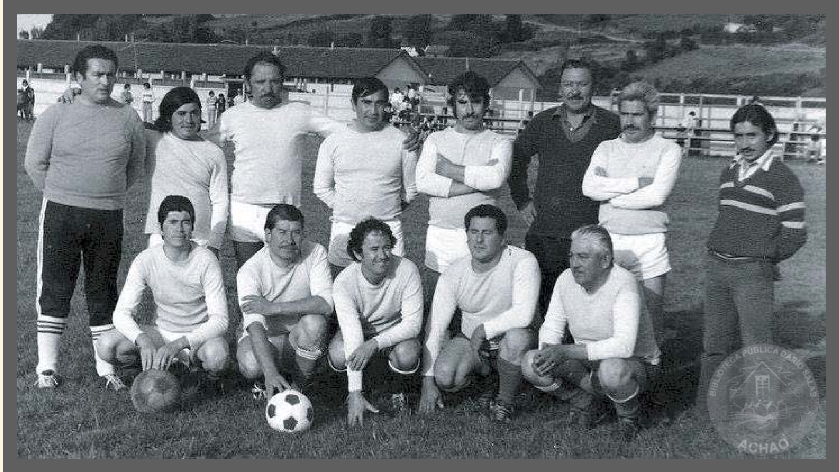
Club Deportivo Porvenir año 1998.