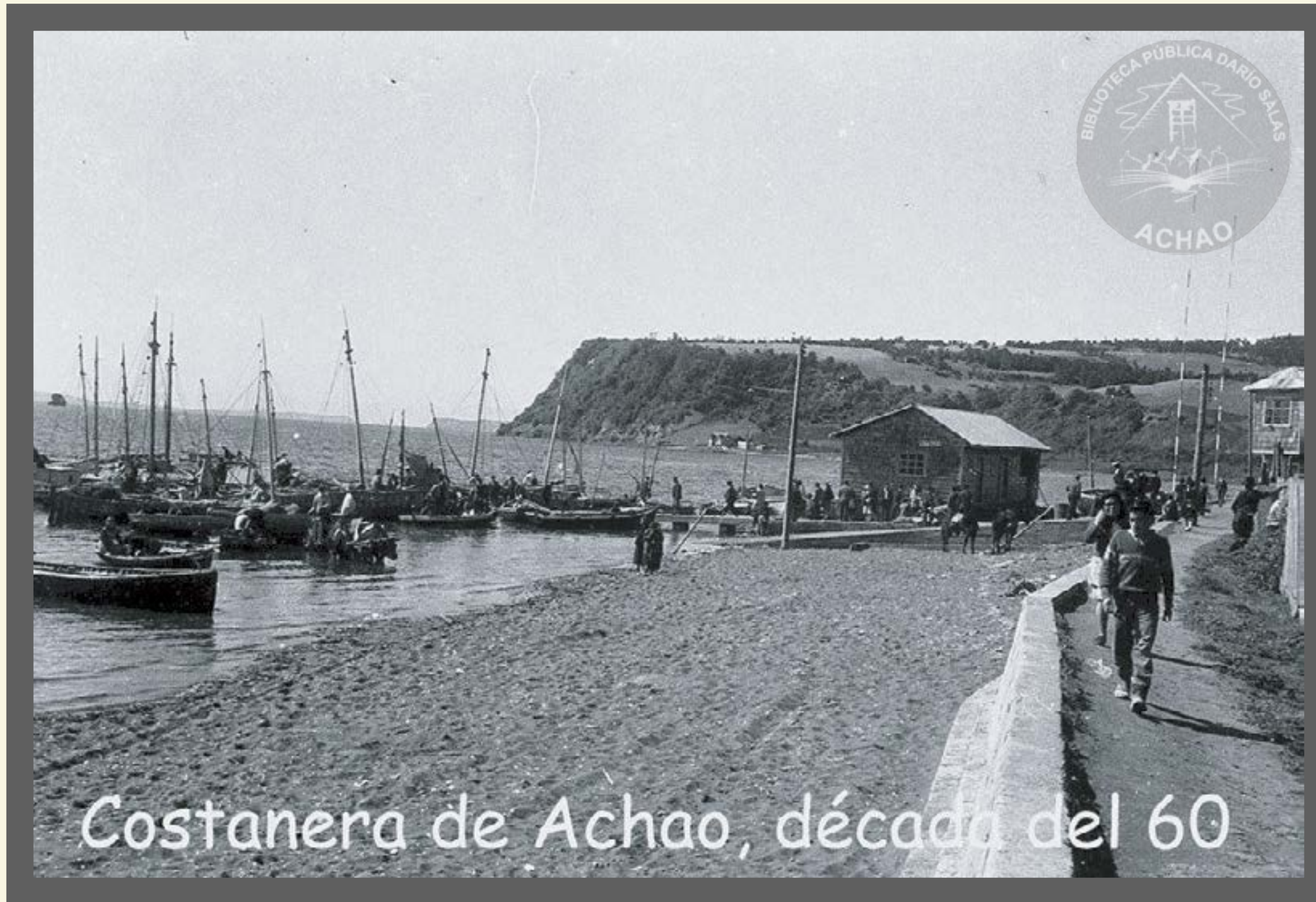
Costanera de Achao , la navegación a vela adornaba el principal centro portuario achaino año 1960.