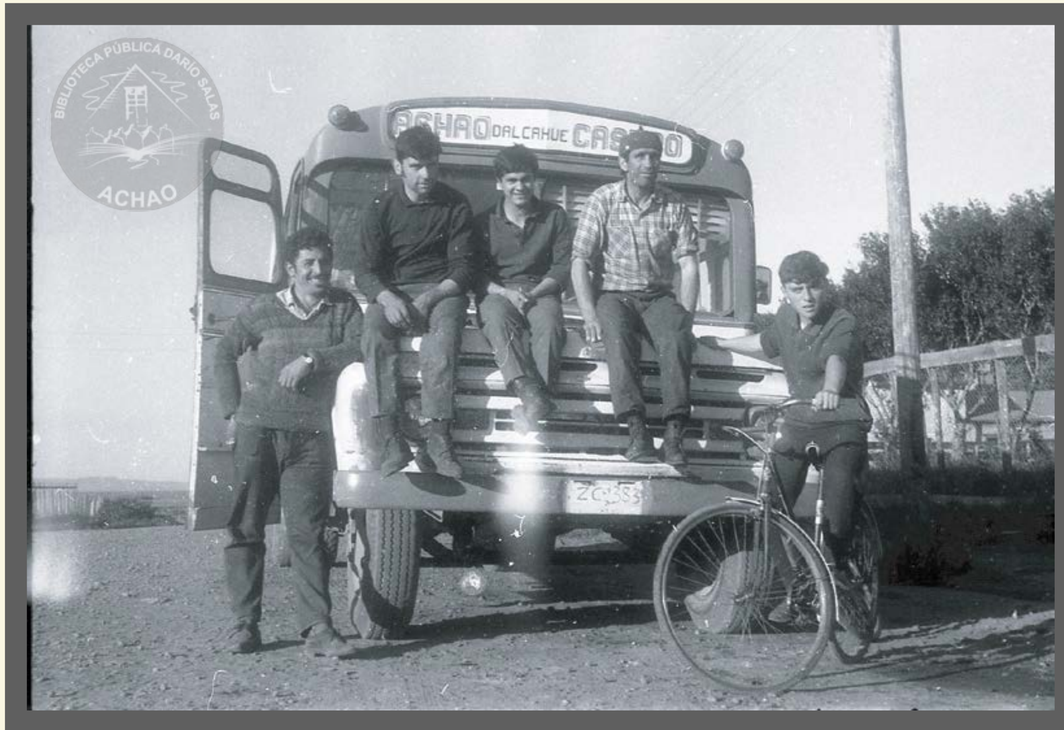
Micro de recorrido Achao , Dalcahue , Castro año 1962.