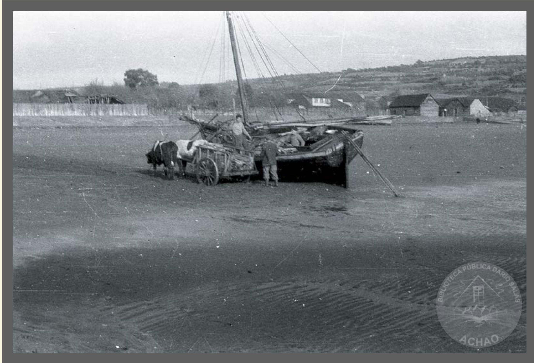
Chulapón a vela varado en el Puerto de Achao en descarga de leña con carreta de bueyes año 1965.