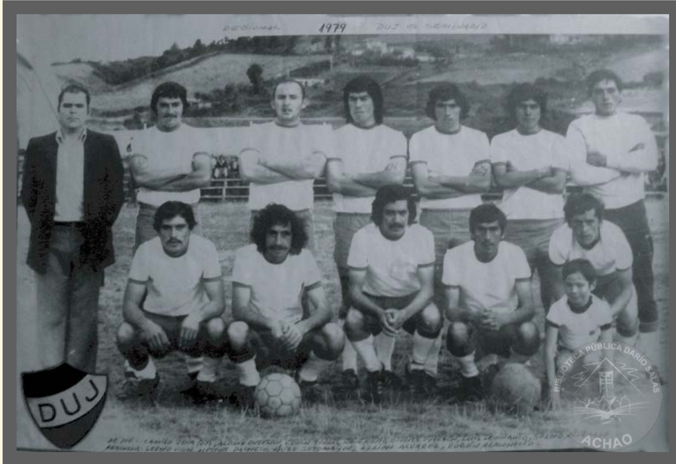
Club Deportivo Unión Juvenil año 1979 quienes entregaron grandes jornadas futbolísticas .