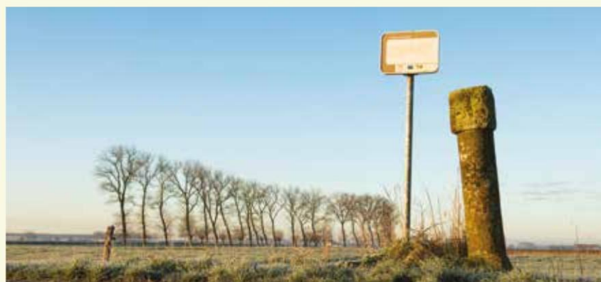
Tiendenpaal in de buurt van de Molenkreek

We volgen nu 90 en daarna voor zo'n dikke kilometer 92 . Hier zie je dat de herstelwerkzaamheden aan