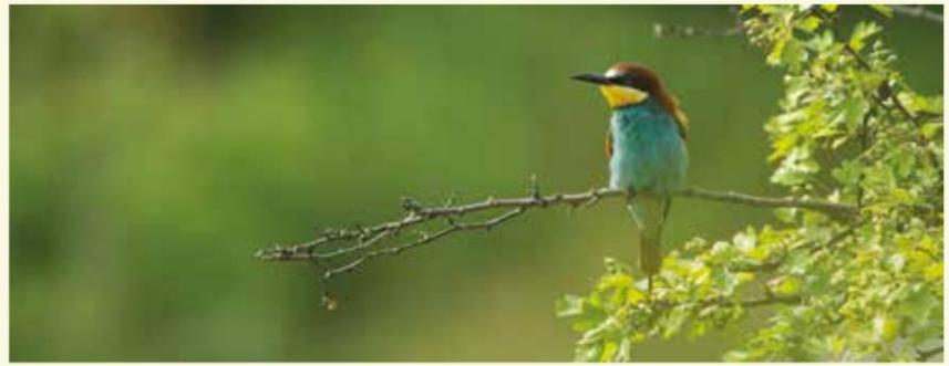
Bijeneter op bezoek