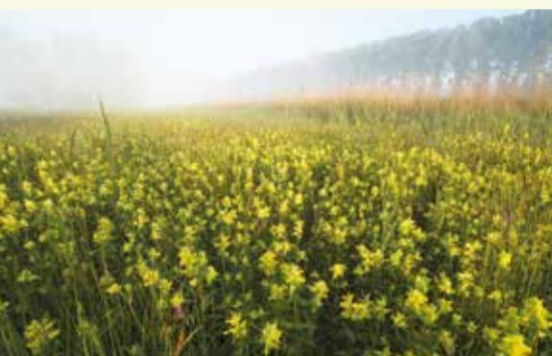
Dotterbloemhoiland met grote ratelaar

De Boerekreek is met zijn 39 hectare de grootste creek van het Meetjesland en is ontstaan in de 16de eeuw. Een deel van deze grote plas wordt gebruikt door het Provinciaal Sportcentrum, een ander deel wordt beheerd door Natuurpunt. Hier kan je kiezen om ofwel op de dijk ofwel onder de dijk te wandelen. Aan de overkant ligt het bloemrijke dottergrasland, van hieruit helaas aan het oog onttrokken.