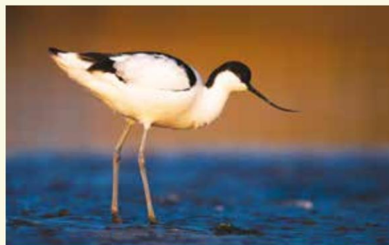
Broedt de kluut hier binnenkort?

er zoutminnende plantjes zoals zilte schijnspurrie, schorrenkruid, zeeaster, zilte rus en kweldergras. Alleen al hun naam ruikt naar zeelucht... Intussen zien natuurliefhebbers reikhalzend uit naar de terugkeer van de kluut als broedvogel aan de Molenkreek.