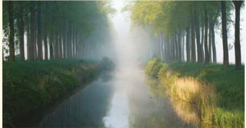
Het Leopoldkanaal is nooit veraf