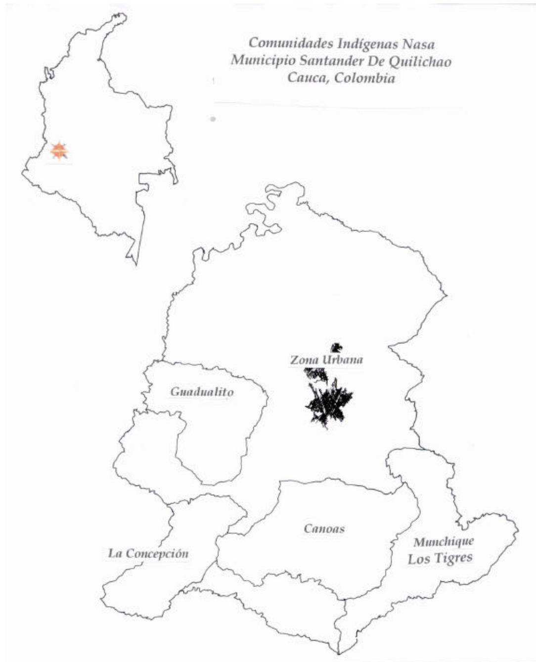
Figura 1. Ubicación geográfica de las comunidades objeto de estudio

En el año de 1542 aparecieron por primera vez relatos de los nasas en las crónicas de Perú y en las de la conquista del Mar del Sur, hechos por Pedro Cieza de León, quien refiere de los nasas, su organización militar, su capacidad de lucha y su resistencia a la dominación. 3