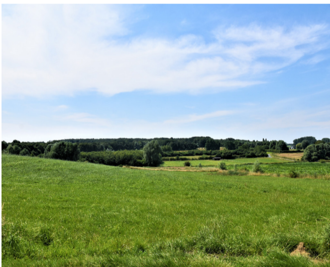
Passendaleveld in Gasthuisbossen Zillebeke