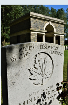
Maple Copse Cemetery