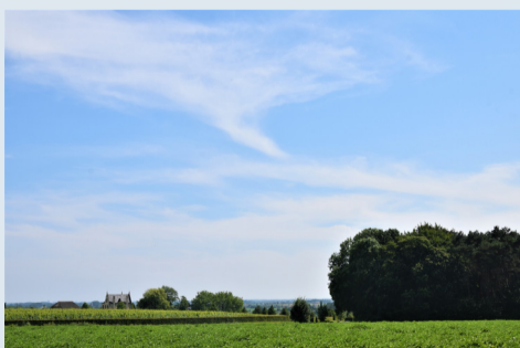
Voddekasteel Papeneist Hollebeke