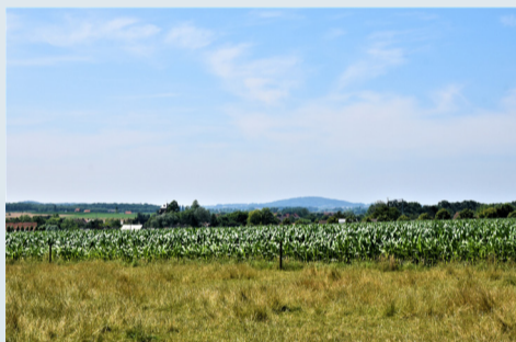
Zicht op Zillebeke en Kemmelberg vanuit Schachtweidestraat