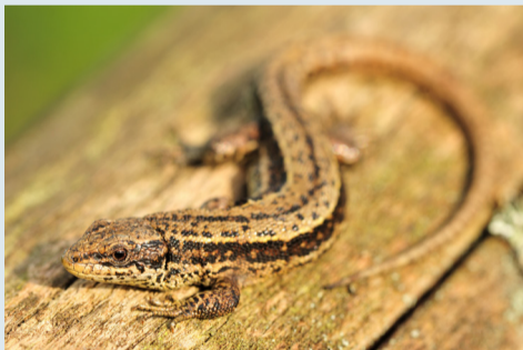
Levendbarende Hagedis