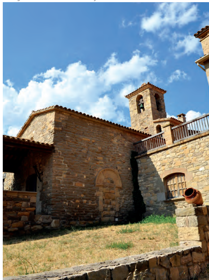
Vista general del estado actual del edificio

Tiene nave única cubierta por bóveda de cañón, largo tramo presbiterial y ábside semicircular. Desde el exterior de la iglesia se puede apreciar el aparejo original de la nave, que debido a su aspecto regular y de pequeño tamaño parece obra del siglo XI. En la zona superior del muro meridional se verifica un cambio de aparejo y una puerta ciega de medio punto formada por grandes dovelas y chambrana. Desde una de las construcciones adosadas se aprecia el aparejo del ábside y parte del muro meridional, donde encaja una ventana de medio punto tapiada. Una cornisa recorre el nivel superior del ábside, perforado por una pequeña ventana de medio punto orientada hacia el sureste. Sobre el ábside se alza un campanario de planta cuadrada de factura moderna, aunque conserva arquillos ciegos pertenecientes al campanario del