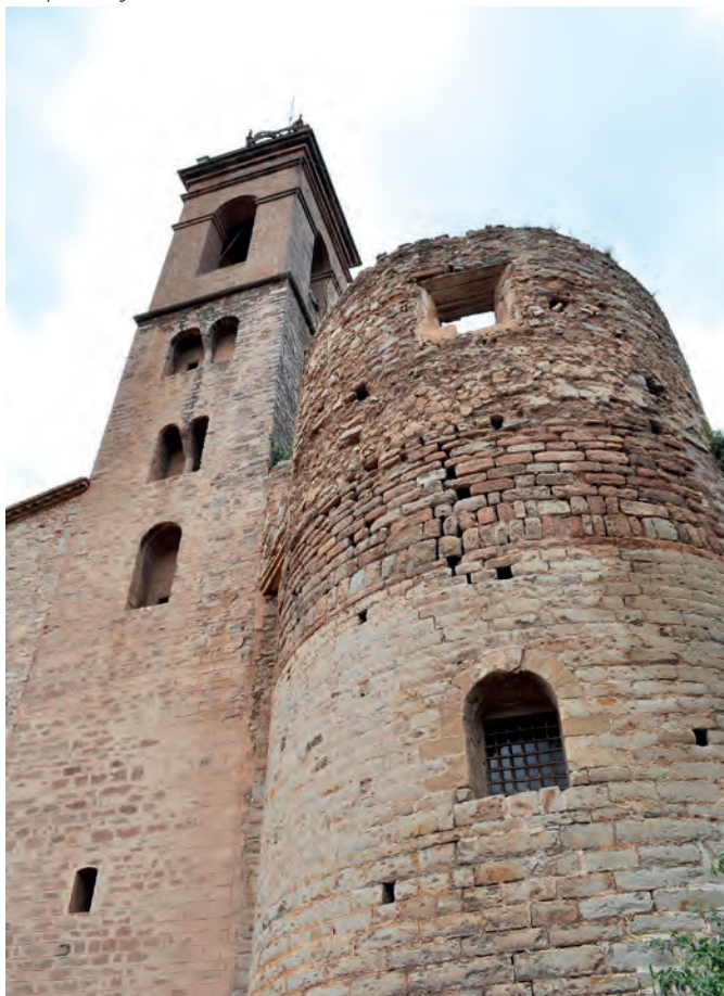
Campanario y ábside