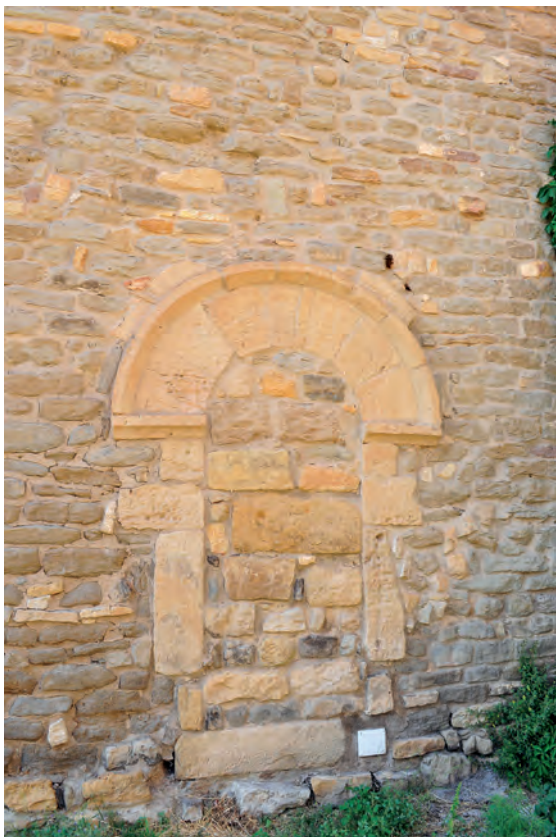
Puerta de entrada original