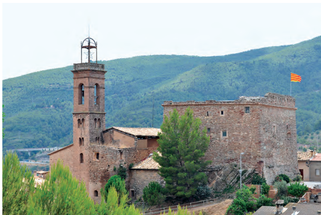
Vista general de la torre del homenaje junto a la iglesia de Nostra Senyora del Roser

993. Entre 1018 y 1025 la condesa Ermessenda de Barcelona recibió juramento de fidelidad del conde Guifré de Cerdanya, propietario de castillos como el de Súria, que más tarde fue infeudado a los señores de Cardona. El castillo pasó después a las familias Calders, Rocafort y Òdena. En 1360 los señores de Cardona enajenaron a Pedro el Ceremonioso la jurisdicción de los castillos de Súria y Castelladral, que mantuvieron hasta la abolición de los señoríos feudales a inicios del siglo XIX.