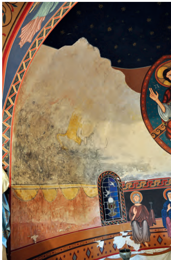
Restos de pinturas originales y reconstrucción pictórica neorrománica

siglo XI. En el ábside subsisten restos de pintura mural muy degradados, que contrastan con las pinturas neorrománicas que decoran el templo. Hacia el lado del evangelio se ven cortinajes bermejos que cuelgan de un soporte amarillo y un león alado sobre fondo gris que parece representar al evangelista Marcos.