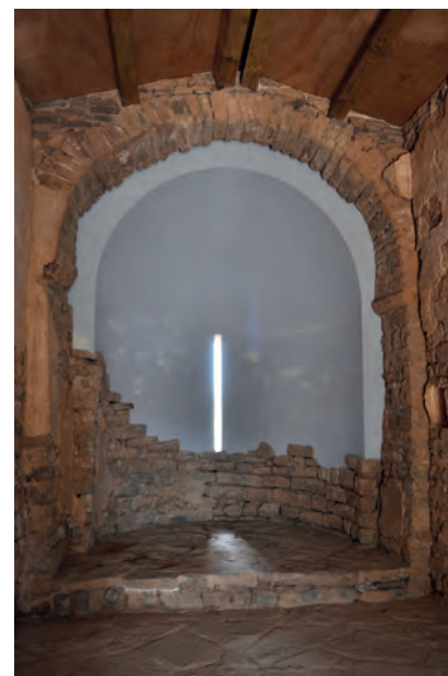
Restos del antiguo ábside en el interior