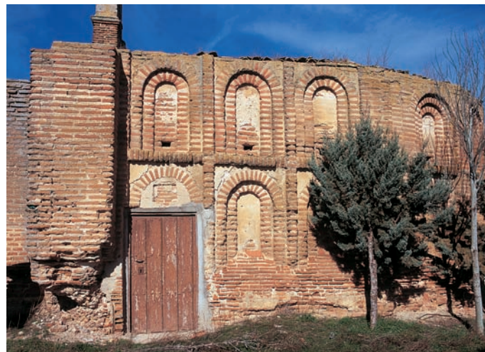
Fachada sur del presbiterio

incluso hasta el segundo tercio del siglo XIII, si bien hemos de reconocer que tampoco nuestros argumentos gozan de incontestable solidez.