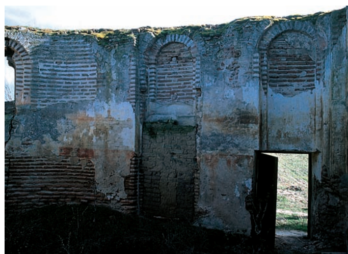
Detalle del interior de la cabecera

BARRIOS GARCÍA, Á., 1997, pp. 242, 262; BARRIOS GARCÍA, Á., 1981, pp. 124, 216, 412-415; CASASECA CASASECA, A., 1984, pp. 124-133; CASASECA CASASECA, A. y NIETO GONZÁLEZ, J. R., 1982, p. 106; ENRÍQUEZ DE SALAMANCA, C., 1989, pp. 89, 90; GARCÍA DE FIGUEROLA, B., 1996, pp. 98, 99; GÓMEZ-MORENO, M., 1967, pp. 405, 406; LLORENTE MALDONADO DE GUEVARA, A., 1976, pp. 35, 99, 118, 130; MADOZ, P., 1845-1850 (1984), p. 86; MARTÍNEZ DÍEZ, G., 1983, pp. 553-570; MORÁN BARDÓN, C., 1946 (1982), p. 108; PÉREZ HIGUERA, M.ª T., 1993, p. 69; PRIETO PANIAGUA, M.ª R., 1980, pp. 60-62; SÁINZ SAÍZ, J., 1991, p. 64; VACA LORENZO, Á. y BONILLA HERNÁNDEZ, J. A., 1987, doc. 49.