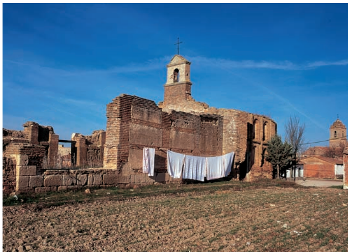
Vista general desde el suroeste

Entre los restos de enlucidos que se conservan en esta cabecera se llegan a ver algunos retales de toscas pinturas murales, geométricas, aunque no corresponden a la misma cronología que la construcción, pudiéndose fechar tal vez hacia las postrimerías de la Edad Media. Estas pinturas decoraban también el arco toral, de medio punto, hoy cegado, reforzado al exterior por gruesos contrafuertes.