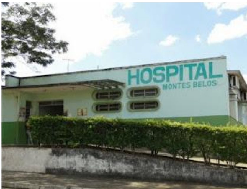
Foto do hospital da cidade