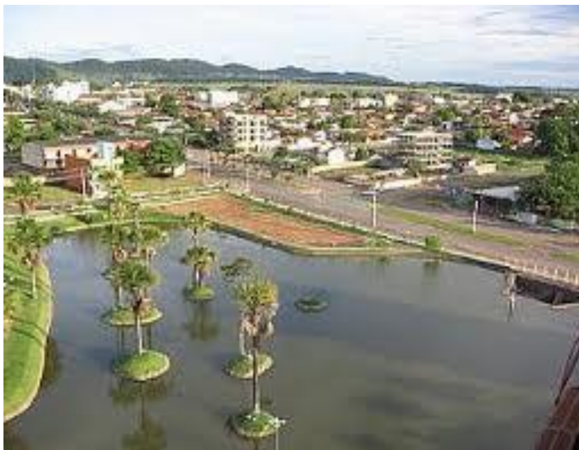
Foto panorâmica da cidade de São Luís de Montes Belos