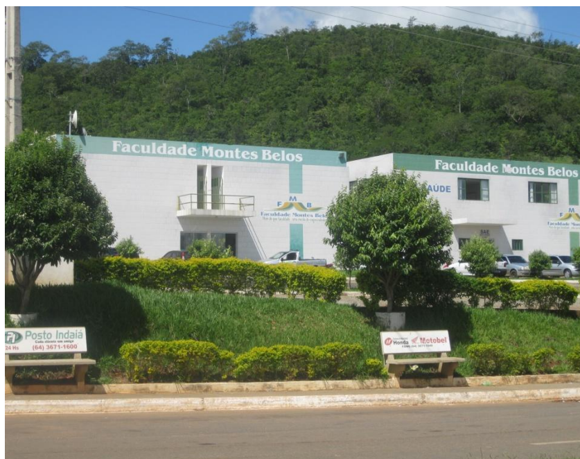
Foto da faculdade Montes Belos