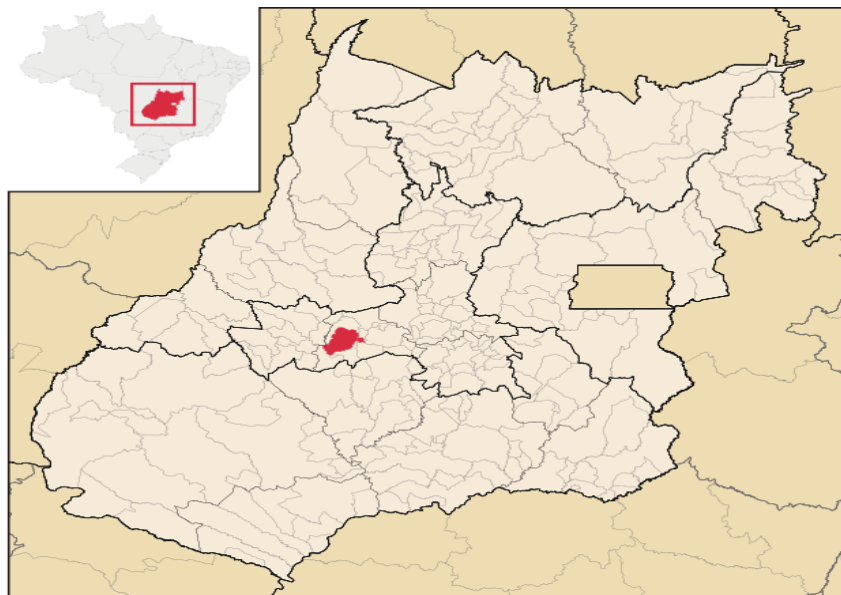
Localização de São Luís de Montes Belos

O município de São Luis de Montes Belos está localizado na microrregião de Anicuns, situado a 120 km de Goiânia, a Capital do estado e a 326 KM de Brasília ( Capital Federal ). e possui uma área de 826,189 km².