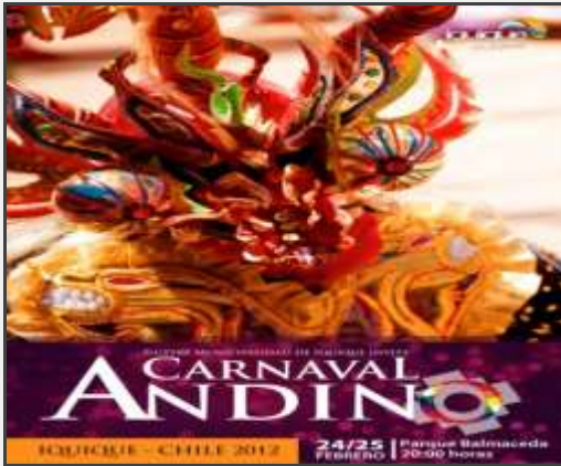
CARNAVAL ANDINO IQUIQUE - CHILE 2012 24/25 FEBRERO | Parque Sotomaceda 20:00 horas

Muestras de bailes nacionales e internacionales del Altiplano de la región de Tarapacá.