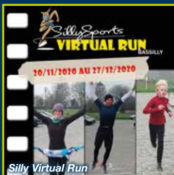
Silly Virtual Run