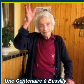
Une Centenaire à Bassilly