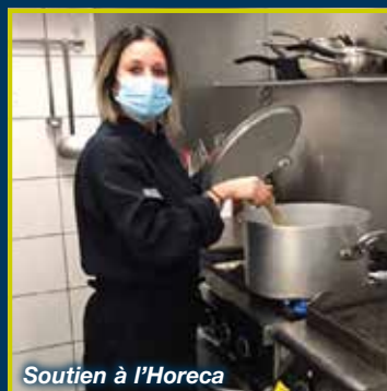
Soutien à l'Horeca