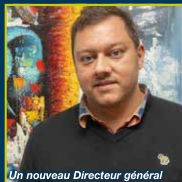
Un nouveau Directeur général

Bulletin officiel d'information de la Commune de Silly – Décembre 2020